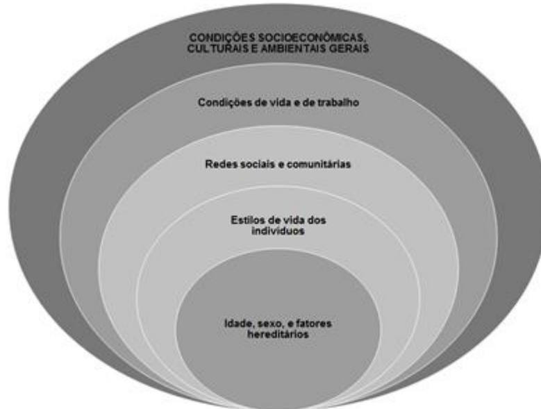
Figura 2. Os determinantes sociais da saúde modelo visual de Dahlgren e Whitehead.

além das escolhas e estilos de vida individuais, as redes sociais e comunitárias, as condições de vida e trabalho e, por fim, as condições socioeconômicas, culturais e ambientais. A perspectiva da flor totalmente pintada faz alusão gráfica aos DSS conforme o modelo de Dahlgren e Whitehead (figura 2) 12 , onde os determinantes também estão dispostos em camadas.