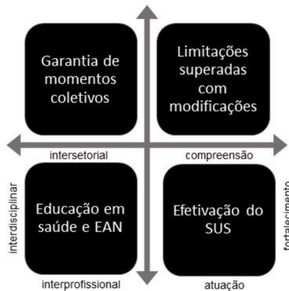
Figura 4. Considerações sobre o desenvolvimento de ferramenta de EAN.

O horizonte de um Brasil soberano, alicerçado nos direitos sociais e humanos de cidadania, participativo e radicalmente democrático é uma perspectiva que exige a compreensão das contradições existentes. O desenvolvimento de uma ferramenta de EAN manifesta-se como uma ação otimista diante de um contexto de retrocessos sociais, políticos e econômicos do País.