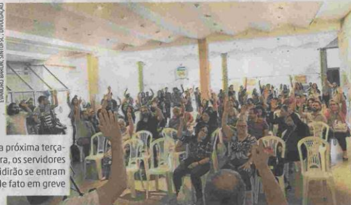
Na próxima terça-feira, os servidores decidirão se entram de fato em greve