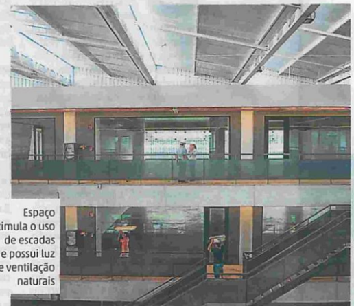
Espaço estimula o uso de escadas e possui luz e ventilação naturais

Outro quesito inovador e único em Joinville é o elevador inteligente, que opera com técnica de regeneração energética, capaz de gerar energia ao equipamento ou então, para o próprio prédio.