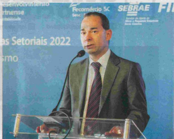
Gestão de Ziguelli foi baseada no fortalecimento da indústria, comércio, serviços e agronegócio

Nesta derradeira entrevista, Ziguelli lembra dos avanços que o sistema Sebrae alcançou no Estado. Para ele, o grande ativo do sistema são os funcionários e o apoio daqueles que enxergam no Sebrae a possibilidade de dar novos saltos aos seus negócios. ●