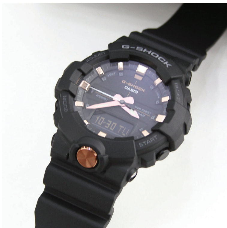
Relógio G-Shock Black editado e colocado na vitrine virtual da loja.