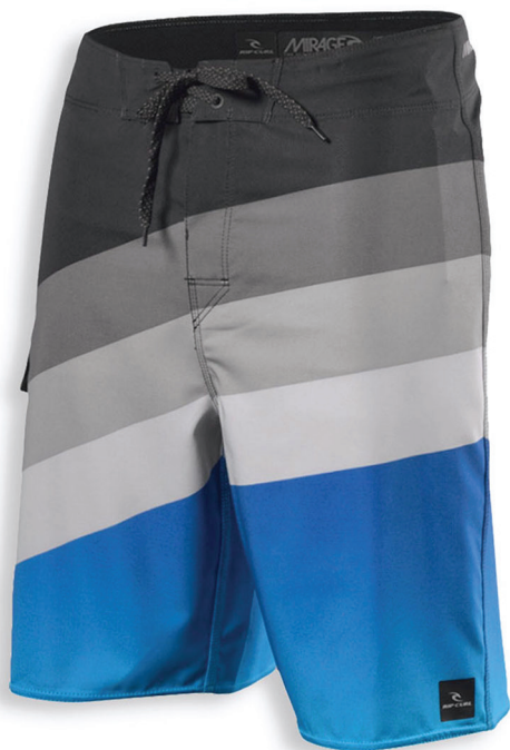
Bermuda Rip Curl editada para ser colocada na vitrine virtual do site.