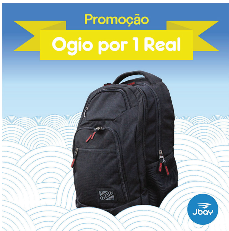
Banner para sorteio “Ogio por 1 real”.

Público-alvo: cleinte (ou nao) que seguem a loja no Instagram.