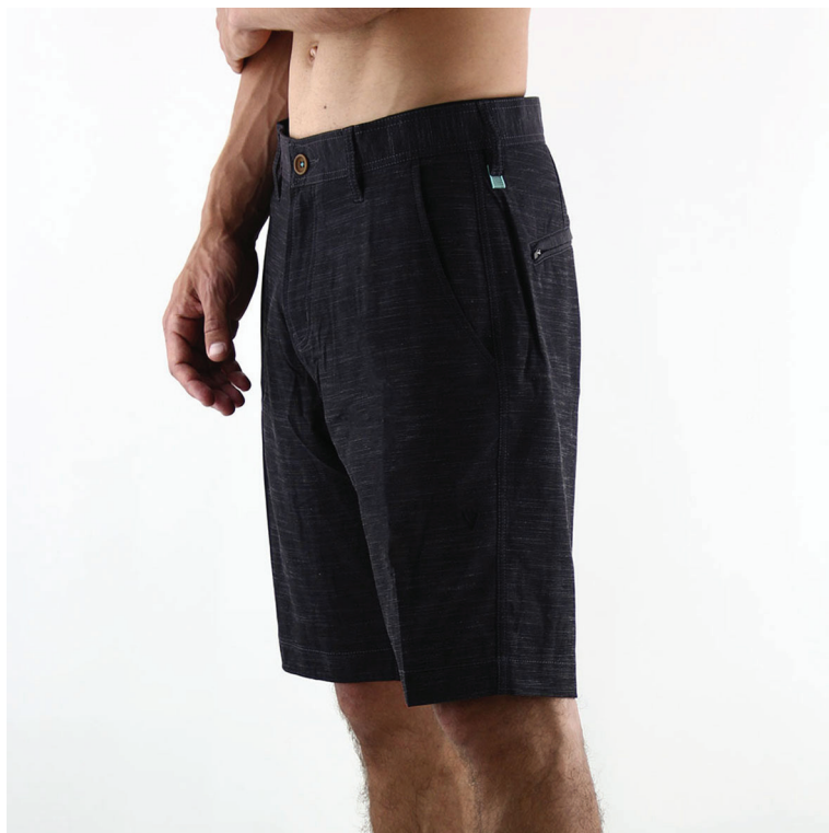
Boardshort editado e colocado na vitrine virtual da loja. Marca: Rip Curl.