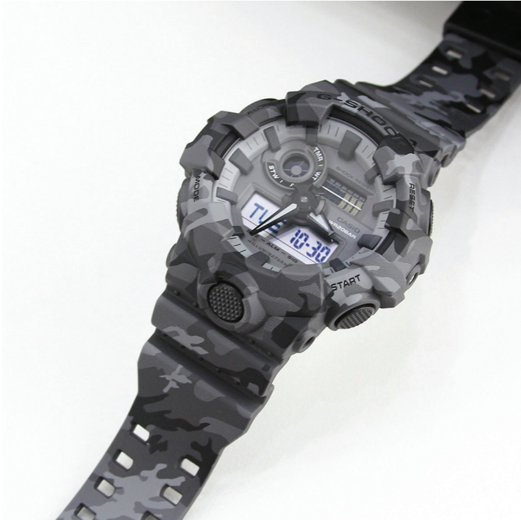
Relógio G-Shock editado e colocado na vitrine virtual da loja.