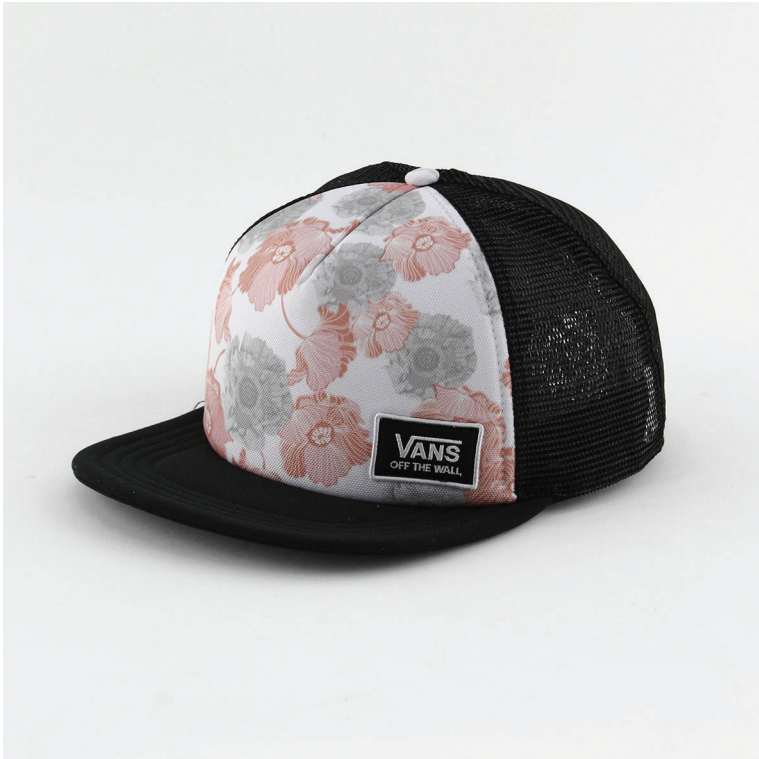
Boné Vans editado para vitrine Virtual.