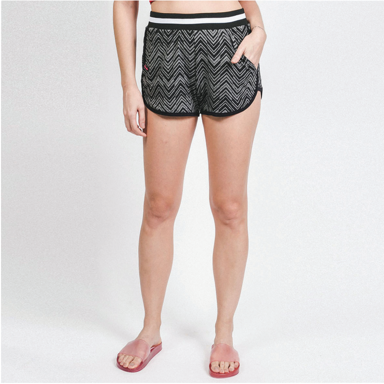
Short Riu kiu editado e pronto para ser colocado no site.