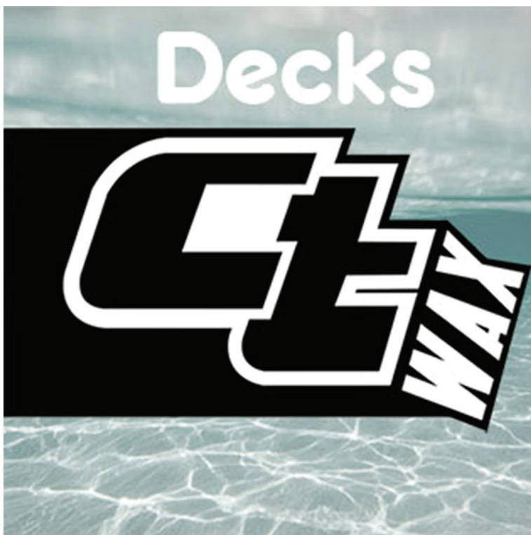
Banner de destaque para os decks da marca CT Wax

Público-alvo: Surfistas que buscam um novo deck para suas pranchas.