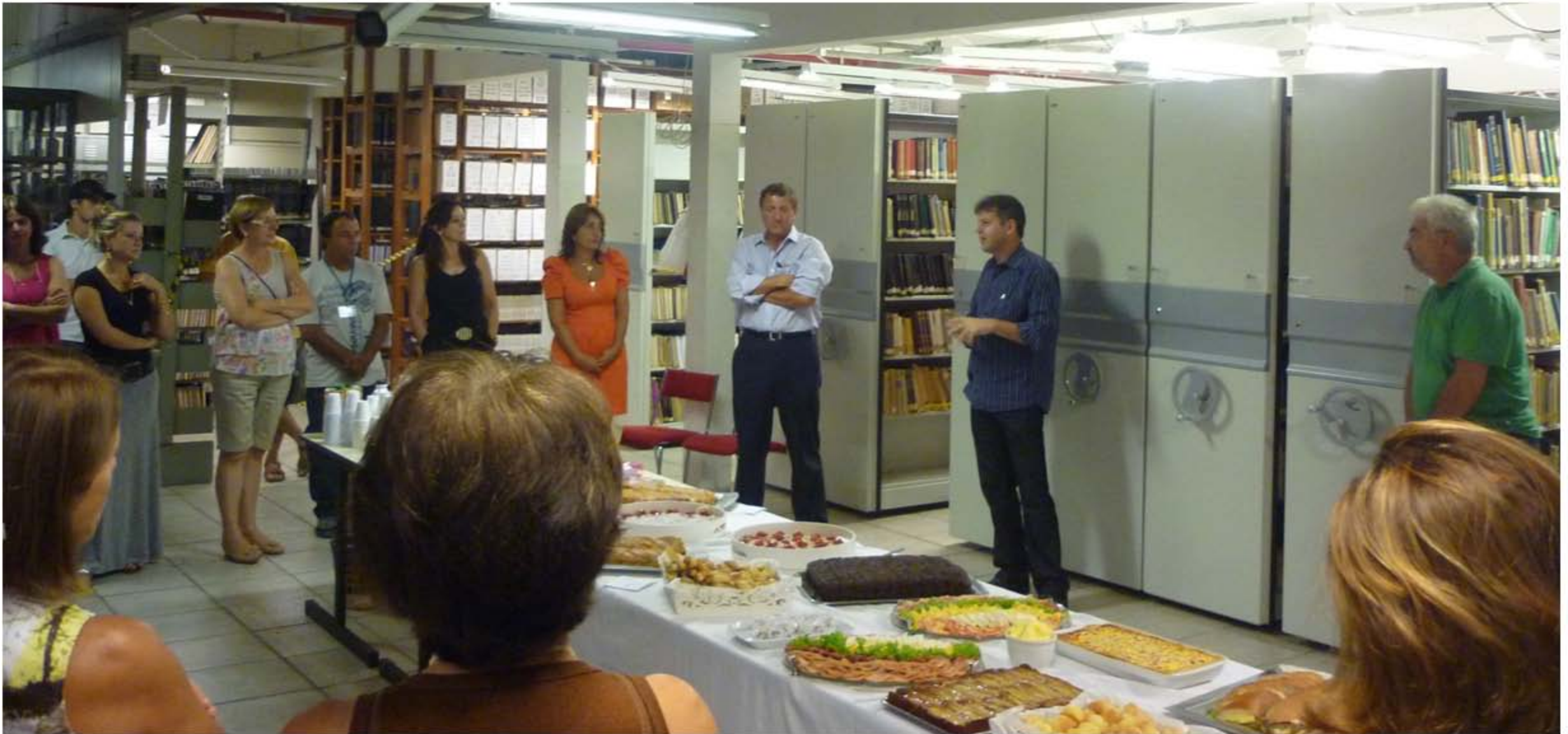
Inauguração do Armazém na BC - Ano 2012