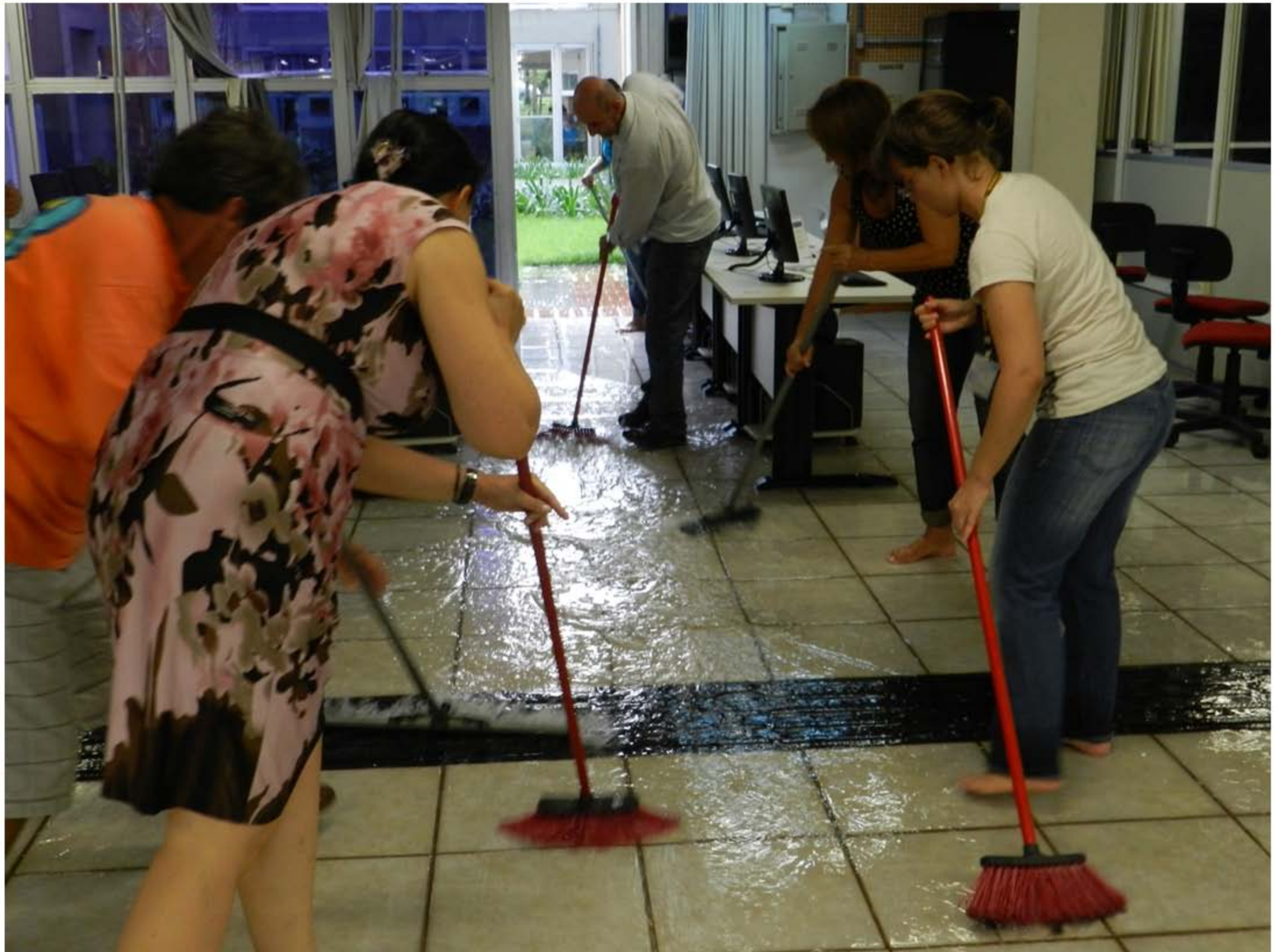
Inundação na Biblioteca Central - Ano 2012