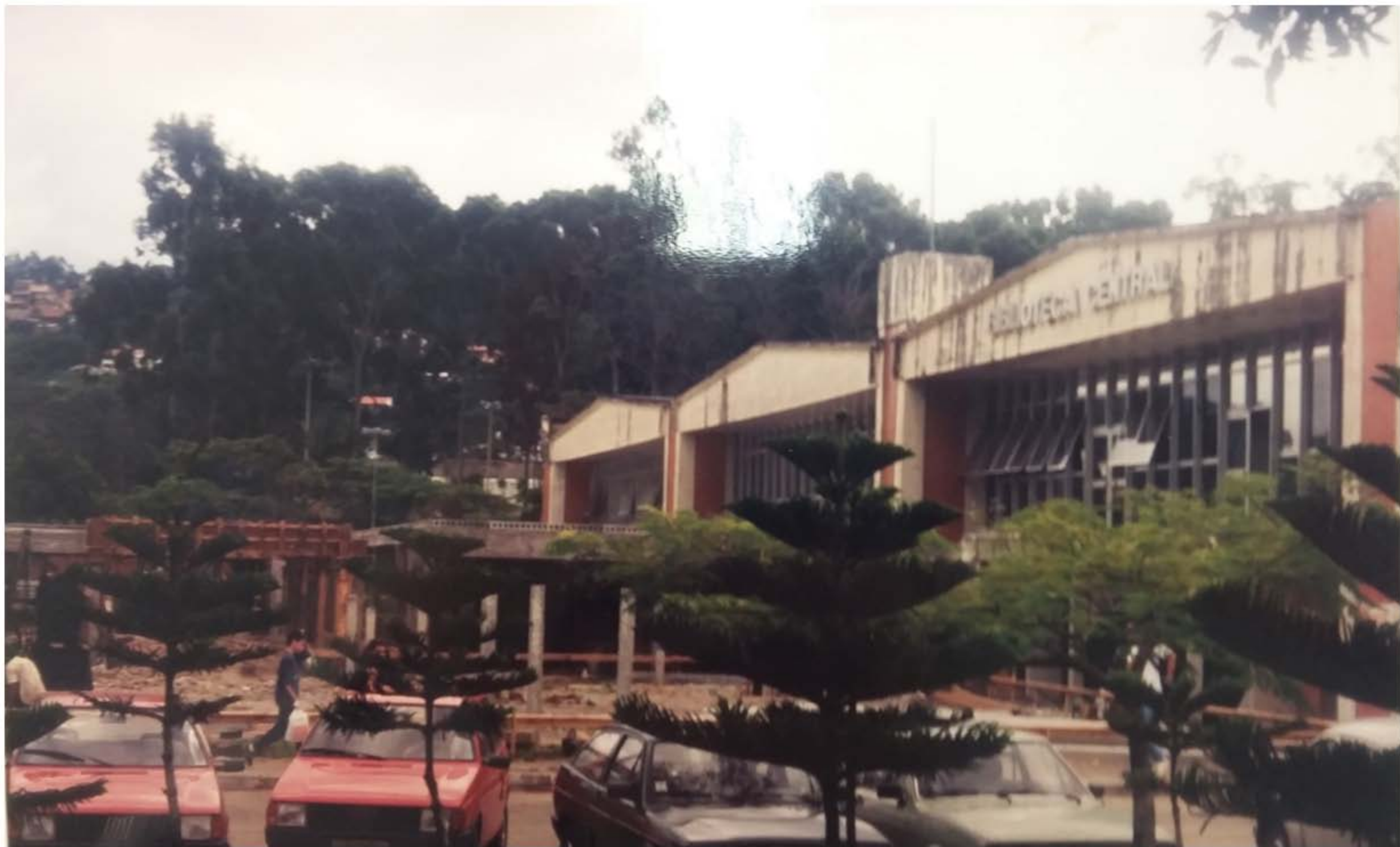
Reforma e Ampliação do Prédio da BC - Anos de 1995/1996