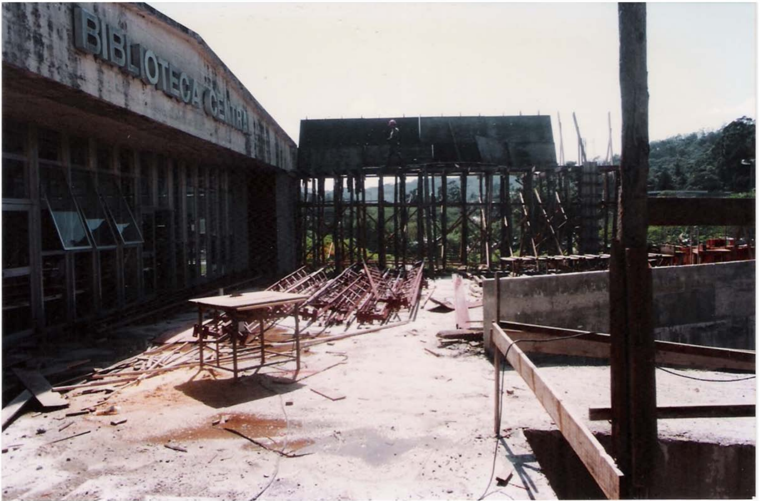
Reforma e Ampliação do Prédio da BC - Anos de 1995/1996