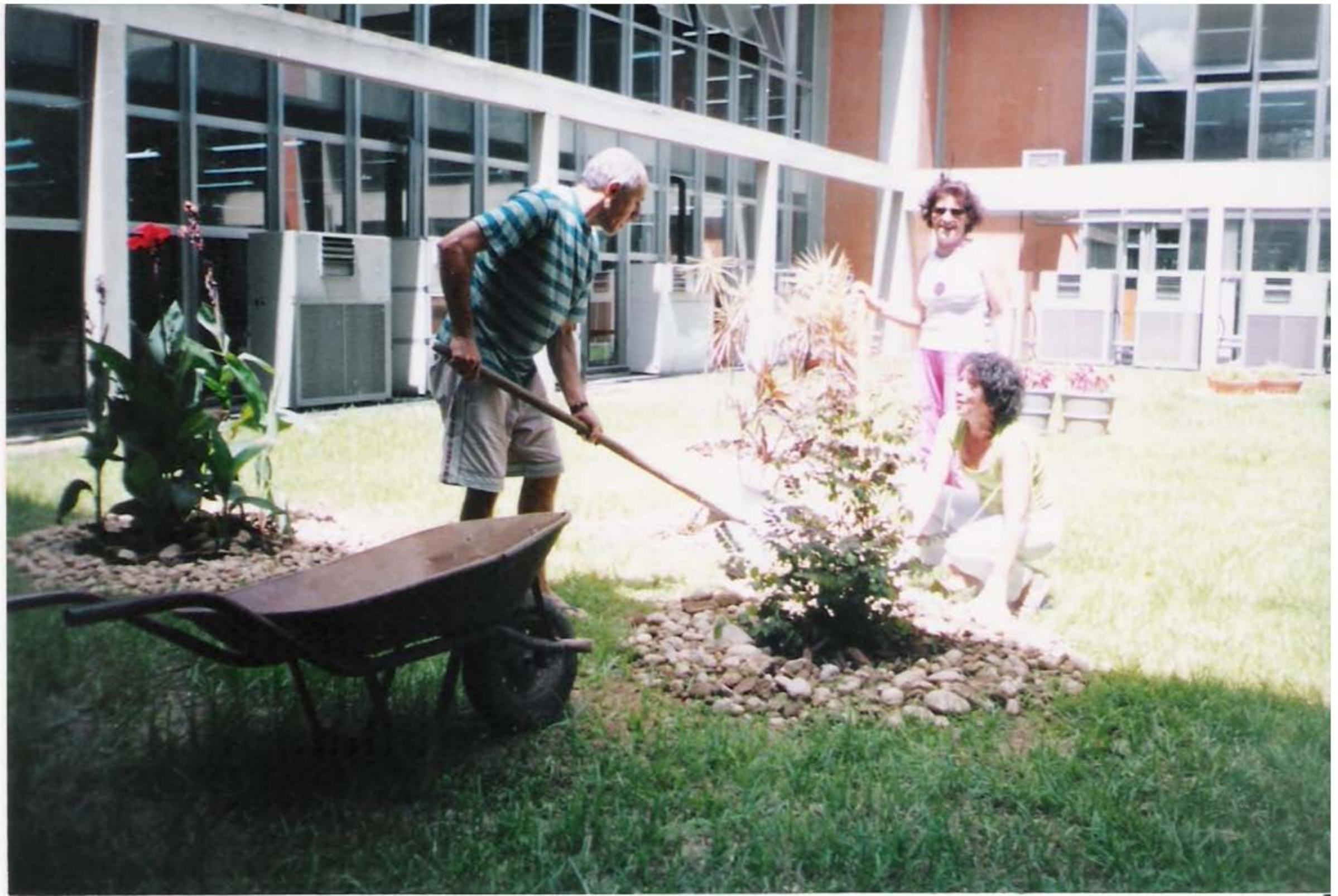
Biblioteca Central, jardim interno – Ano 2000