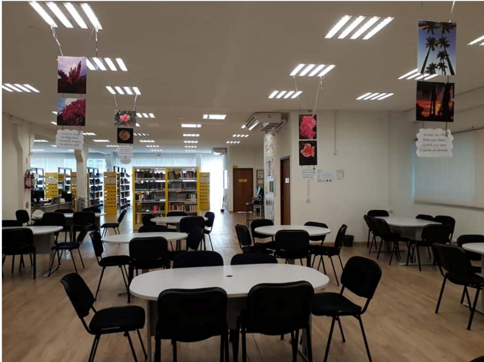
Biblioteca Setorial de Blumenau – Ano 2018