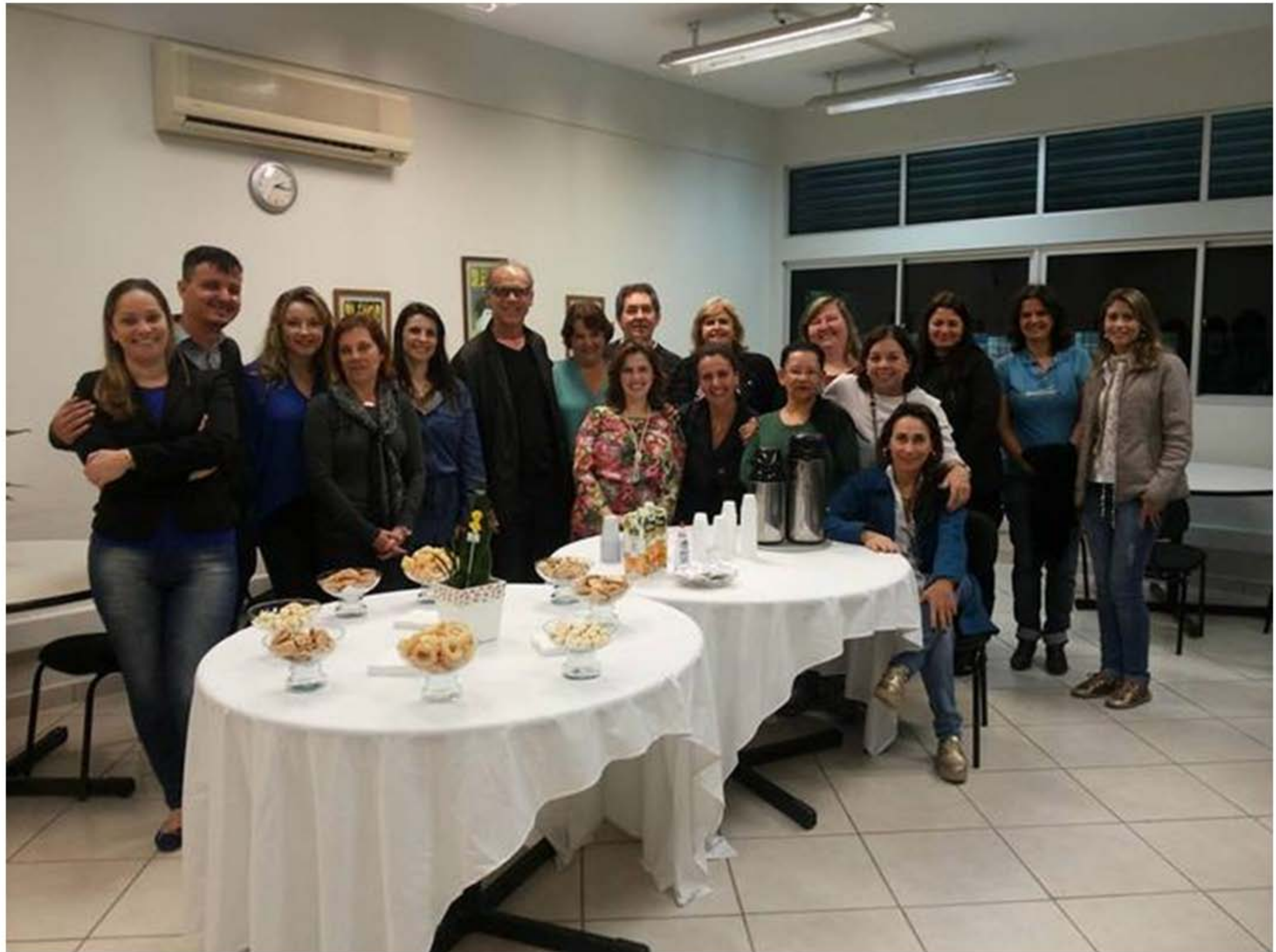
Novo layout da Biblioteca Setorial do CED – Ano 2015