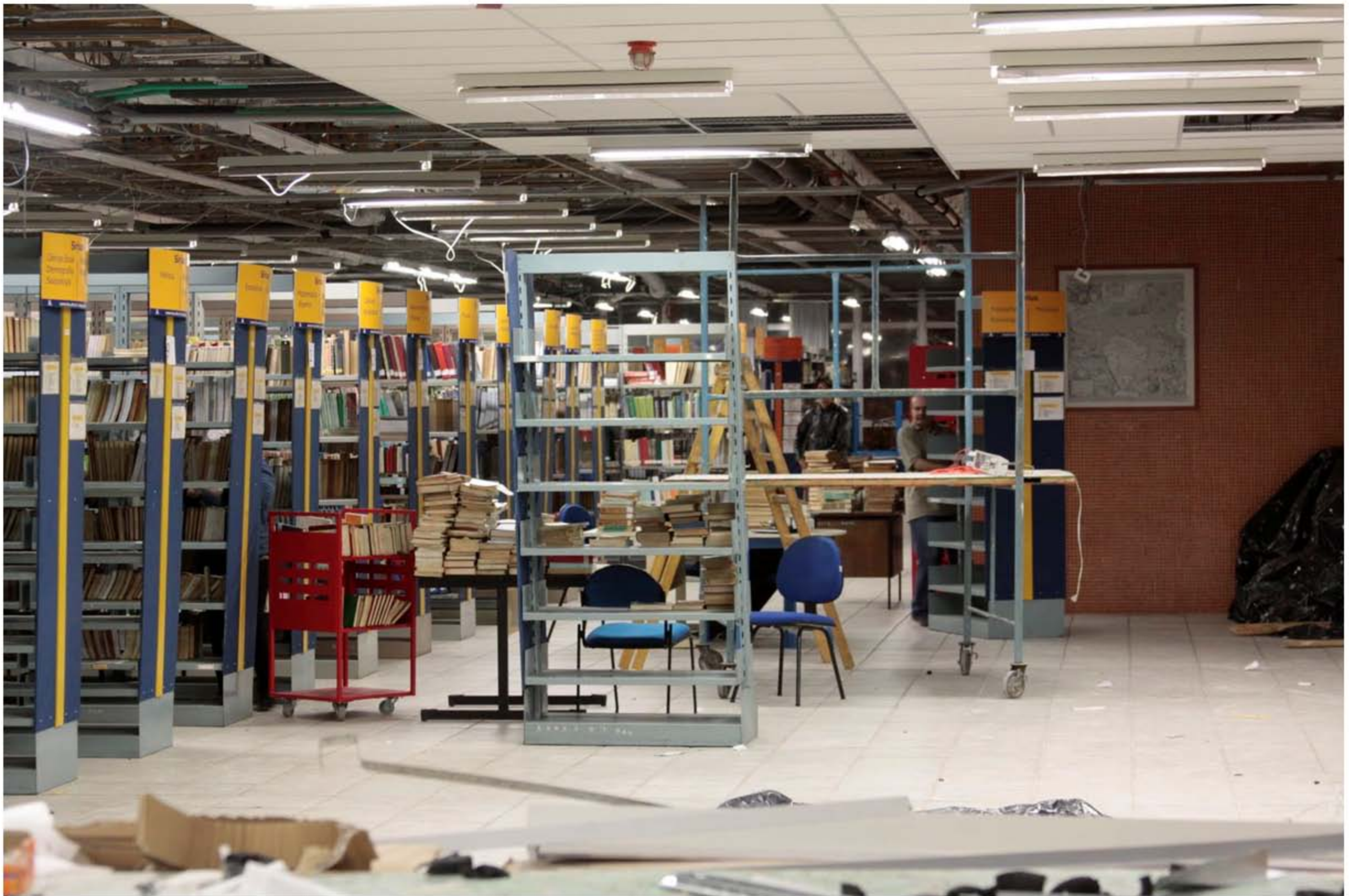
Climatização na Biblioteca Central - Ano 2011