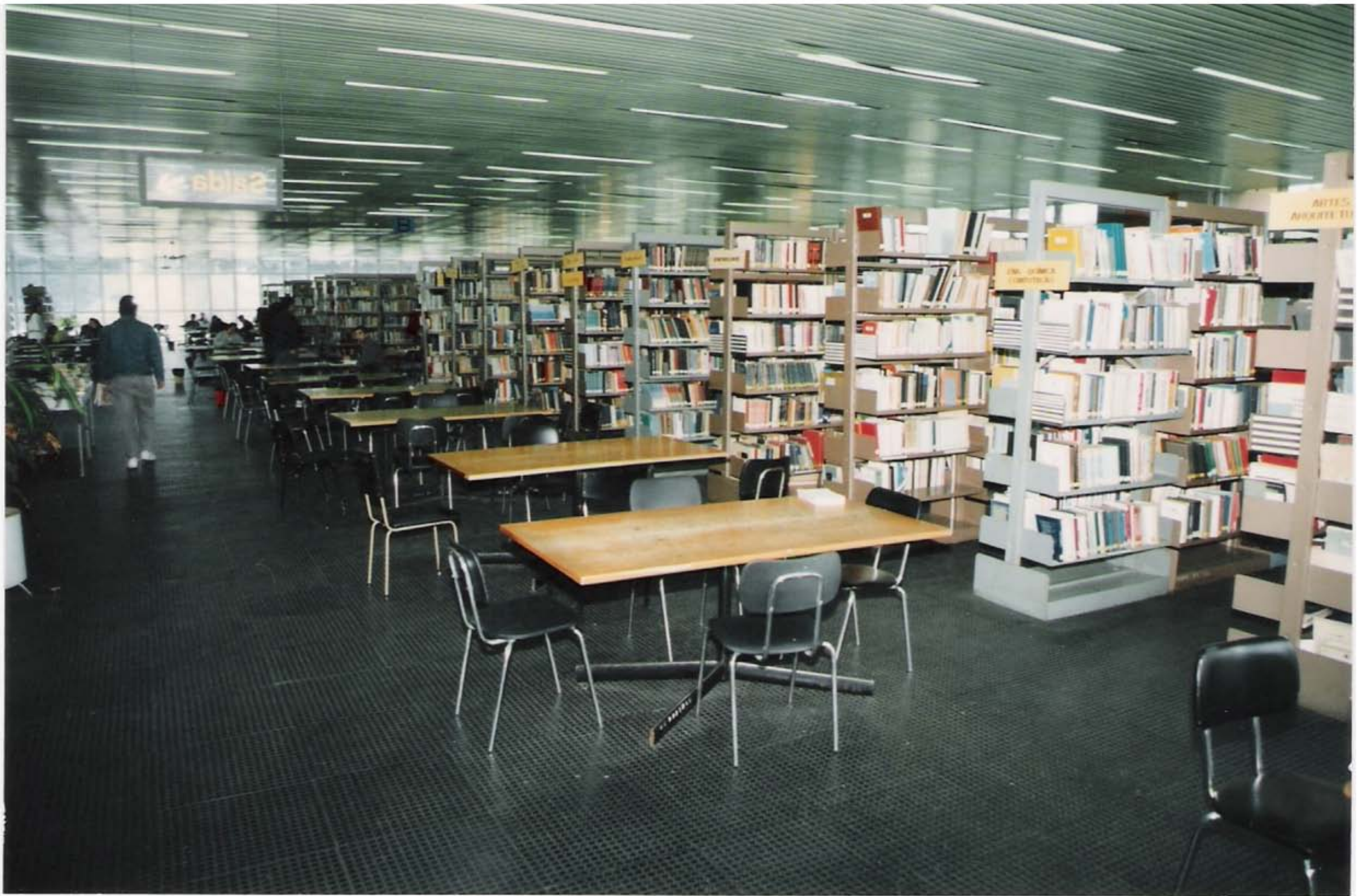
Biblioteca Central – Década de 90