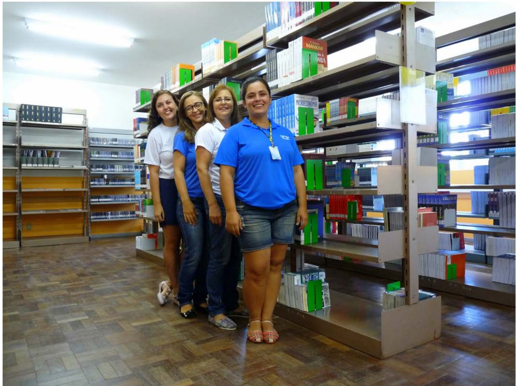
Biblioteca Setorial do Campus de Araranguá – Ano 2016