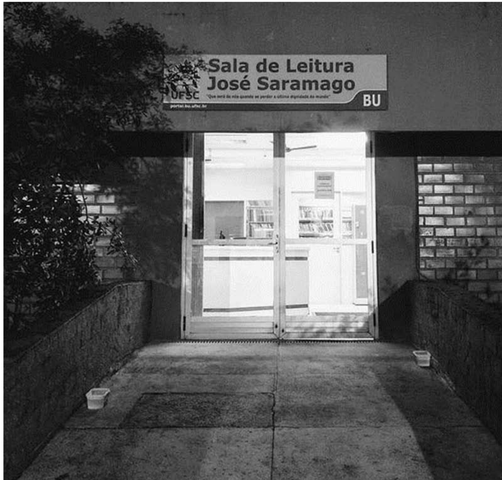
Sala de Leitura José Saramago – Ano 2018