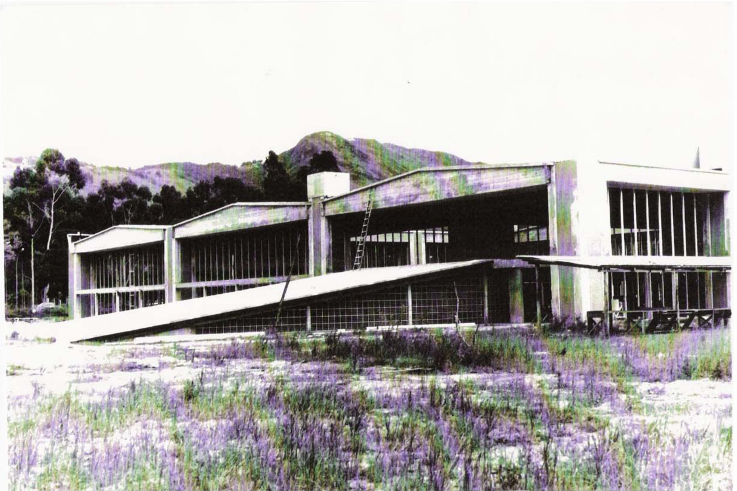
Construção da Biblioteca Central – Ano 1976