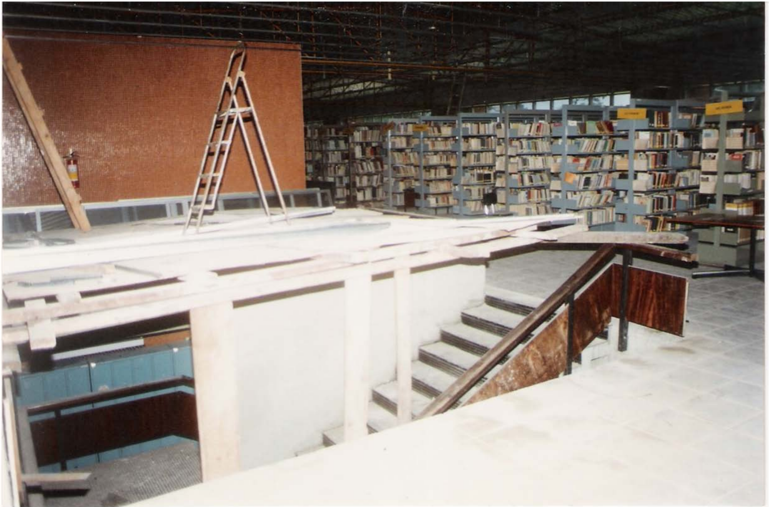
Reforma e Ampliação do Prédio da BC - Anos de 1995/1996