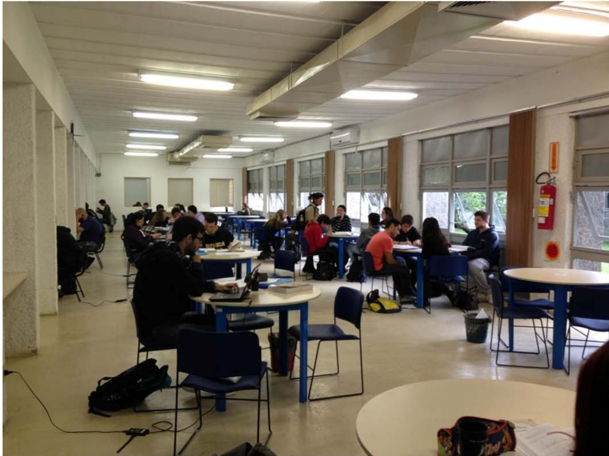
Biblioteca Setorial do Centro de Ciências Físicas e Matemáticas – Ano [20?]