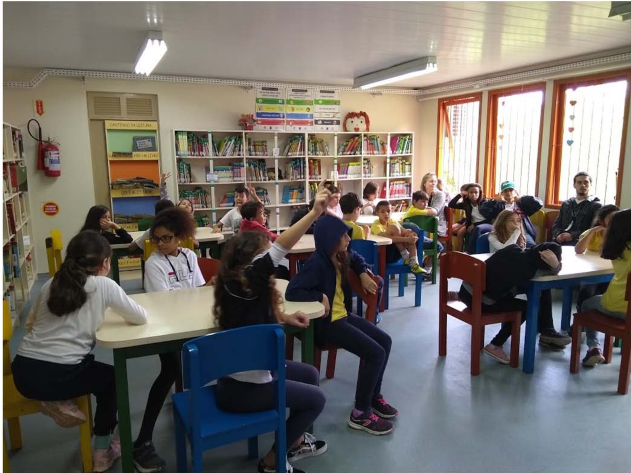
Roda de conversa com a bibliotecária na Biblioteca Setorial do Colégio Aplicação – Ano 2018