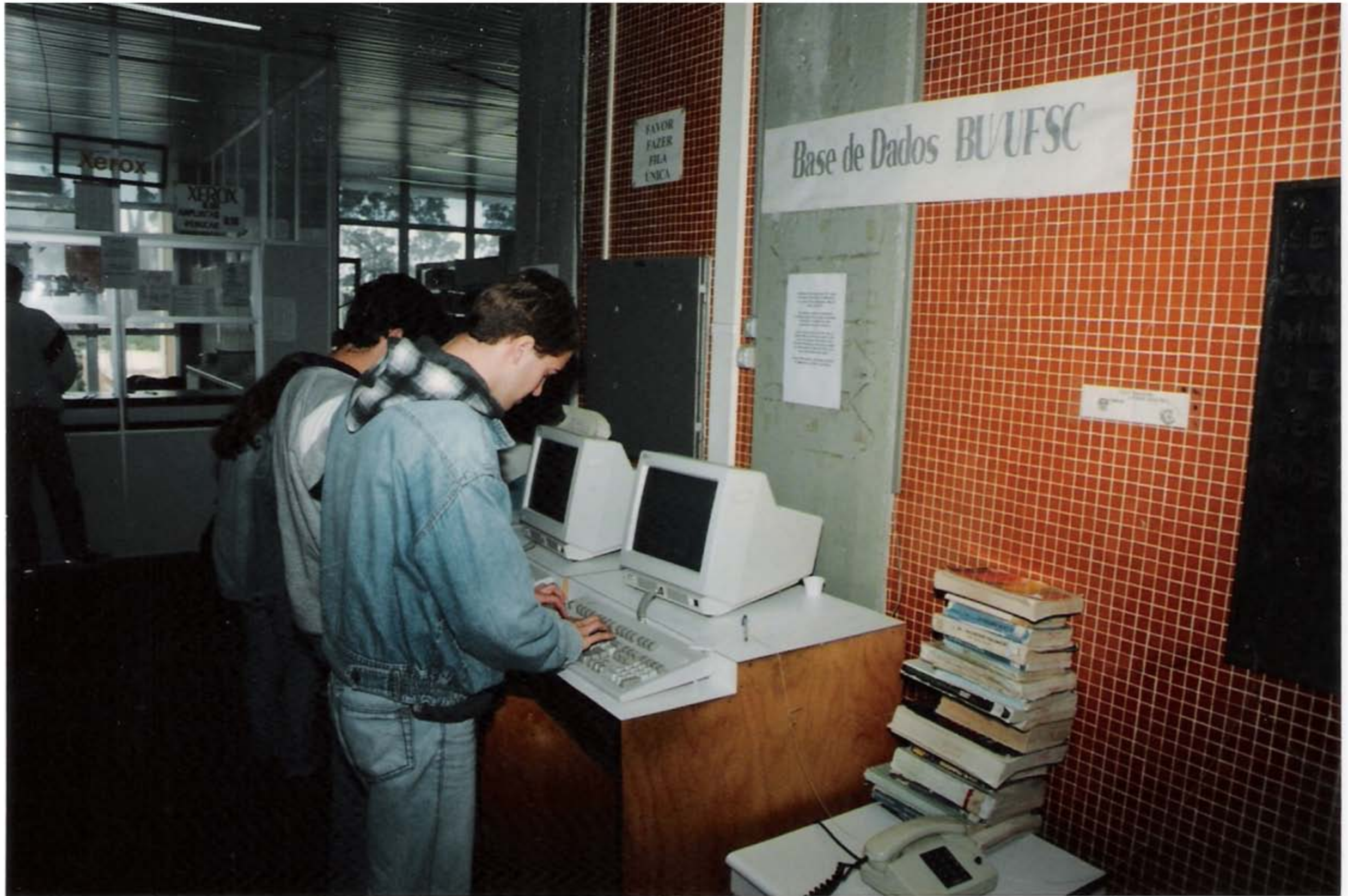
Biblioteca Central – Década de 90