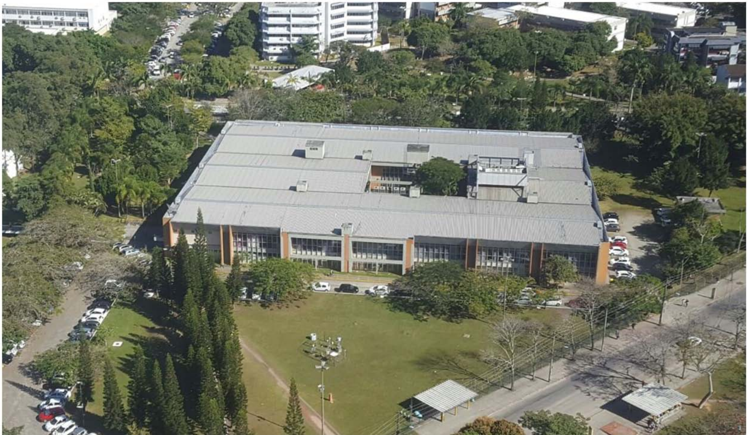
Biblioteca Central, imagem aérea – Ano 2000