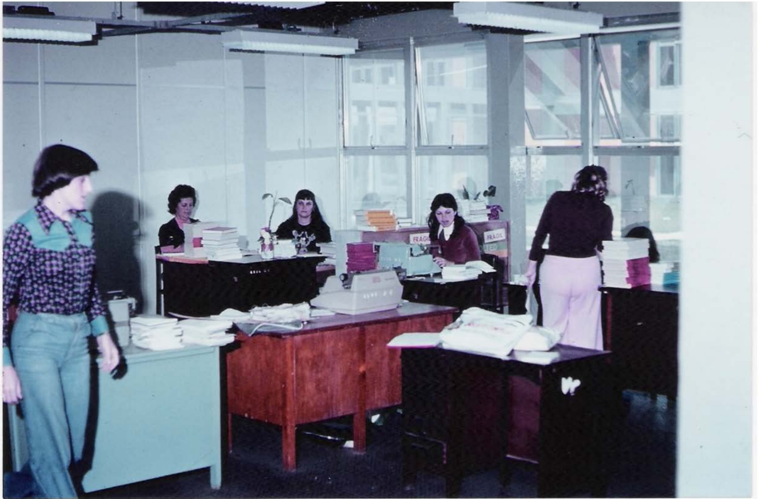
Biblioteca Central – Década de 70