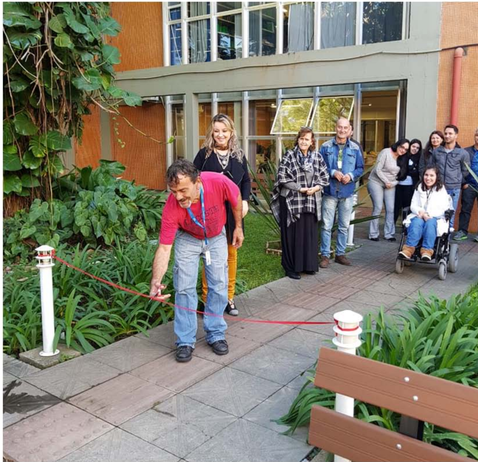
Biblioteca Central, revitalização do jardim interno – Ano 2018