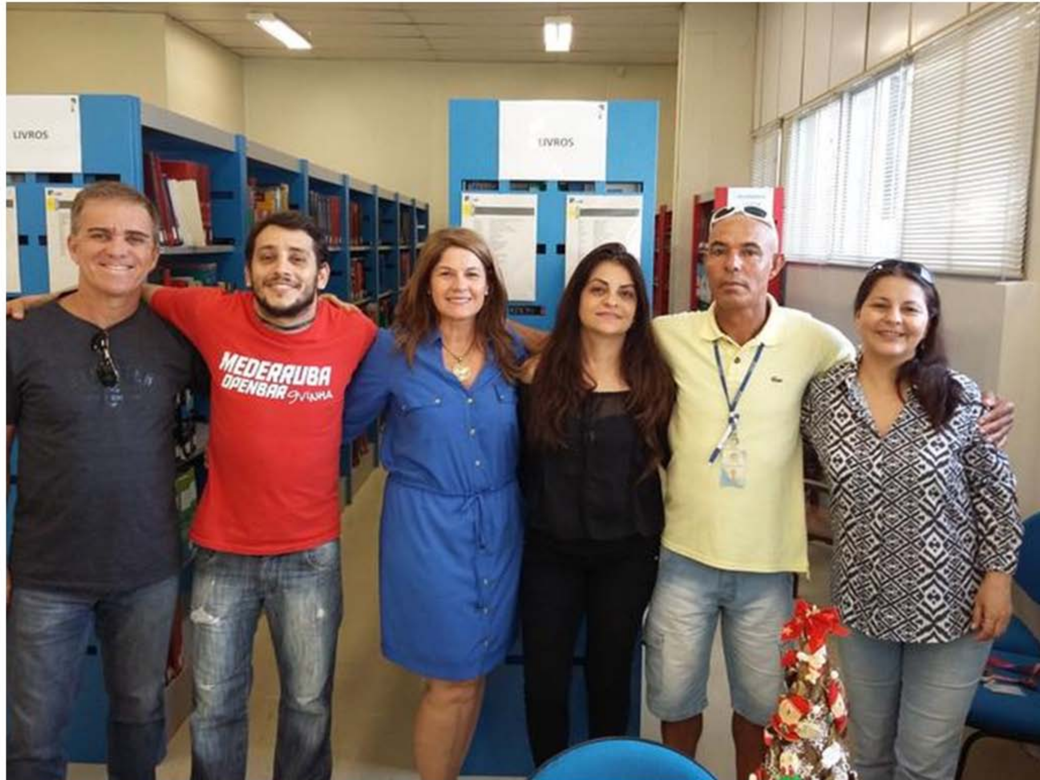
Biblioteca Setorial do Centro de Ciências da Saúde – Medicina – Ano 2016