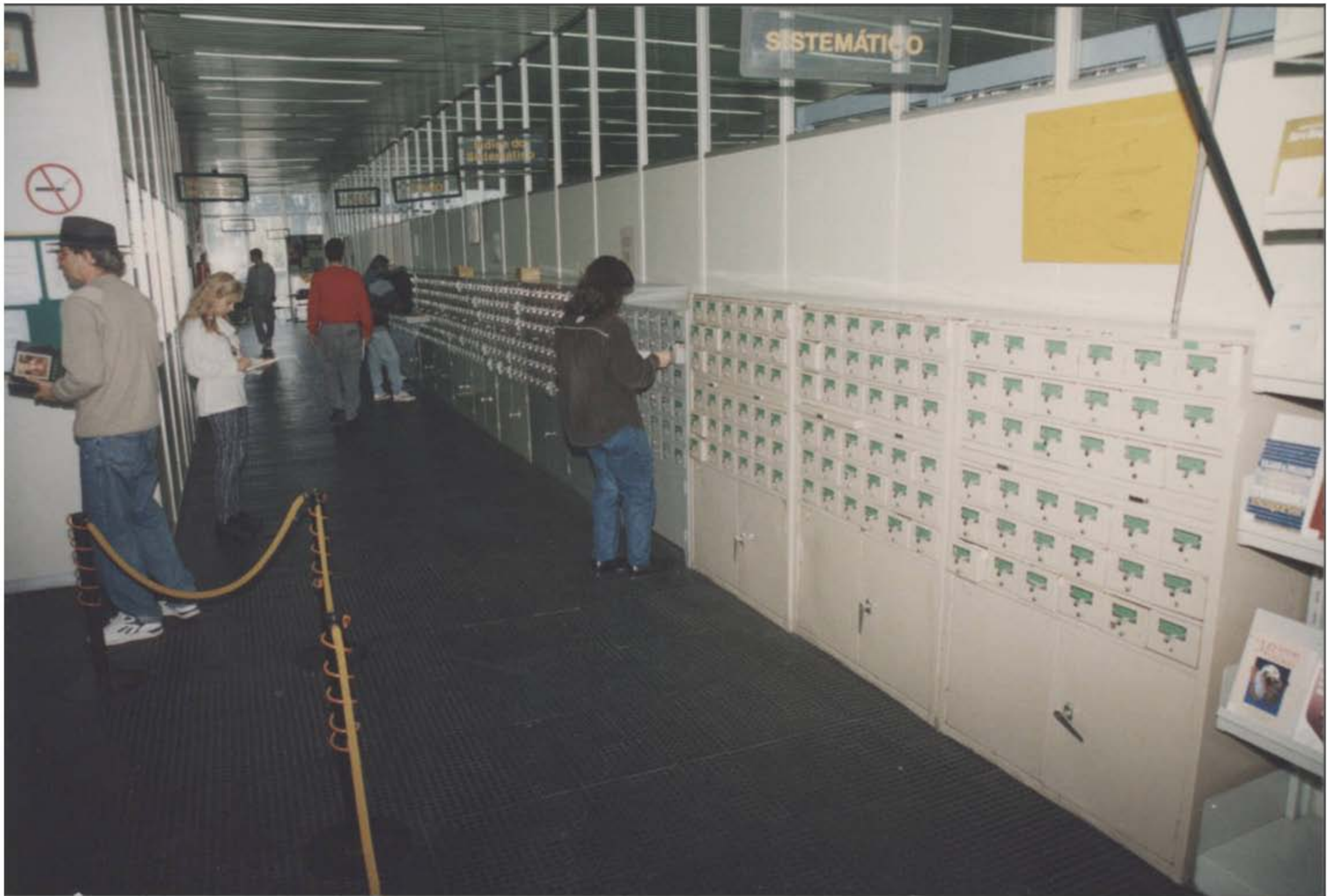
Biblioteca Central – Década de 80