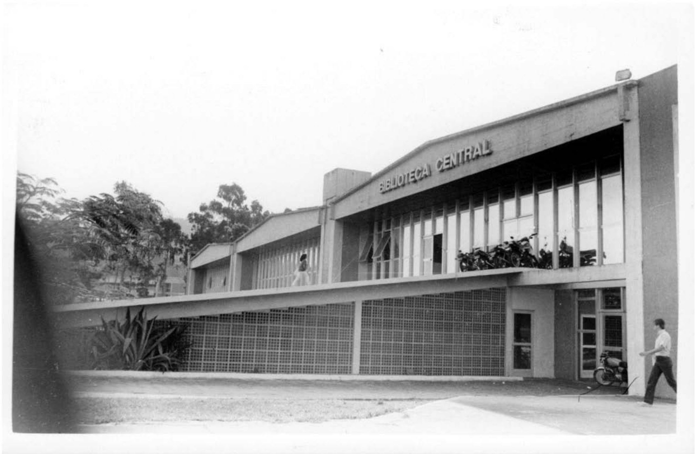
Biblioteca Central – Década de 70