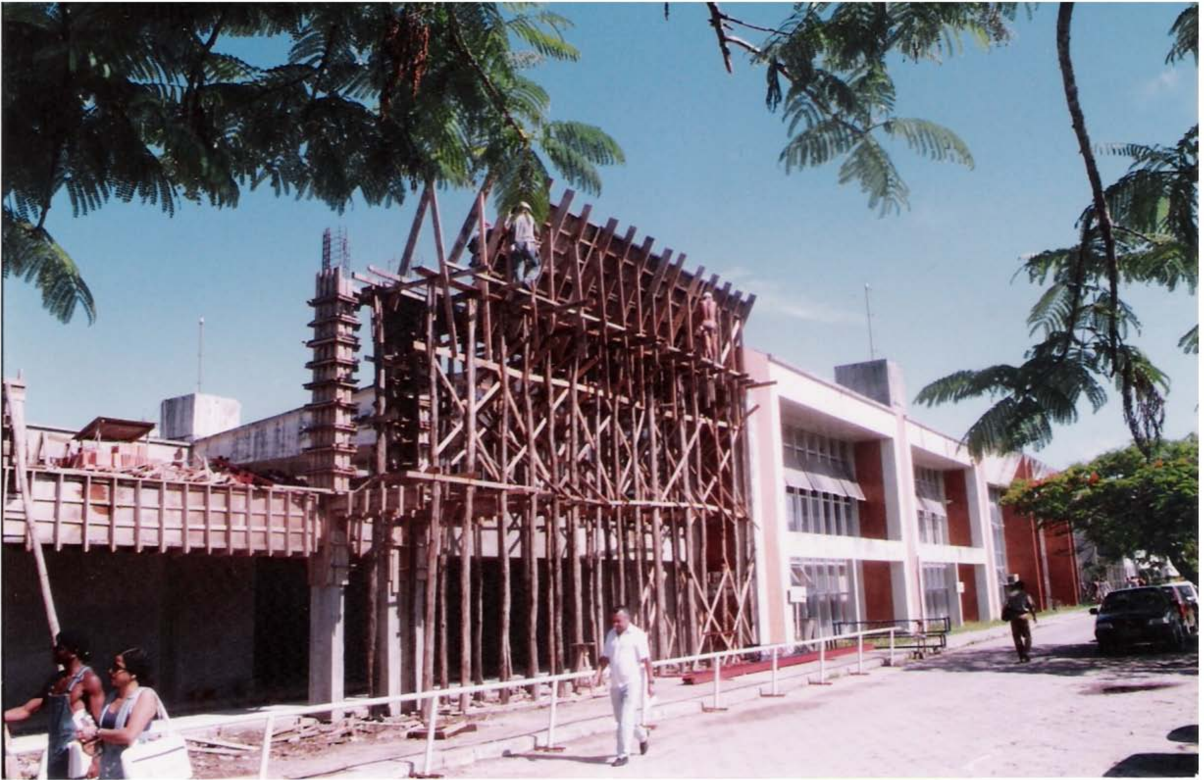
Reforma e Ampliação do Prédio da BC - Anos de 1995/1996