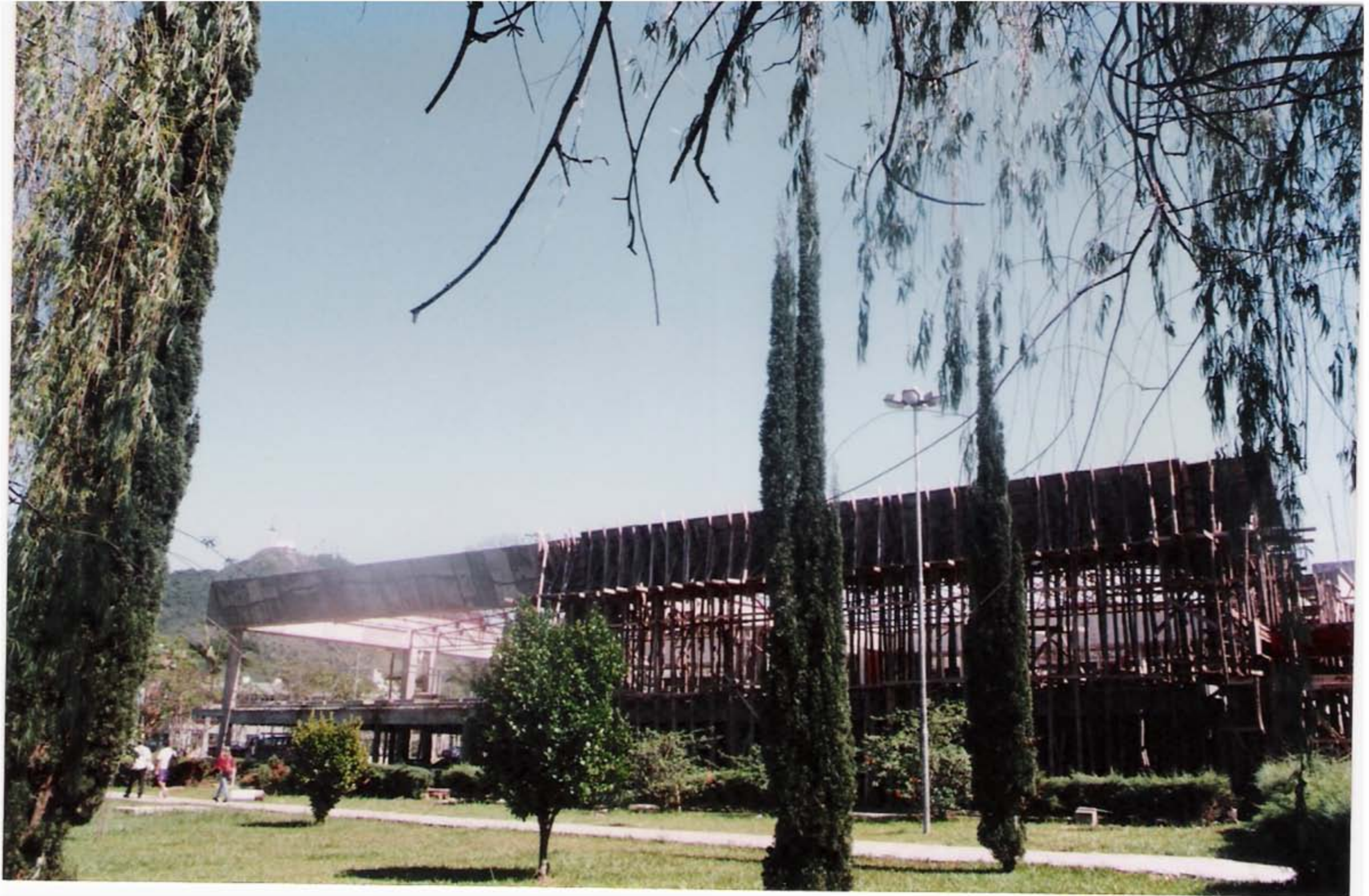
Reforma e Ampliação do Prédio da BC - Anos de 1995/1996