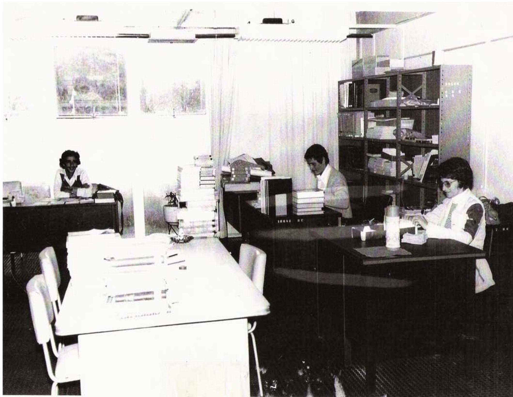
Biblioteca Central – Década de 70