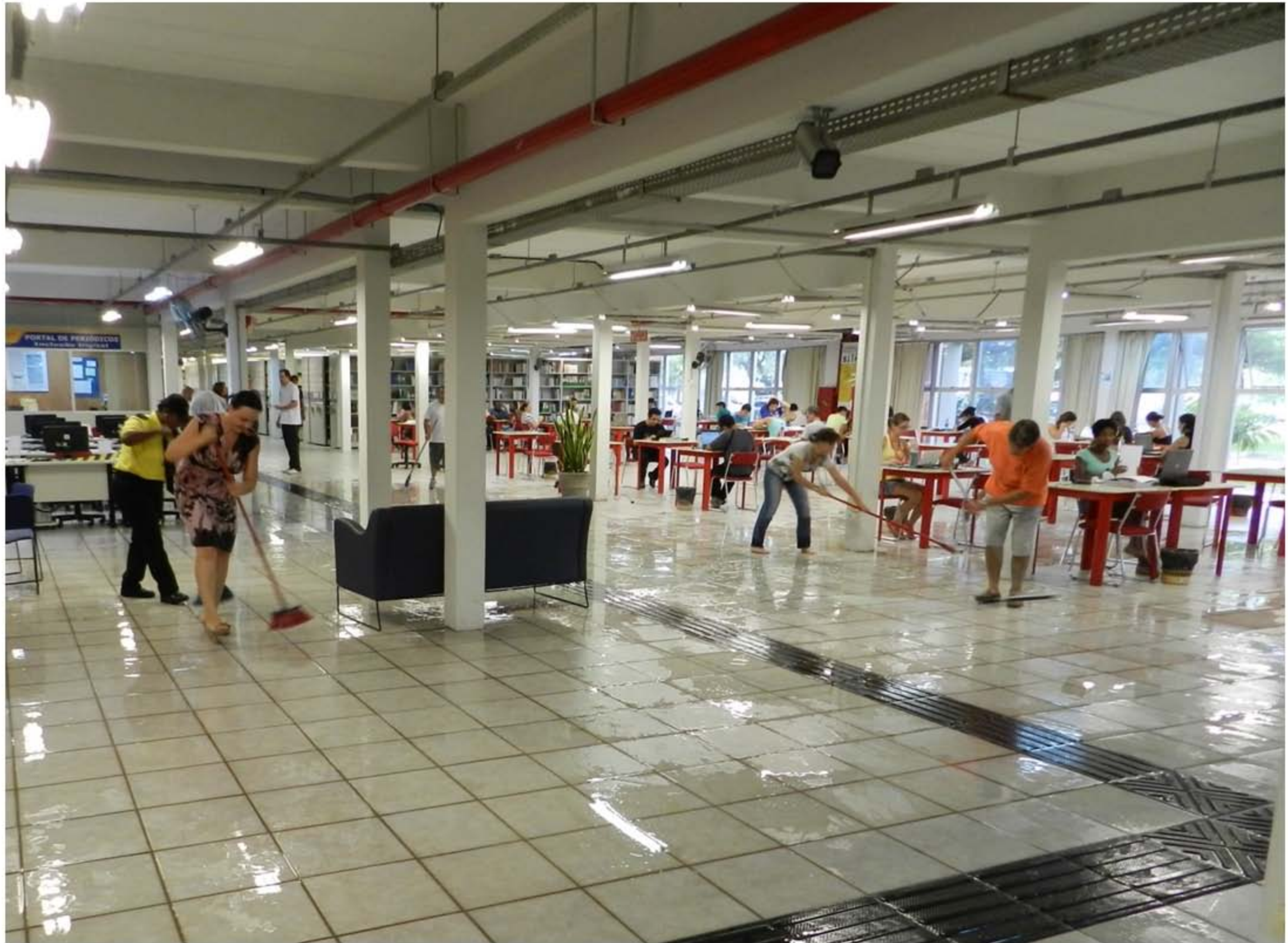
Inundação na Biblioteca Central - Ano 2012