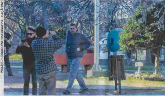
São Joaquim, na Serra catarinense, marcou -5°C ontem

Na Capital, segundo o Clima-terra, a temperatura hoje pode ficar entre 2°C e 5°C no interior da Ilha e 5°C a 8°C na maior parte da cidade, com possibilidade de geada bem isolada na Ilha, principalmente entre a UFSC e o Itacorubi. O fenômeno também pode ocorrer de forma isolada em alguns pontos do litoral, com mínimas entre 1°C e 5°C na maior parte da região e entre 6°C a 8°C à beira-mar. Também