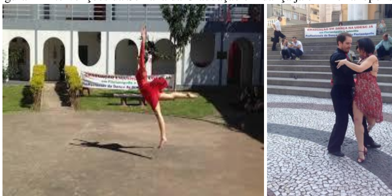
Figura 2- Intervenções da Semana da Graduação em dança já em Florianópolis