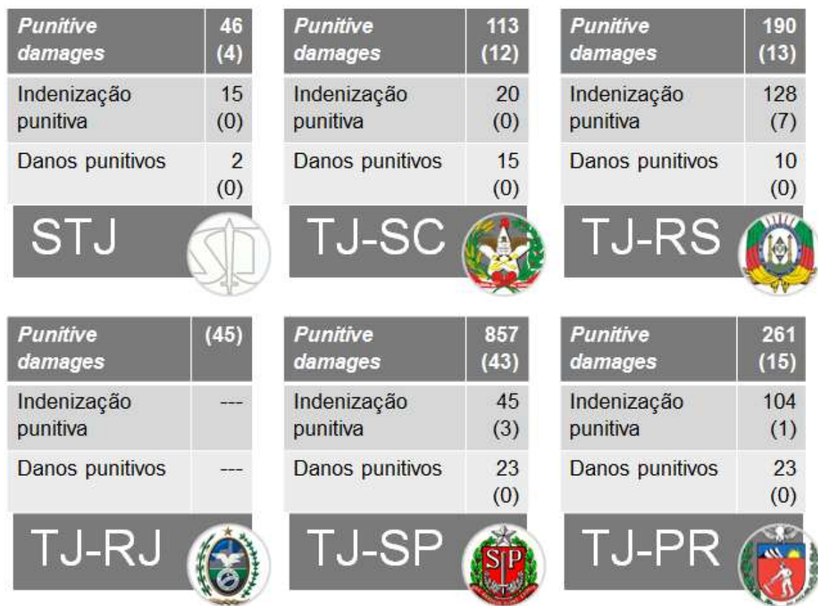
Figura 1. Consulta jurisprudencial por tribunal.

Para fins estatísticos, portanto, segue uma imagem tabelando tais valores nos tribunais que se determinou a análise. Os valores simples registrados a direita de cada termo correspondem às ocorrências em pesquisas realizadas no inteiro teor dos acórdãos; abaixo desses, entre parênteses, estarão os valores que representam a quantidade das ocorrências nas consultas pelo termo somente em ementas: