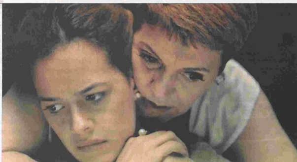
"Açúcar", de Renata Pinheiro e Sérgio Oliveira, abre o festival hoje, às 21h