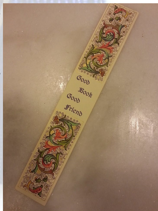
Primeiro marcador da coleção. Procedência: Firenze, Itália. Acervo Jorge Prado.

Demonstra um pouco de cada país visitado, das possibilidades humanas em criar um objeto tão simples, mas com tanto significado.