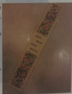
Primeiro marcador da coleção. Procedência: Firenze, Itália. Acervo Jorge Prado.

Demonstra um pouco de cada país visitado, das possibilidades humanas em criar um objeto tão simples, mas com tanto significado.