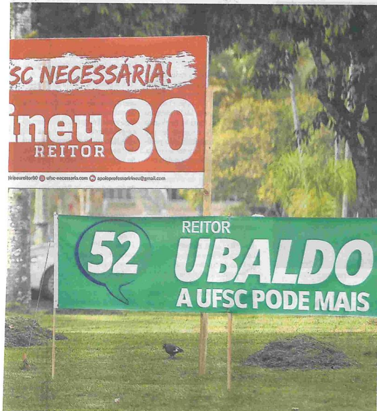
No campus da Trindade, em Florianópolis, a campanha é intensa para a consulta popular que ocorre hoje