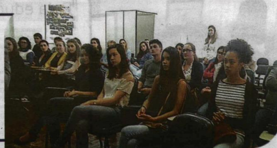
Os estagiários podem participar de cursos como forma de aprimorar conhecimentos

o aperfeiçoamento em diferentes áreas como Administração, Ciências Contábeis, Enfermagem, Nutrição, Psicologia, Direito e Conhecimentos Gerais. As inscrições para os cursos podem ser feitas pelo site: http://ead2.sc.gov.br . De 15 a 22 de janeiro de 2018.