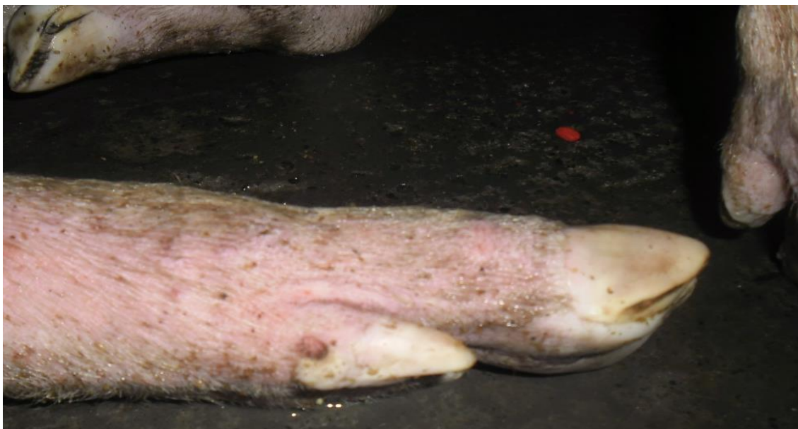
Figura 2: Suíno, vesícula na borda coronária do casco (SIF 160/2017).