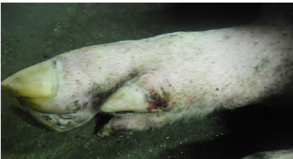
Figura 3: Suíno, úlcera na borda coronária do casco (SIF 160/2017).

No mesmo dia houve a comunicação a equipe técnica da Companhia Integrada de Desenvolvimento Agrícola de Santa Catarina- CIDASC, em que foi averiguada a notificação de Doença Vesicular, sendo realizada coleta do material (Figura 4), preenchimento de formulários e emissão de Termo de Atividade Sanitária, que determinava a interdição do estabelecimento para a entrada de animais, saída de