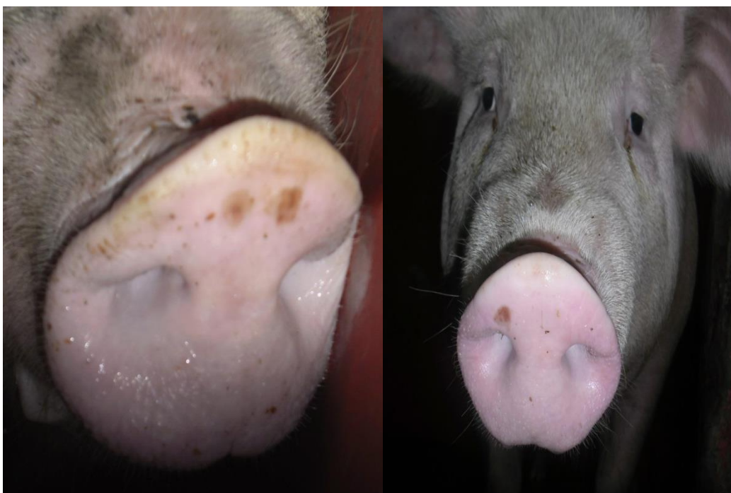
Figura 1: Suínos com vesículas no focinho, posição rostral. (SIF 160/2015)

Durante o exame o MVO constatou a presença de vesículas/úlceras no focinho (Figura 1) e nas patas dos animais (Figura 2 e Figura 3), analisando os demais animais assintomáticos dos lotes, foram detectadas mais vesículas, e a ação tomada foi à interrupção do abate e sequestro dos lotes envolvidos. Na manhã do dia 16 devido ao fluxo contínuo e ininterrupto de chegada de animais para o abate verificou-se a presença de mais dois lotes de suínos com as lesões, em que o mesmo procedimento de sequestro dos lotes foi efetuado.