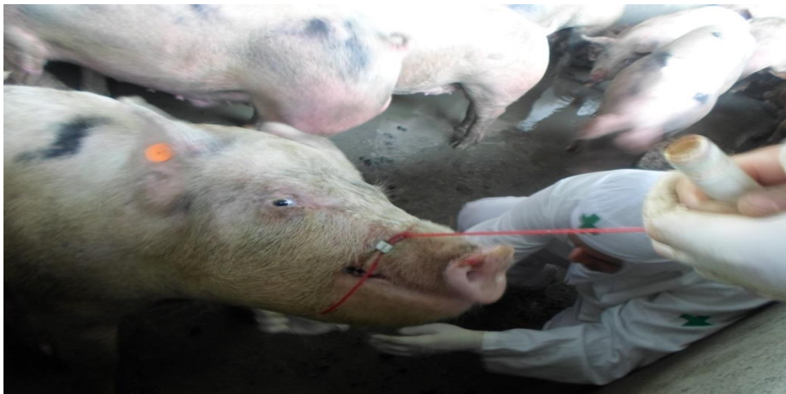
Figura 4: Equipe técnica da Companhia Integrada de Desenvolvimento Agrícola de Santa Catarina- CIDASC, fazendo coleta do material para análise (SIF 160/2015).

produtos e subprodutos e a possibilidade de abate dos animais sequestrados, sendo mantidos vivos e isolados os quatro animais que foram objeto de amostras.