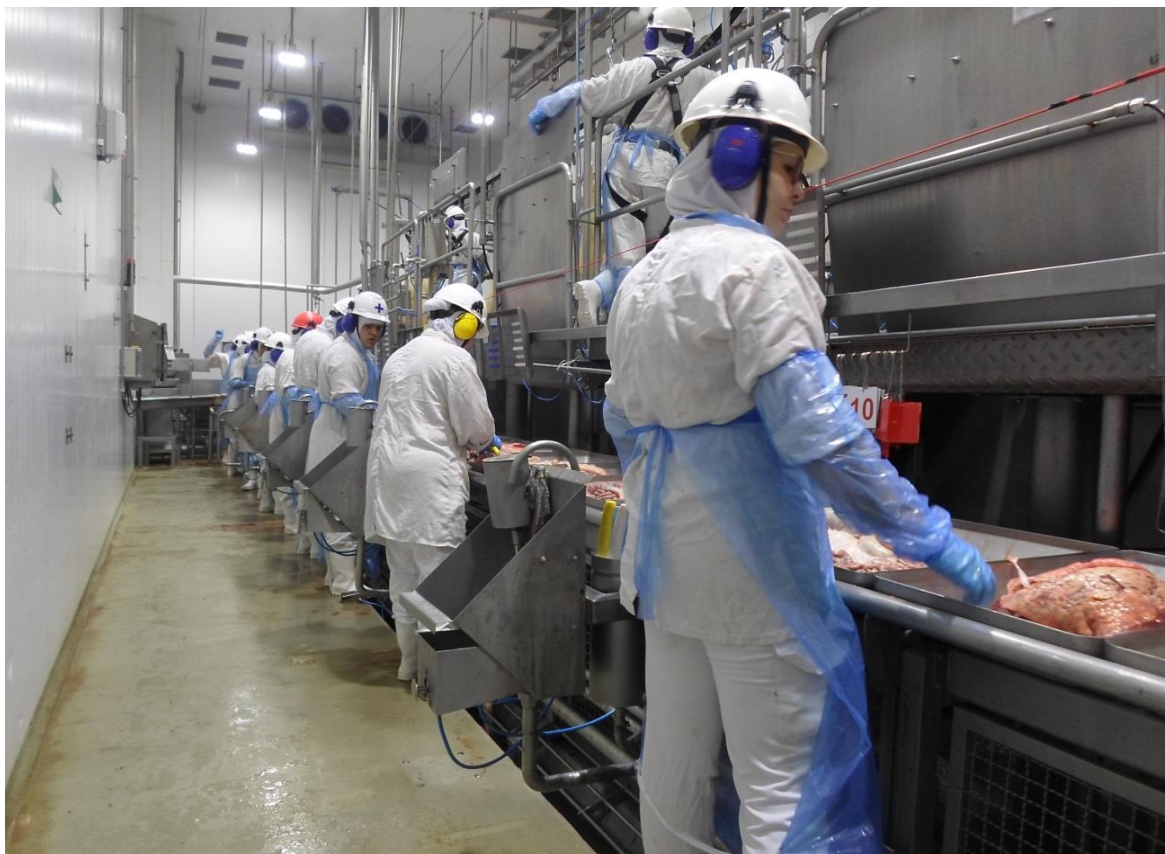
Figura 8: Funcionários da Inspeção Federal na mesa de inspeção de vísceras (SIF 160/2017).

Obedecendo a ordem do fluxograma da Portaria 711, é realizado a inspeção da Linha B (intestino, estômago, baço, pâncreas e bexiga) em que cortam-se os nodos linfáticos da cadeia do mesentério, realizam a palpação e a avaliação de odores dos órgãos. Por seguinte, é realizada a inspeção da Linha C (língua e coração) em que secciona-se o coração e a língua, principalmente para pesquisa de cisticercose ou alguma inflamação.