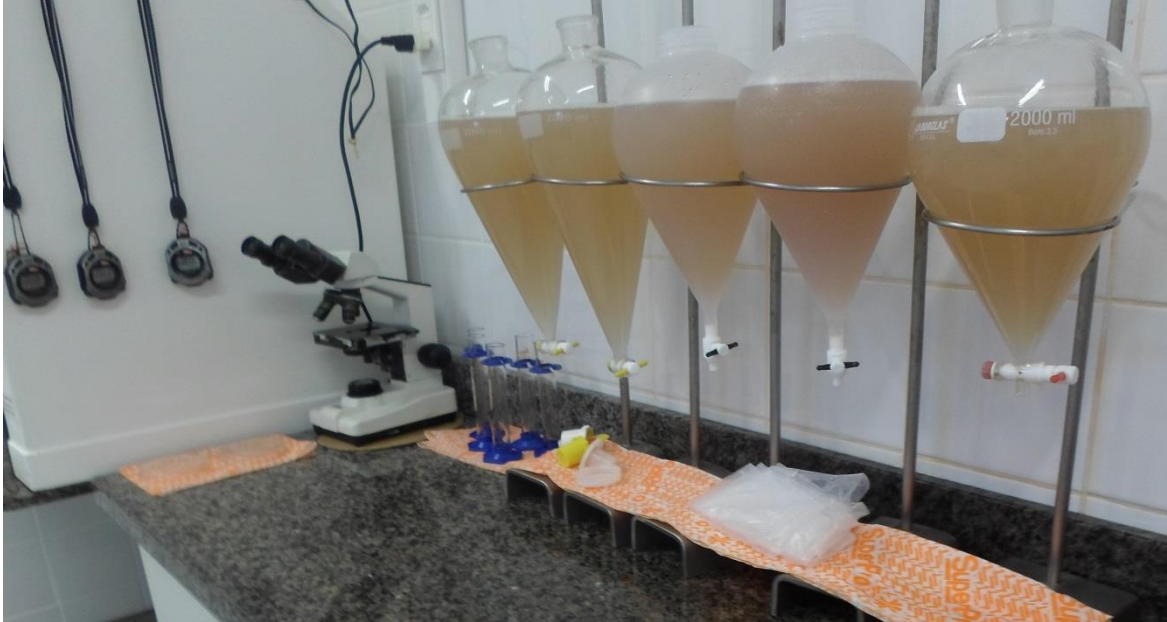
Figura 10: Ampola de Separação, para posterior análise de Trichinella spirallis (SIF 160/2017).

ocorresse a sedimentação por 30 minutos (Figura 10). Sob nova sedimentação por 10 minutos em proveta, o sedimento era recolhido e observado em placas de vidro ao estereomicroscópio, com aumento de 40 vezes.