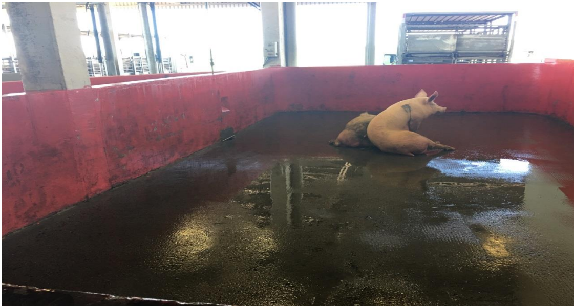
Figura 3: Pocilgas de Sequestro, destinadas à observação dos animais (SIF 160/2017).

O médico veterinário oficial faz a avaliação dos animais e verificação de mucosas, fezes, pelo, aumento de volume, secreções, capacidade de locomoção, estímulos dolorosos, temperatura (36°C a 40,9°C recomendado). Os animais classificados para o abate de emergência mediata que por exemplo, apresentam-se cansados, com hérnias, serão encaminhados para o abate no final do turno de abate, e os animais classificados com abate de emergência imediata com fraturas expostas, em sofrimento, por exemplo, serão destinados ao abate imediatamente e desviados para o DIF (Figura 3).