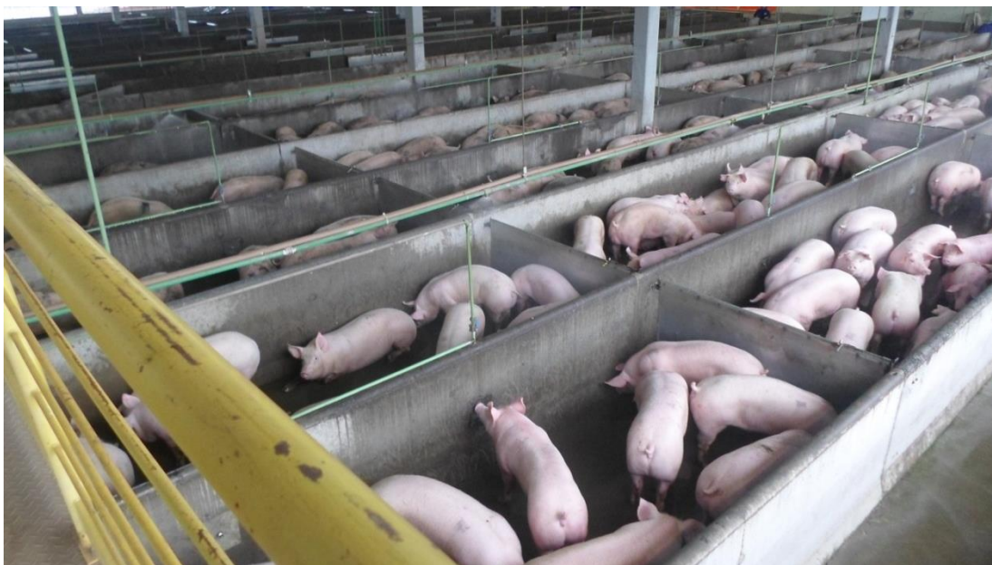
Figura 2: Pocilgas de Matança (SIF 160/2017).

As pocilgas de matança são de aproximadamente 8 metros x 2 metros, com densidade de 0,6 m 2 /100kg de animal vivo, em um total de 126 pocilgas. As pocilgas são de alvenaria e todas apresentam bebedouros tipo chupeta, elas são higienizadas a cada saída de lote, e nos finais de semana recebem higienização (Figura 2).