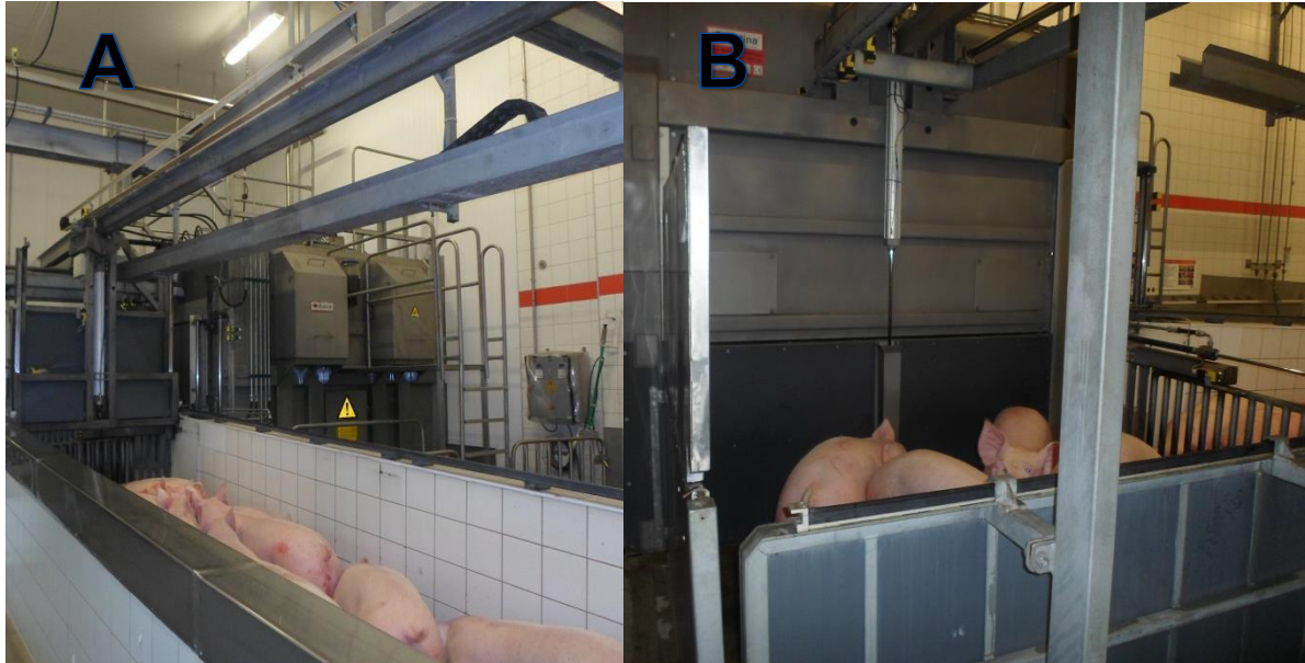
Figura 5: A: Sistema de insensibilização por CO 2 / B: Animais conduzidos para dentro do sistema de insensibilização por CO 2 (SIF 160/2017).

Após o período no chuveiro os animais são conduzidos a maquina que realiza a insensibilização por gás carbônico (CO 2 ) (Figura 5).