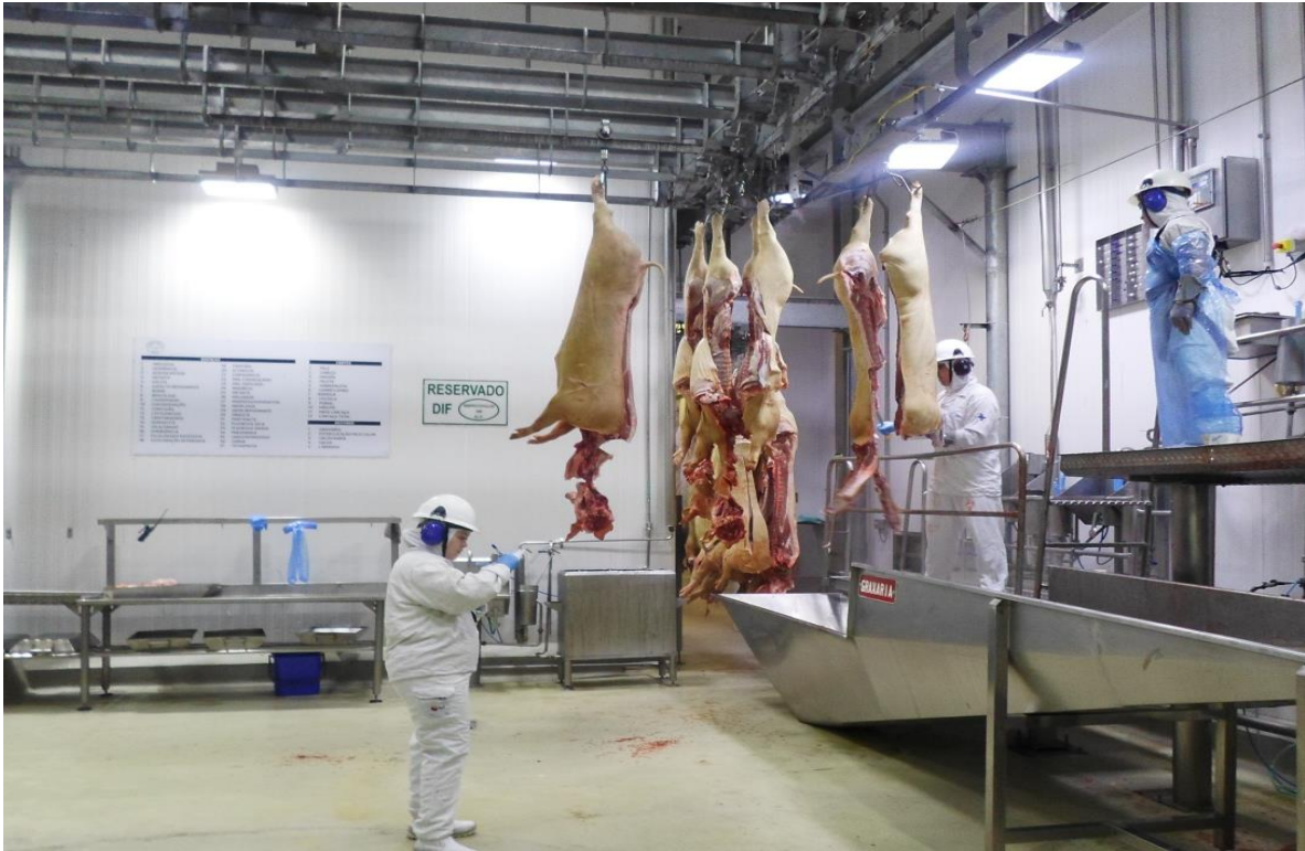
Figura 11: Departamento de Inspeção Final – DIF (SIF 160/2017).