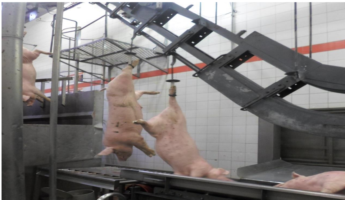
Figura 6: Animais após a insensibilização, seguindo para a sangria na vertical (SIF 160/2017).