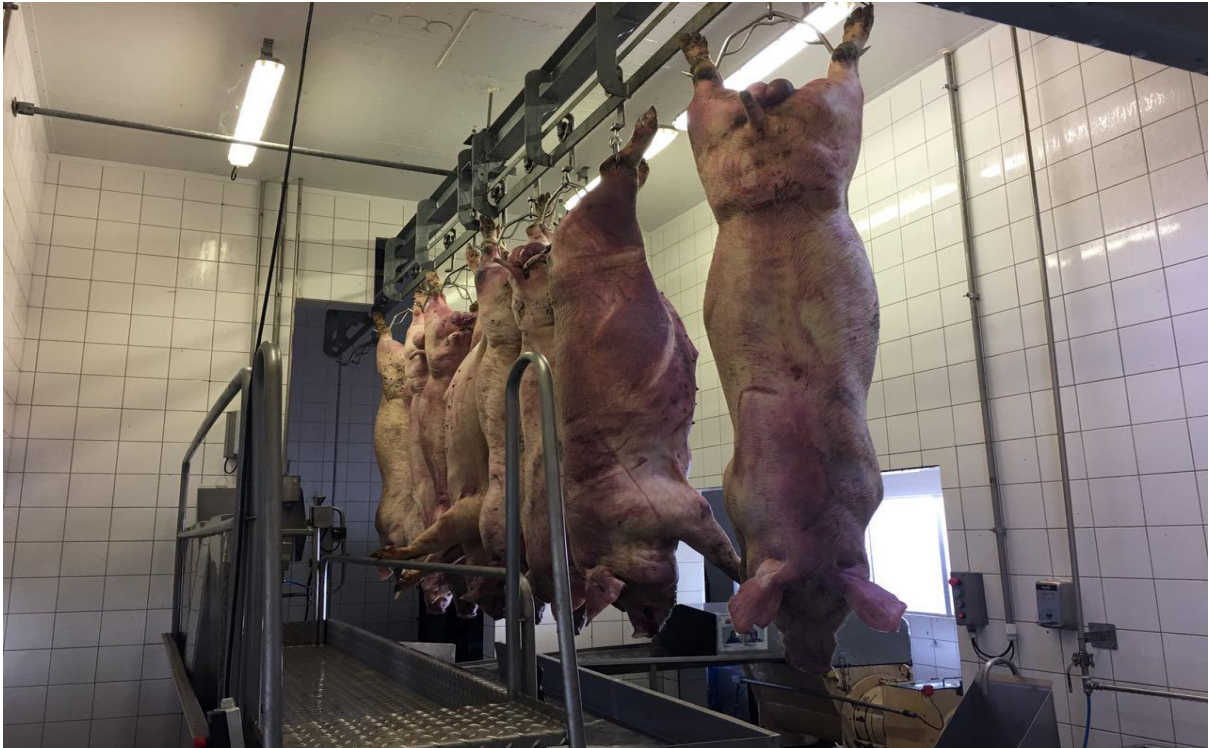
Figura 4: Sala de Necropsia (SIF 160/2017).