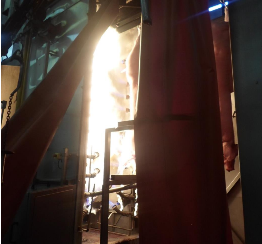
Figura 7: Processo de Chamuscagem (SIF 160/2017).

Após este procedimento, os animais passam novamente por um chuveiro e seguem para o final do toalete da zona suja do pernil, barriga e papada. Nesta etapa são retiradas as cerdas restantes, além da retirada do ouvido médio, que é considerado um contaminante, por meio de um “trimmer”, e a retirada da pálpebra.