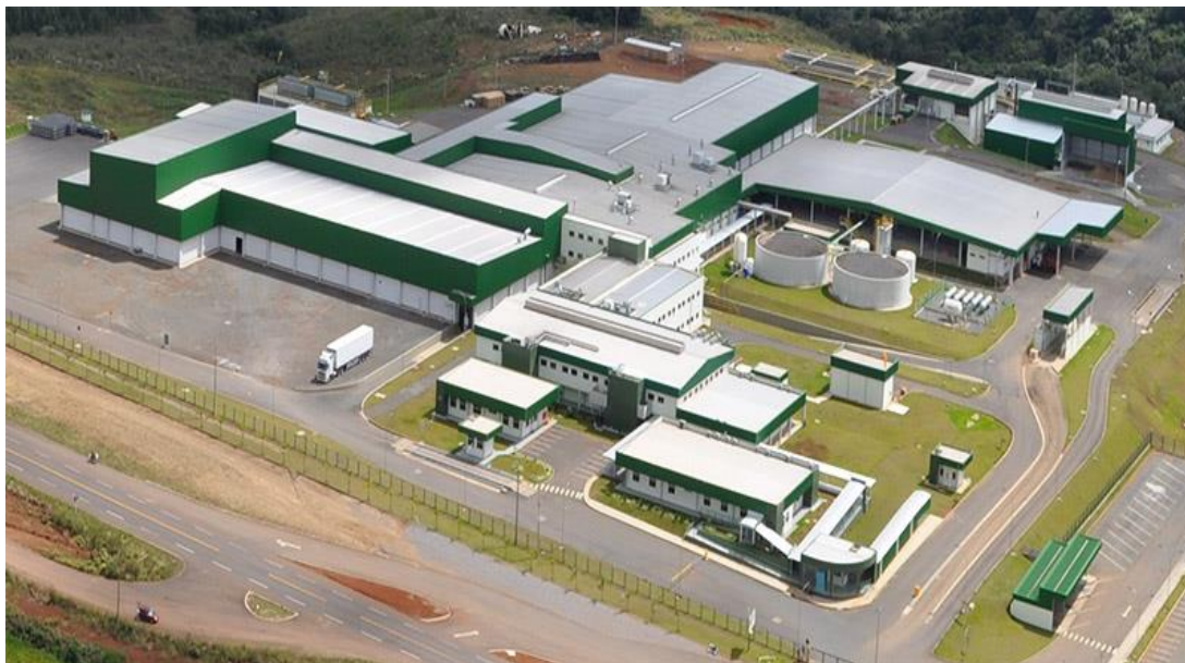
Figura 1: BRF unidade de Campos Novos – SC.

O estágio foi desenvolvido na unidade da BRF – Brasil Foods de Campos Novos, Santa Catarina juntamente com a unidade do SIF-160 (Figura 1).