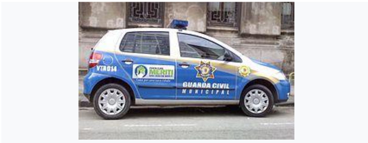
Figura 1: Veículo da Guarda Civil Municipal de São João de Meriti