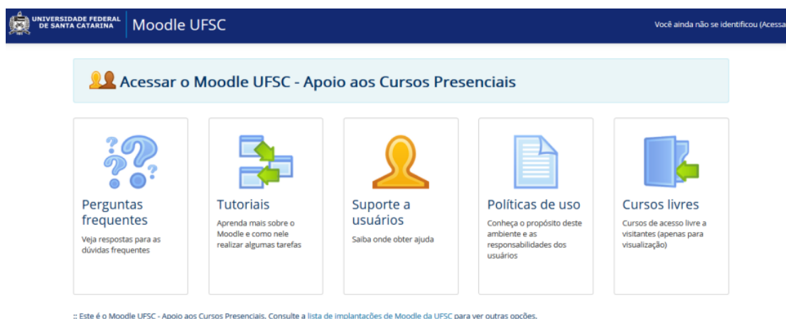
Figura 5: Tela acesso Moodle

O Modular Object Oriented Dynamic Learning Environment - Moodle , é o Ambiente Virtual de Aprendizagem utilizado pela Universidade Federal de Santa Catarina - UFSC. Segundo Saldanha (2011) há vários anos a UFSC o utiliza na Ead, e desde 2009 como ferramenta auxiliar no ensino presencial.