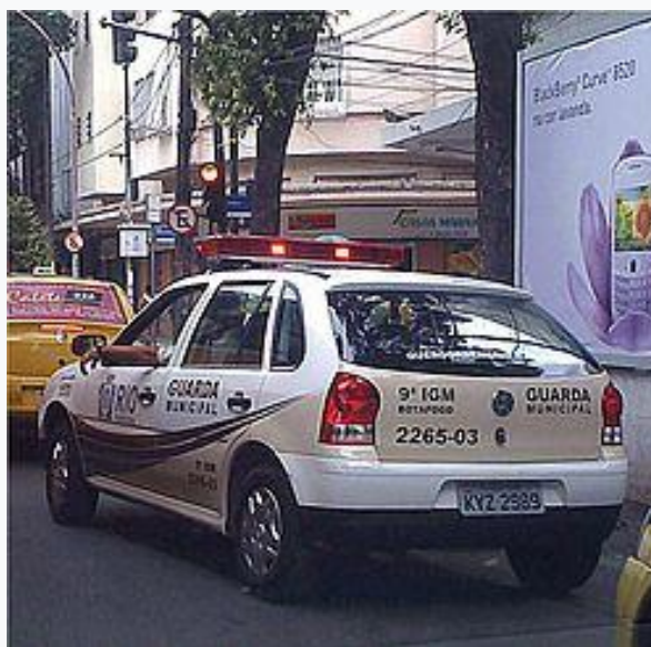
Figura 2: Viatura da GM - Rio