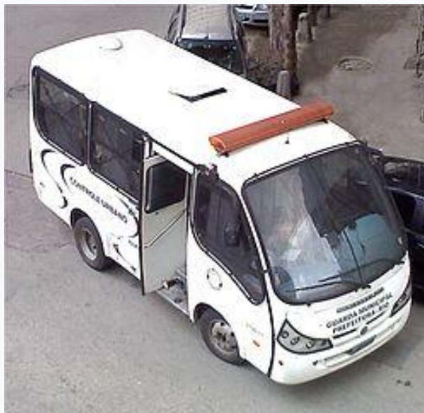
Figura 3: Veículo do Grupamento de Controle Urbano – Rio