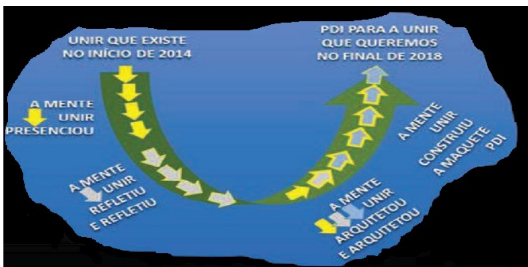
Figura 1 - Tecnologia Social para Soluções Sistêmicas – Teoria U