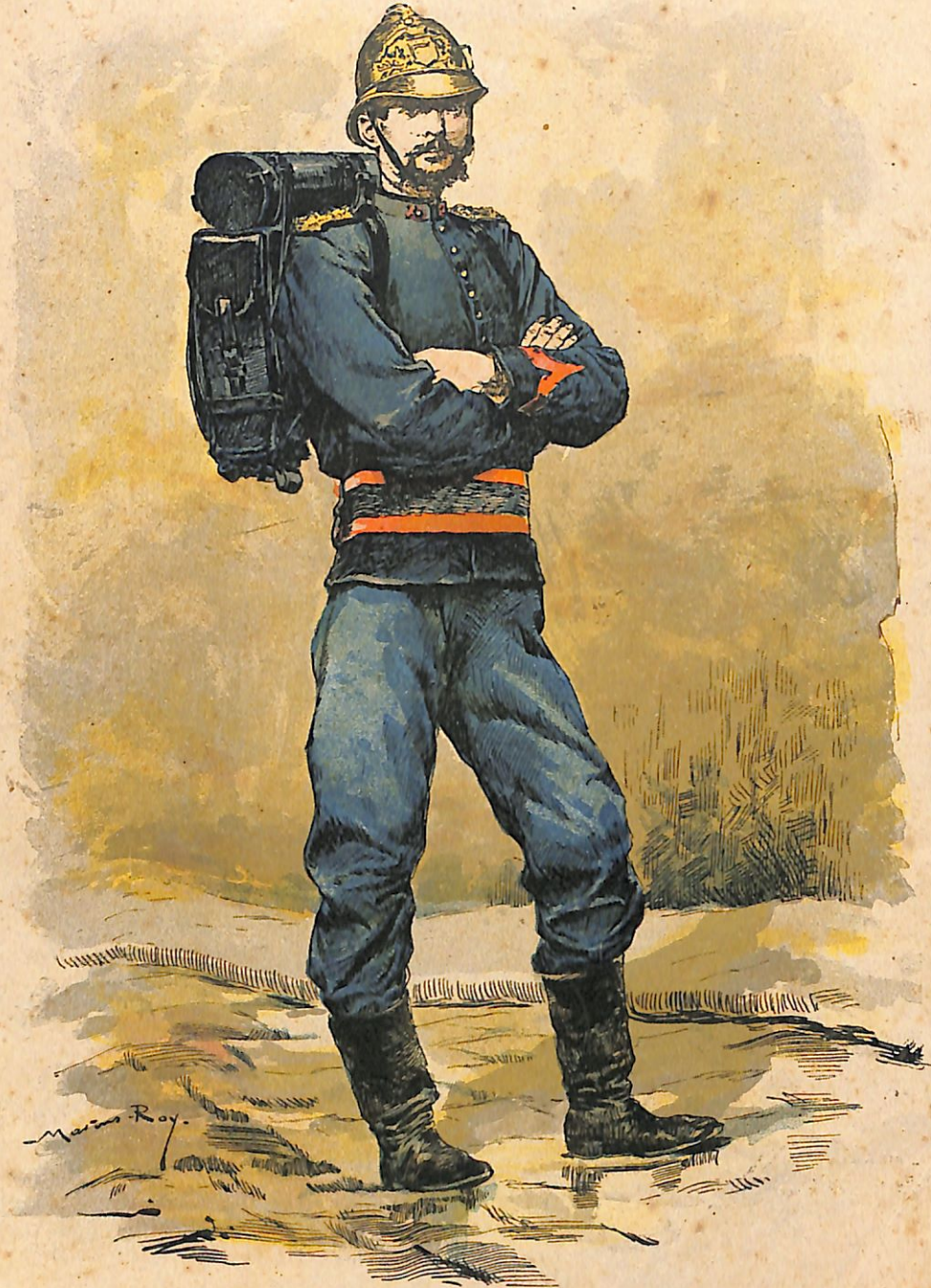
TENUE DE SERVICE