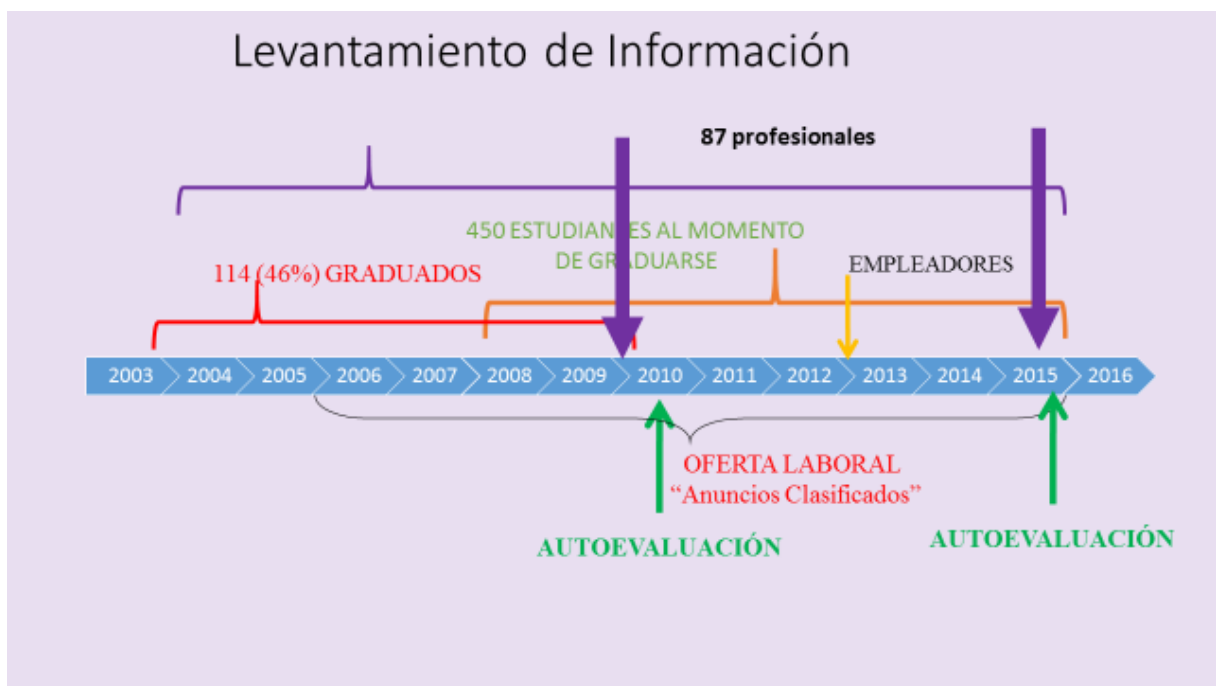
Figura 2. Esquema metodológico del Sistema de Seguimiento de Graduados que lleva adelante el DEV. Elaboración propia.

En este sentido el DEV incorporó varias herramientas más: una encuesta a los graduados al momento de titularse, una relevamiento de la oferta laboral para veterinarios, y repitió la encuesta a graduados durante los primeros años pos-título. Además, volvió a encuestar, cinco años después, a los graduados que fueron consultados en la primera instancia.