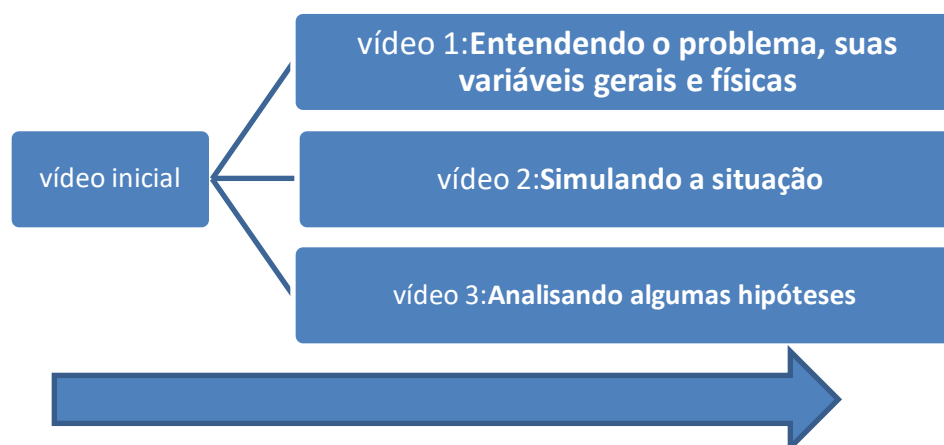
Figura 1 – Necessidade de reedição dos vídeos

Sendo assim foi realizada a reedição do vídeo, sendo dividido em três partes e a construção de novos roteiros.