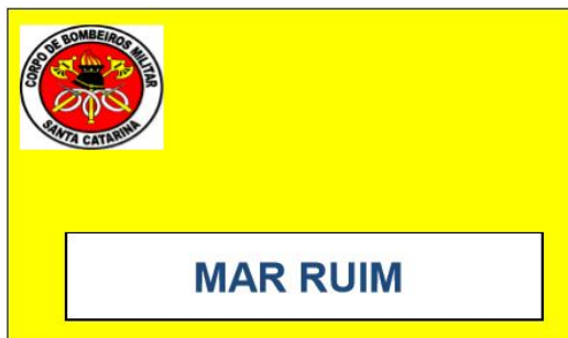
Figura 2 – Mar ruim, atenção, banho com restrições e com assistência de guarda-vidas