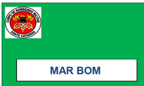
Figura 3 – Mar calmo, condições plenas de banho e com assistência de guarda-vidas