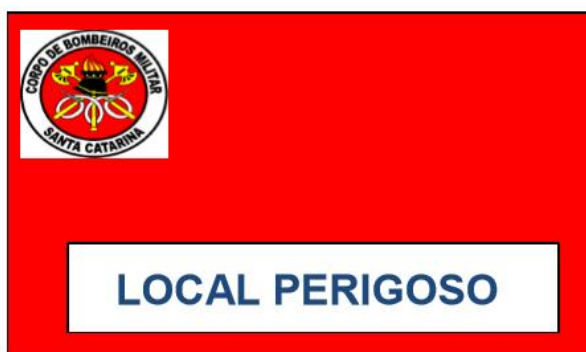
Figura 4 – Sinalização da praia, fixada em locais perigosos ao longo da praia