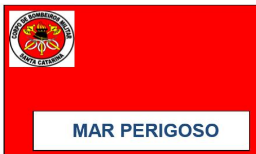
Figura 1 - Sinalização de mar perigoso, sem condições de banho, embora com assistência de guarda-vidas