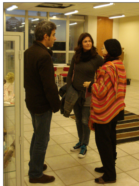
Mostra vem ao país em outubro de 2012