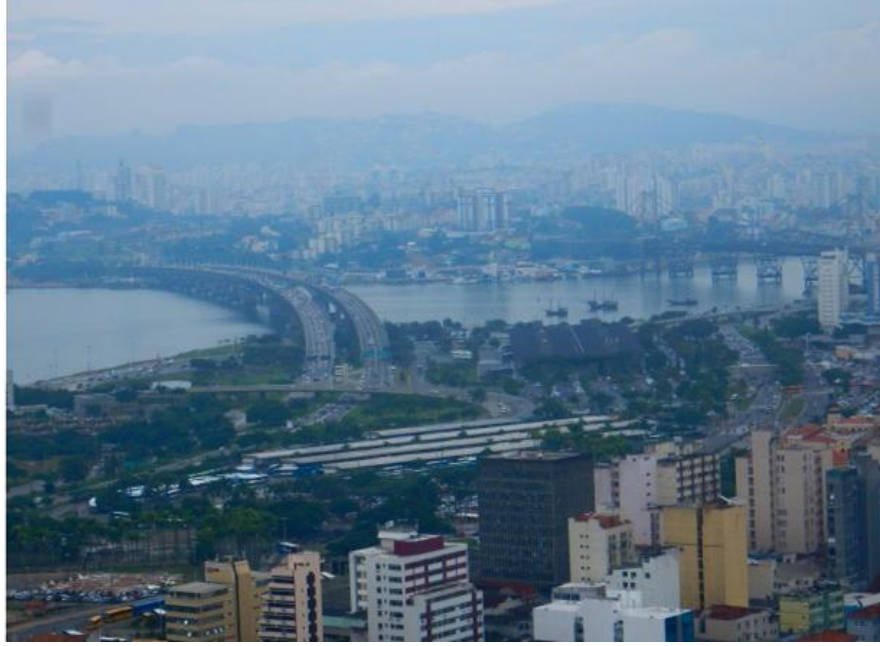
Figura 6. Imagem do mirante