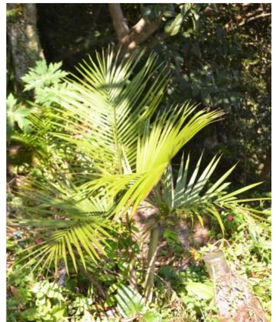
Figura 5: Jussara ( Euterpe edulis )