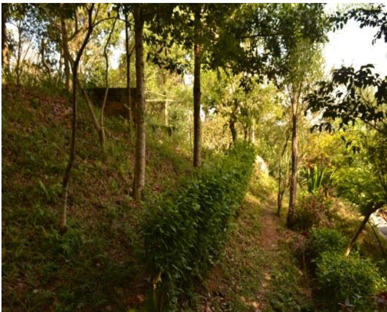
Figura 4: Alicerce de residência demolida e trilha principal.