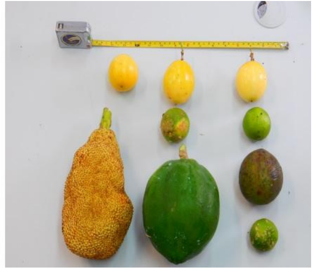
Figura 3: frutos coletados na agrofloresta.