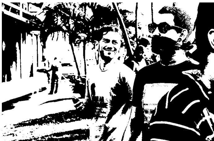
Fotografia 23: Parte externa do carro principal, IX Parada da Diversidade de Florianópolis, 2015.

Na fotografia abaixo, um assessor direto do Parlamentar, vestindo camiseta com dizeres sobre a Parada da Diversidade sorri, ao lado de representante do Movimento LGBT que utiliza a mordaça que emblematiza o protesto frente ao silenciamento.