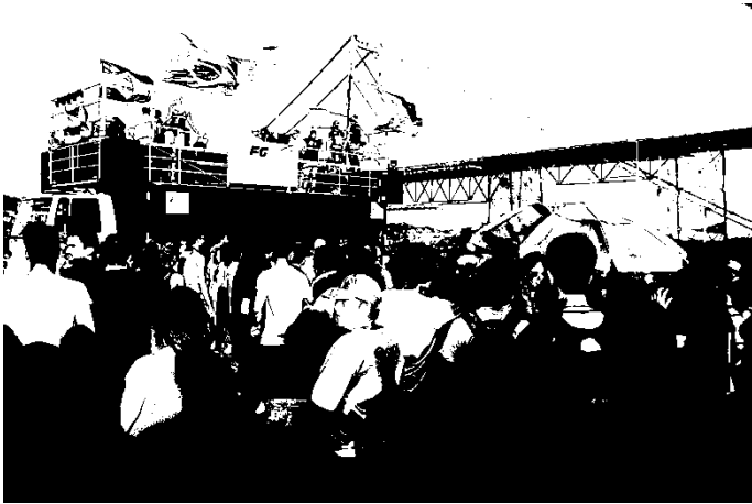
Fotografia 8: Carro de Som principal da X Parada da Diversidade de Florianópolis, 2016. Tamanho: 50 metros.