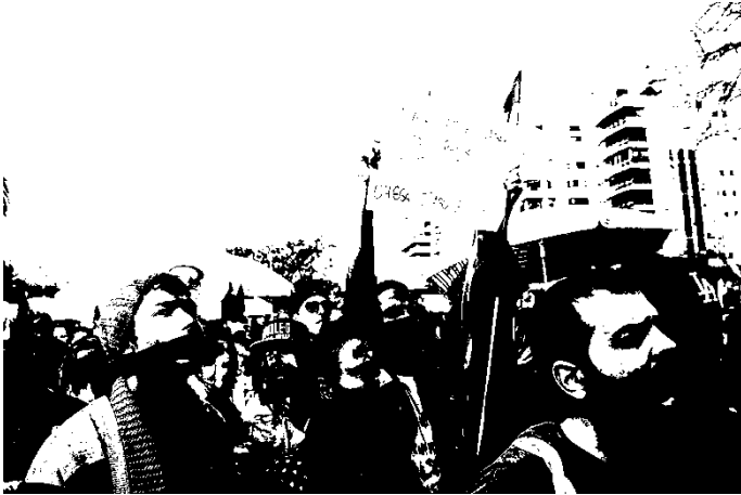
Fotografia 24: integrantes do Movimento LGBT durante a IX Parada da Diversidade de Florianópolis, 2015, em atitudes de protesto.

Além do uso das mordças, também o Movimento LGBT estava preparado com cartazes que apresentavam o sentido produzido pelos atos do referido parlamentar sobre o silenciamento: o uso eleitoral.