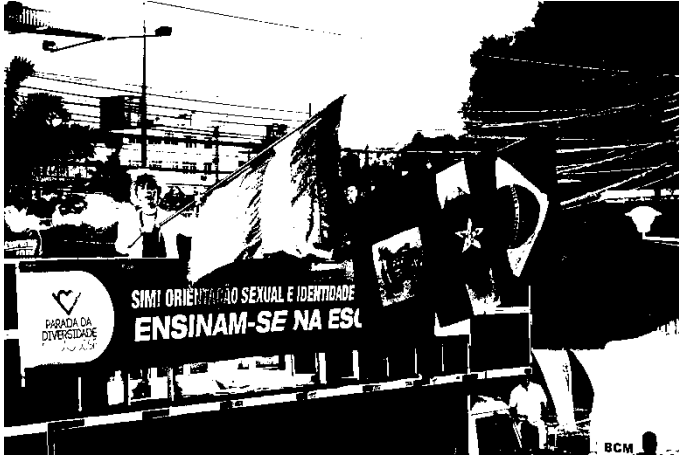
Fotografia 29: Segundo Carro de Som, com frases militantes, durante a V Parada da Diversidade de São José, 2016.

Na IX Parada da Diversidade de Florianópolis 2016, oficialmente nenhuma organização social ou integrantes de entidades do Movimento LGBT participaram. No entanto, nota-se no carro de som e mesmo na parada em si, participação de ativistas e militantes, sem caráter de representação na ocasião.