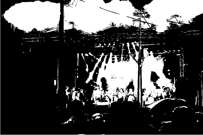
Fotografia 33: Show de Wanessa Camargo, durante a VIII Parada da Diversidade de Florianópolis, 2015.

A V Parada da Diversidade São José 2016 contou apenas com artistas locais, destacando-se a DJ Fabrizia, que é mulher trans e ativista LGBT na Grande Florianópolis. Fabrizia, assim como os demais artistas participaram gratuitamente do evento.