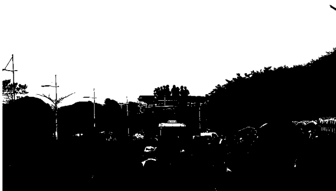
Fotografia 2: Visão anterior do Carro de som principal da IX Parada da Diversidade de Florianópolis, 2015. Tamanho: 100 metros.