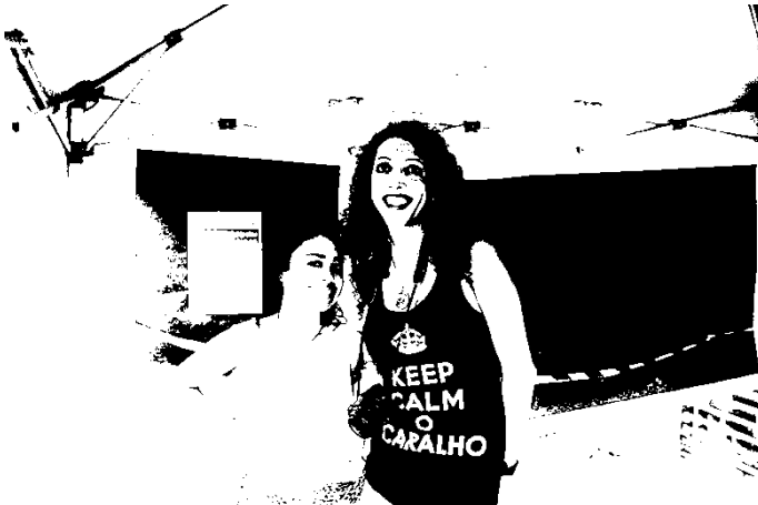
Fotografia 29: integrantes da ADEH durante o Bloco Vexame, 2016.

No PopGay 2016 não houve qualquer manifestação de cunho da militância, ou mesmo participação de militantes dos movimentos sociais. Novamente a figura do parlamentar Tiago Silva aparece como organizador do evento, sem diálogo com os Movimentos Sociais LGBT. Paralelamente, os integrantes do Fórum Diversidade da Grande Florianópolis foram organizadores e estiveram presentes no bloco Vexame, conforme registros fotográficos que se seguem.