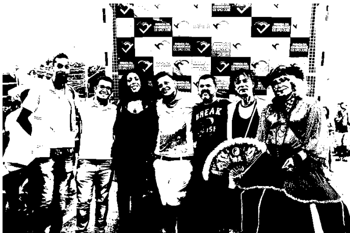
Fotografia 25: integrantes do Movimento LGBT (UNALGBT, ADEH e Instituto ROMA) durante a V Parada da Diversidade de São José, 2016, juntamente com representantes do poder público (Secretaria Estadual de Segurança Pública) e do executivo municipal (Secretaria de Cultura e Turismo de São José. SC).