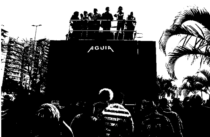
Fotografia 1: Visão posterior do Carro de som principal da XI Parada da Diversidade de Florianópolis, 2015. Tamanho: 100 metros.