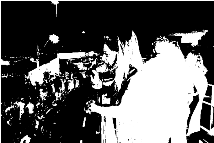
Fotografia 28: integrantes do Movimento LGBT na fala inicial durante a V Parada da Diversidade de São José, 2016.

Um exemplo do caráter militante da Parada de São José pode ser observado na fotografia que se segue. A faixa do carro de Som em que as bandeiras oficiais foram deflagradas trazia a seguinte mensagem “Sim! Orientação sexual e identidade de gênero ensinam-se na escola!”, referindo-se ao debate da época sobre a votação nos legislativos municipais sobre a temática de gênero nas escolas, com posicionamento tanto do Movimento LGBT como da Prefeitura Municipal de São José a favor da inclusão da temática, a despeito da tensão frente ao legislativo vinculado as denominações religiosas evangélicas.