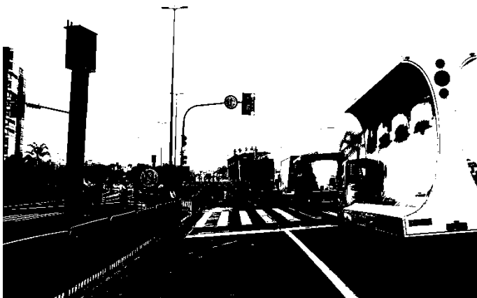
Fotografia 3: Carros de IX Parada da Diversidade de Florianópolis, 2015.

A V Parada da Diversidade São José 2016 teve como infraestrutura dois pequenos carros de som, também conseguidos através de recurso do executivo municipal.