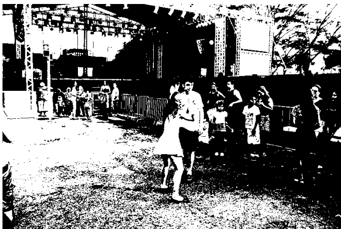
Fotografia 11: Palco do desfile do PopGay 2016. Tamanho: 100 metros.

Já o bloco concorrente - produzido pelo Movimento LGBT - Vexame 2016, contou com uma tenda para os espetáculos, e o fechamento da travessa onde se realizaria o Bloco, no centro de Florianópolis.