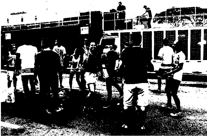
Fotografia 5: Visão lateral dos Carros de som da V Parada da Diversidade de São José, 2016. Tamanho de cada um: 50 metros.

A X Parada da Diversidade de Florianópolis 2016 foi realizada por iniciativa não governamental, e não envolveu apoio de setores públicos. Também não se caracterizou como um evento do Movimento LGBT, dado que não surgiu de qualquer organização específica. Contou com o apoio de LGBTs e simpatizantes. Um primeiro aspecto sobre infraestrutura a ser