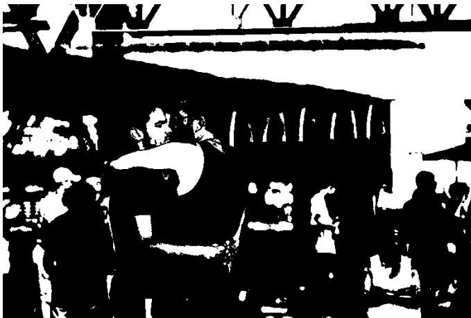
Fotografia 6: Visão da Beira-Mar Continental, onde foi realizada a X Parada da Diversidade de Florianópolis, 2016.

ressaltado é que, não foi conseguida autorização para realiza-la na Beirmar Norte, sendo realizada na Beira-Mar Continental. Ao que tudo indica, a Prefeitura bloqueou o uso alegando que haveria atividade no fim de seman, o que não aconteceu. Contou com dois carros de som, ambos de propriedade de um membro do movimento LGBT, que o cedeu sem custos e espontaneamente e sem envolvimento da ONG a que pertence.