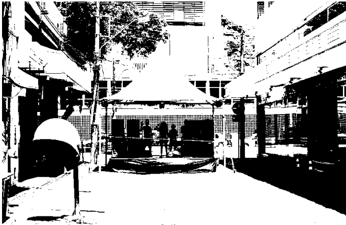
Fotografia 12: Visão posterior do palco do Bloco Vexame. Dimensões: 20 metros de largura por 5 metros de altura.