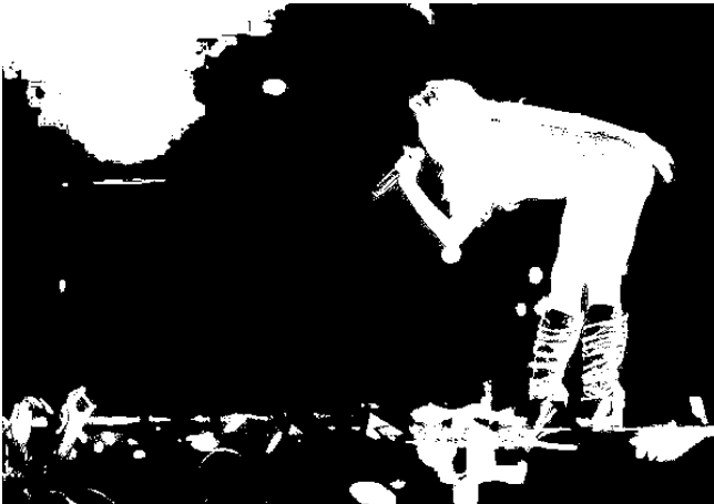
Fotografia 37: a artista Leo Aquila, no PopGay2016.

No bloco Vexame 2016 todos os artistas que participaram são integrantes do movimento LGBT de Florianópolis. Nenhum dos artistas cobrou cachê pela participação no evento.