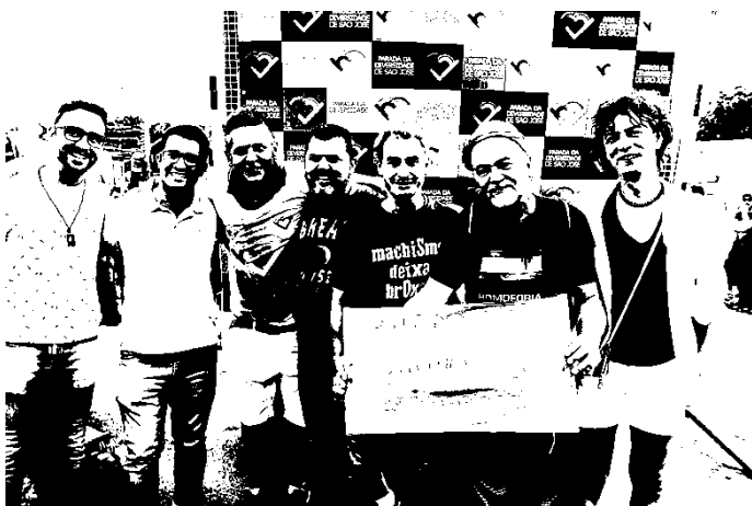
Fotografia 26: integrantes do Movimento LGBT (UNALGBT, Instituto ROMA, ADEH e Grupo Gay da Bahia) durante a V Parada da Diversidade de São José, 2016, juntamente com representantes do poder público (Secretaria Estadual de Segurança Pública) e do executivo municipal (Secretaria de Cultura e Turismo de São José. SC).