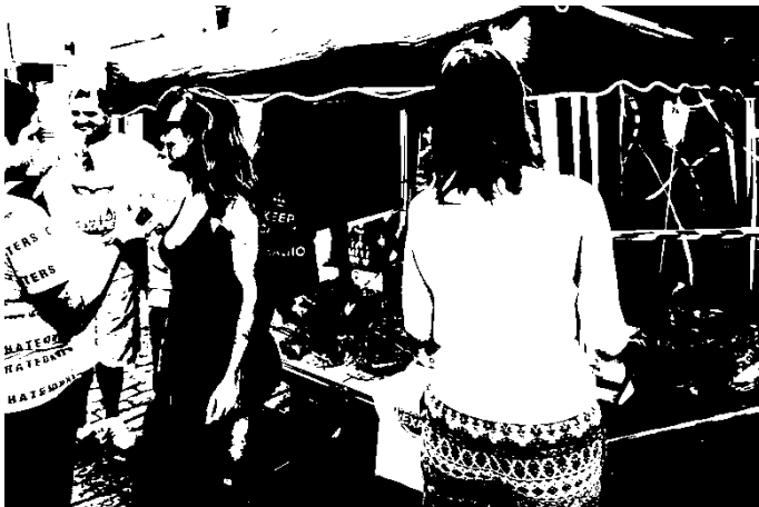
Fotografia 30: integrantes da ADEH durante o Bloco Vexame, 2016.