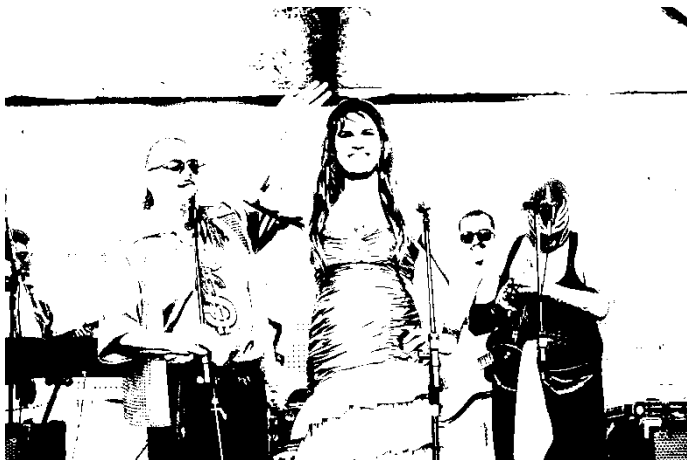
Fotografia 39: o grupo musical “Banda The Bregas”, de Florianópolis, no Vexame2016.