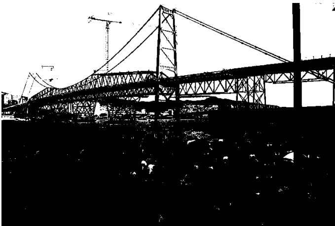
Fotografia 7: Visão da Beira-Mar Continental, onde foi realizada a X Parada da Diversidade de Florianópolis, 2016.