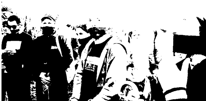
Fotografia 22: integrantes do Movimento LGBT durante a IX Parada da Diversidade de Florianópolis, 2015, em atitudes de protesto.

Na fotografia abaixo, um assessor direto do Parlamentar, vestindo camiseta com dizeres sobre a Parada da Diversidade sorri, ao lado de representante do Movimento LGBT que utiliza a mordaça que emblematiza o protesto frente ao silenciamento.