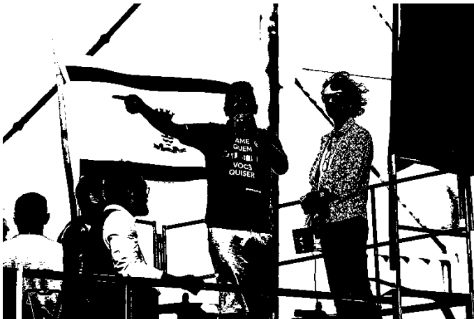
Fotografia 28: integrantes do Movimento LGBT (UNALGBT e Instituto ROMA) na fala inicial durante a IX Parada da Diversidade de Florianópolis, 2016.

Na IX Parada da Diversidade de Florianópolis 2016, oficialmente nenhuma organização social ou integrantes de entidades do Movimento LGBT participaram. No entanto, nota-se no carro de som e mesmo na parada em si, participação de ativistas e militantes, sem caráter de representação na ocasião.