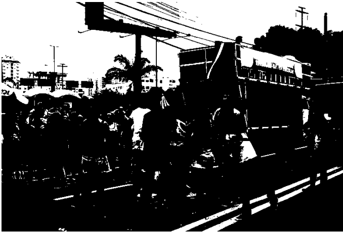
Fotografia 4: Carro de som principal da V Parada da Diversidade de São José, 2016. Tamanho: 50 metros.