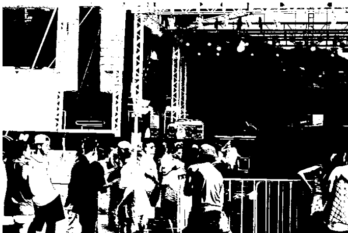
Fotografia 10: Visão frontal do palco do PopGay2016. Dimensões: 100 metros de largura por 30 metros de altura.

Gigante e isolamento da área de realização do evento, conforme determinação da patrocinadora.