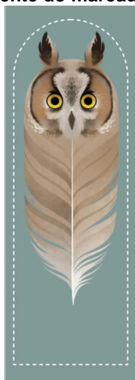
Figura 2 - Frente do marcador de página

Fonte: Marcadores (by Sash-kash) disponíveis para download em: http://goo.gl/cRbWq