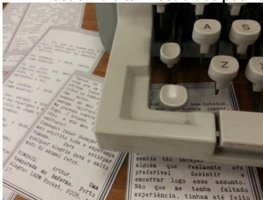
Fotografia 1 – "Amostra Maldita: mostra dos poemas malditos"