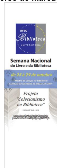
Figura 3 - Verso do marcador de página