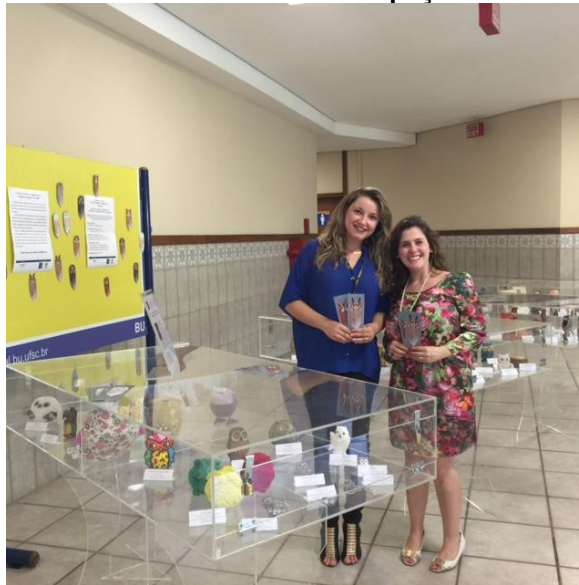
Fotografia 5 - “Mostra de corujas na biblioteca: o símbolo da sabedoria no espaço do saber”