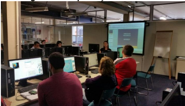
Fotografia 7 – Capacitações ministradas