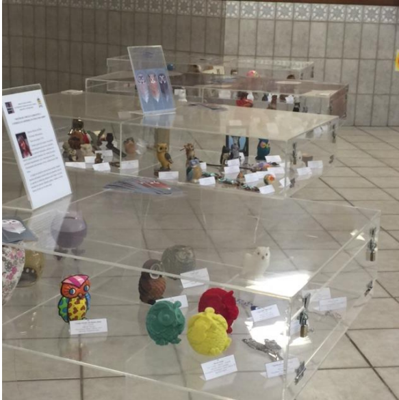
Fotografia 3 - “Mostra de corujas na biblioteca: o símbolo da sabedoria no espaço do saber”