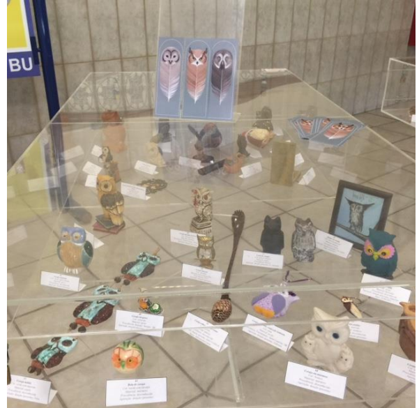
Fotografia 4 - “Mostra de corujas na biblioteca: o símbolo da sabedoria no espaço do saber”