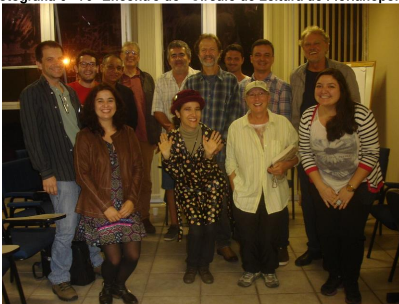
Fotografia 6 - 79º Encontro do “Círculo de Leitura de Florianópolis”