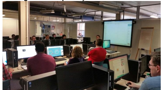
Fotografia 8 - Capacitações ministradas