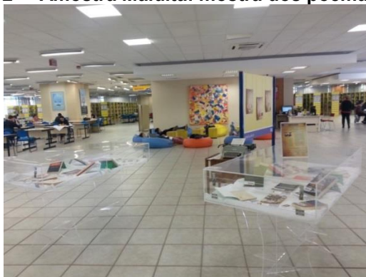
Fotografia 2 - "Amostra Maldita: mostra dos poemas malditos"