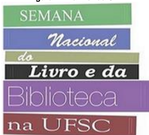
Figura 1 - Banner da SNLB