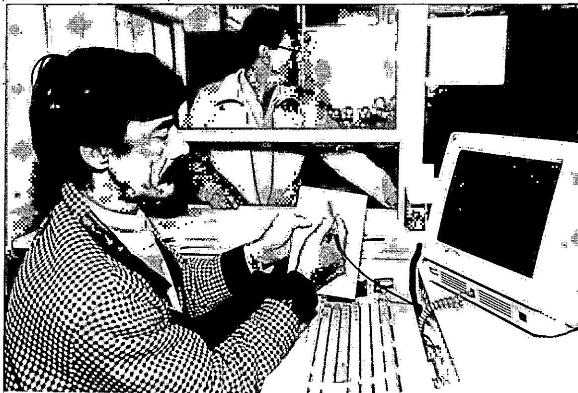
Software da UFSC, que utiliza caneta ótica, já é usado por 19 instituições

A maioria dos produtos que serão apresentados foi desenvolvida nos laboratórios de ensino e pesquisa do Centro Tecnológico. Mas este ano, além do CTC e da Biblioteca Universitária, também