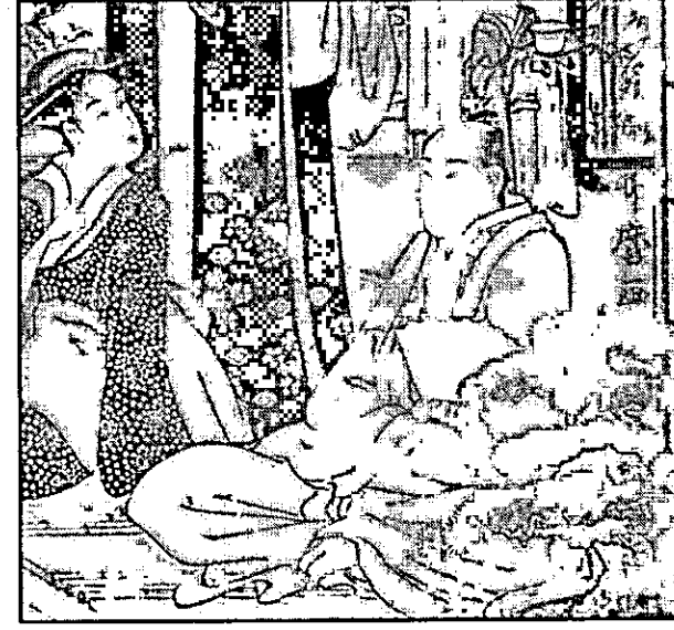
Gravuras antigas retratam o Japão imperial