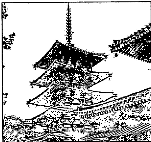
A arquitetura local tem traços característicos