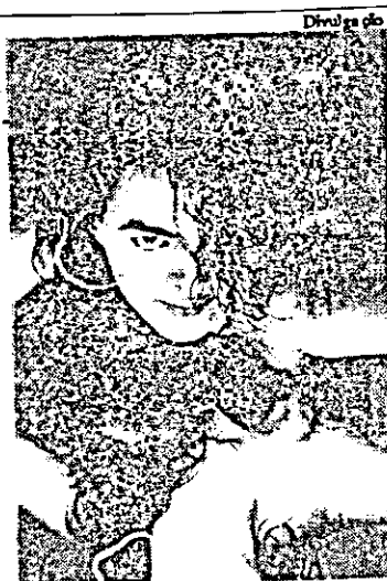
Explorando o sensual

Fotógrafo Ricardo Rodrigues expõe na Biblioteca Universitária seus trabalhos enfocando como tema "Sombra e Luz". As visitas podem ser feitas até o dia 8, das 7h30min às 21h45min, de segunda a sexta. São fotos de moda, publicidade e paisagens marcadas por uma peculiaridade: a exploração do contraste claro-escuro nas imagens.