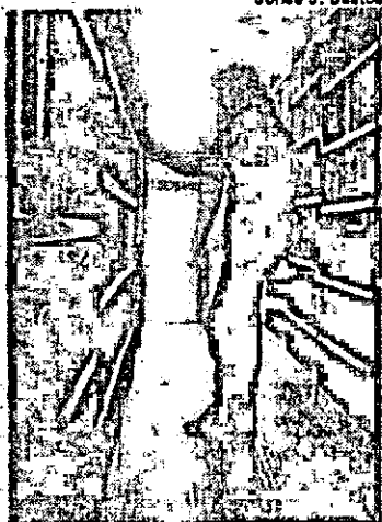
Expansão da Biblioteca promete fim do eclipse

O filósofo e ecologista chileno Suryavan Xolhar chega à UFSC, dia 27, para o lançamento de mais um livro da filosofia Onkinkai (sistema andino de realização integral), que já reuniu dois mil adeptos nas três Américas. O Segredo dos Dias , sua primeira publicação brasileira, lançada em agosto na Bienal do livro vem compor o universo de 60 escritos do autor, que circulam com notoriedade no Chile e no México. A tarde de autógrafos acontece às 18h30min, no Hall da Reitoria, antecedendo a palestra Êxito e Superconsciência .