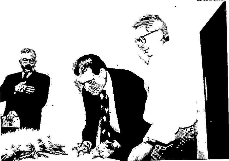
Governador prestigiou solenidade