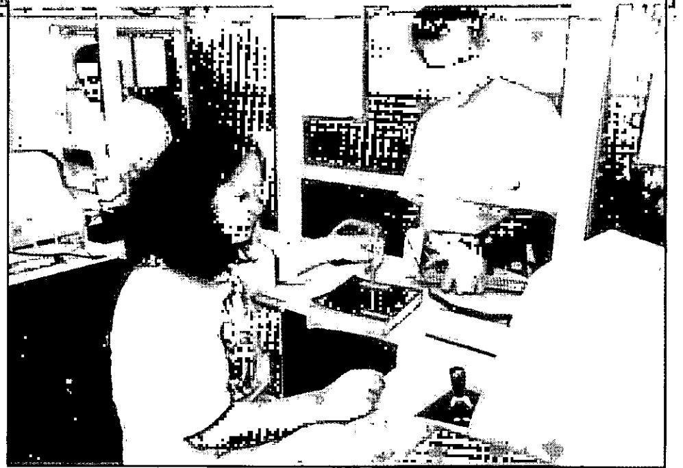
A administração dos recursos de informática é feita pela própria biblioteca

A equipe que trabalha no Núcleo é pequena: dois analistas de sistema; uma bibliotecária e um programador. O maior problema enfrentado pelo grupo são os baixos salários, para gerar recursos que permitam manter o nível do serviço. O software é repassado, o cliente paga o treinamento, algo em torno de R$ 3,6 mil. O Nexum já vem sendo utilizado na Biblioteca Universitária com muito sucesso, gerando comodidade para o usuário e para a administração. A intenção do Núcleo agora é continuar o trabalho no sentido de melhorar o serviço, ampliando para registro de filmes, slides, fotos, mapas, discos e material de arte.