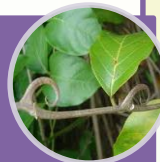
Mikania laevigata Schultz Bip