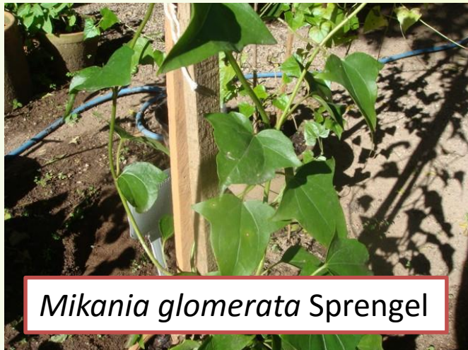
Mikania glomerata Sprengel

Gripe, resfriado, bronquites alérgica e infecciosa como expectorante