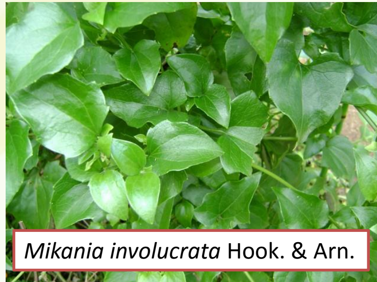
Mikania involucrata Hook. & Arn.