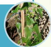
Mikania glomerata Spreng