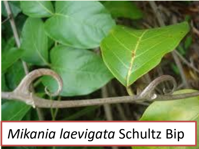
Mikania laevigata Schultz Bip