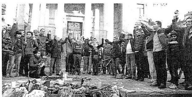
Durante todo o dia, homenagens aos mortos e aos feridos nos atentados surgiram em diferentes ruas da cidade

— Estávamos indo para o avião e escutamos um estrondo muito forte. O chão tremeu. Quando olhei para o lado, tinha uma fumaça muito grande. Pensamos que fosse um acidente, porque o