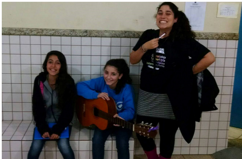
Figura 5 – Alunas do Ensino Fundamental tocando violão (Junho de 2015. Fonte: Acervo pessoal)

por nós bolsistas da equipe, que visitávamos as escolas (pesquisa sobre a realidade escolar) antes de irmos a campo, mas, sobretudo, era um momento crucial pois conseguimos notar/confirmar através das conversas com as professoras, coordenadoras, orientadoras o quanto as discussões sobre gênero e sexualidades pairam sobre/na marginalidade dos conteúdos previstos a serem dados em aula, serem trabalhados e demais vivências estabelecidas no ambiente escolar.