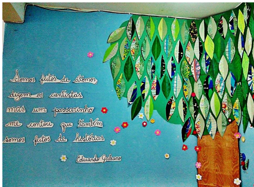
FIGURA 1 “Cantinho da leitura” - “Somos feitos de átomos, dizem os cientistas, mas um passarinho me contou que também somos feitos de histórias”. Autor: Eduardo Galeano (Escola Escola Básica José Amaro Cordeiro, Morro das Pedras, Florianópolis – SC. Julho de 2015.).