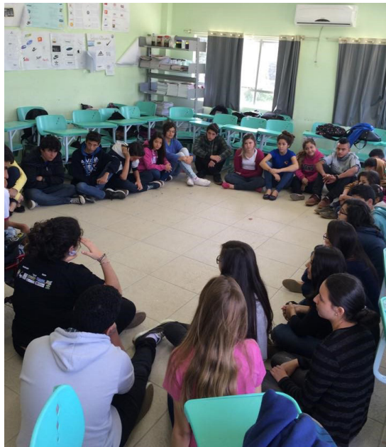
Figura 2 - Oficina “Violências contra as mulheres”. Turma do ensino fundamental E.M.Profª Mara Luiza Vieira Liberato Julho de 2015.

Nos próximos tópicos, trago as falas e depoimentos dos estudantes que compuseram o campo desta pesquisa, relacionados aos trechos das músicas trabalhadas em sala de aula.