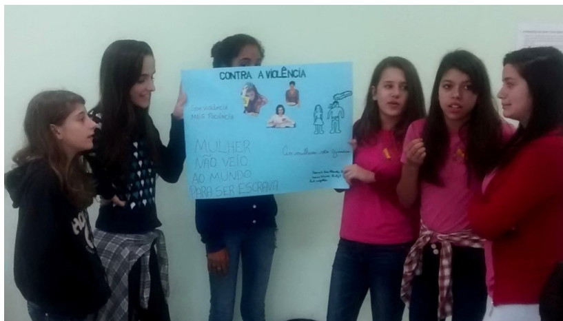
Figura 3 - Cartaz feito por alunas do Ensino Fundamental: Contra a violência. (A mulher não veio ao mundo para ser escrava. Abril de 2015.)

Violência suave, insensível, invisível a suas próprias vítimas, que se exerce essencialmente pelas vias puramente simbólicas da comunicação e do conhecimento, ou, mais precisamente, do desconhecimento, do reconhecimento ou, em última instância, do sentimento (BOURDIEU, 2014, p. 12).