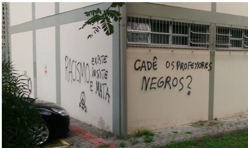
Figura 4 - “Racismo existe, persiste e mata” (Pichação no campus UFSC Trindade, Florianópolis, SC. Maio de 2015.)

Escola”, promovido pelo LEFIS/UFSC em parceria com o NIGS, em que muit@s professor@s relataram essa forte presença da sexualidade lésbica e bissexual das alunas.