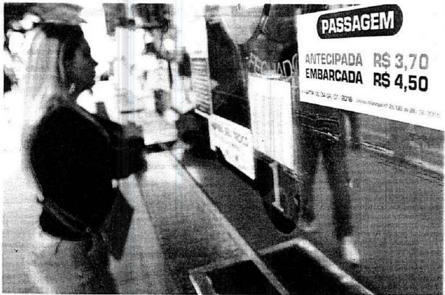
Segundo a Prefeitura de Joinville, apenas 5% dos usuários do transporte coletivo da cidade adquirem o bilhete depois de já terem embarcado nos ônibus

O Movimento Passe Livre defende que o transporte poderia ser gratuito por meio do chamado imposto progressivo, que implicaria em cobrar mais de quem tem mais posses e de minimizar a cobrança de quem tem renda menor.