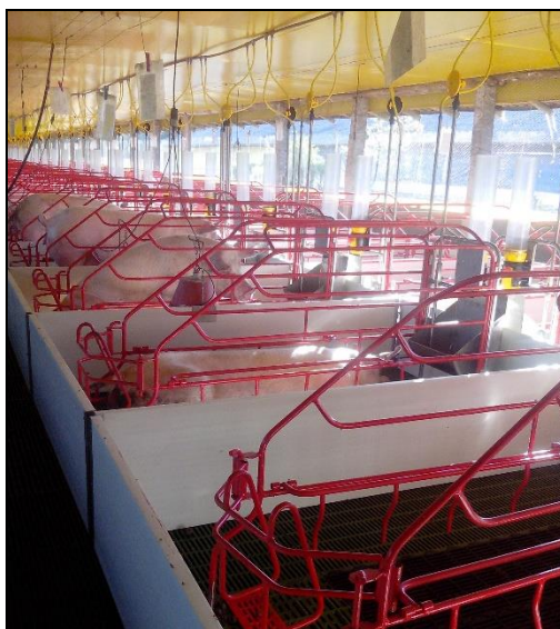
Figura 1 - Sala de maternidade

procedimentos padronizados de cuidados ao nascer com os leitões foram realizados de acordo com a rotina da UPL. O manejo dos leitões foi feito nos primeiros dias de vida e consistiu em: cortar o terço final do rabo com alicate termo-cauterizador, aplicar via intramuscular 200 mg de ferro e fornecer 2 ml de probiótico via oral para prevenção de diarreia. A castração cirúrgica foi realizada entre o 5º e 8º dia de vida, de acordo com a rotina da granja.