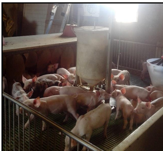
Figura 2 - Ama de leite artificial

padrão adotado na granja. Os leitões do Tratamento Ama de leite continuaram a receber a mesma ração após transferência para a “ama de leite artificial”. Porém, na máquina a ração foi fornecida umedificada com água morna. A granja possui dois equipamentos “ama de leite artificial”, sendo que cada um permite comportar até 45 leitões, abrigados em escamoteador com piso térmico e baia de piso plástico ripado (Figura 2). A ração umedecida foi fornecida à vontade a cada 45 minutos, de acordo com a programação prévia do equipamento para disponibilizar alimento fresco aos animais. O controle da liberação da quantidade de ração úmida era realizado via alavanca acionada pelo leitão com o focinho.