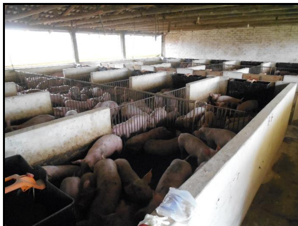
Figura 3 - Sala de creche

No dia da transferência para a fase de creche, os leitões do TA tinham em média 45 dias de idade com peso médio de 5,8 kg. Os leitões do Tratamento Controle, 20 dias com 4,53 kg e os do Tratamento Natural, 23 dias com 6,64 kg. Considerando que os leitões do Tratamento Ama de leite foram transferidos para a fase de creche em média 22,5 dias após os demais, utilizou-se como fator comparativo, o ganho de peso médio diário dos animais.