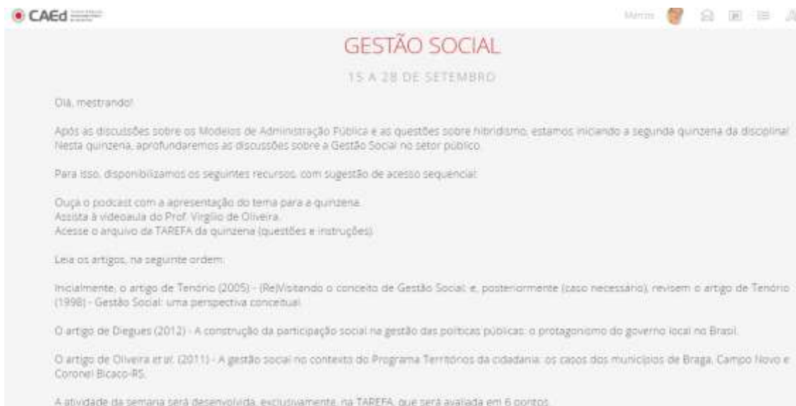
Figura 3: Disciplina Administração e Financiamento da Educação Pública, descrição

Na Figura 4 visualizam-se os materiais didáticos, sendo um Podcast, uma vídeoaula, os textos para leitura e o Fórum para discussão.