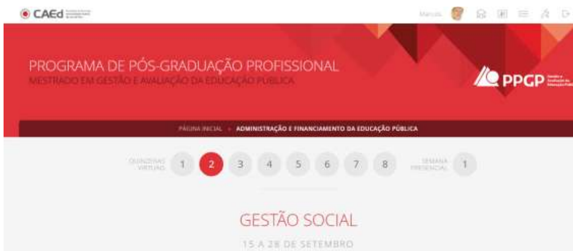
Figura 2: Disciplina Administração e Financiamento da Educação Pública, rótulo inicial

A Figura 2 demonstra o Ambiente Virtual de Aprendizagem (AVA), da disciplina Administração e Financiamento da Educação Pública, em especial os conteúdos programáticos da 2ª quinzena, intitulado de Gestão Social. Observa-se, ainda, que como relatado anteriormente, as disciplinas online/presencial são ministradas em 8 quinzenas.