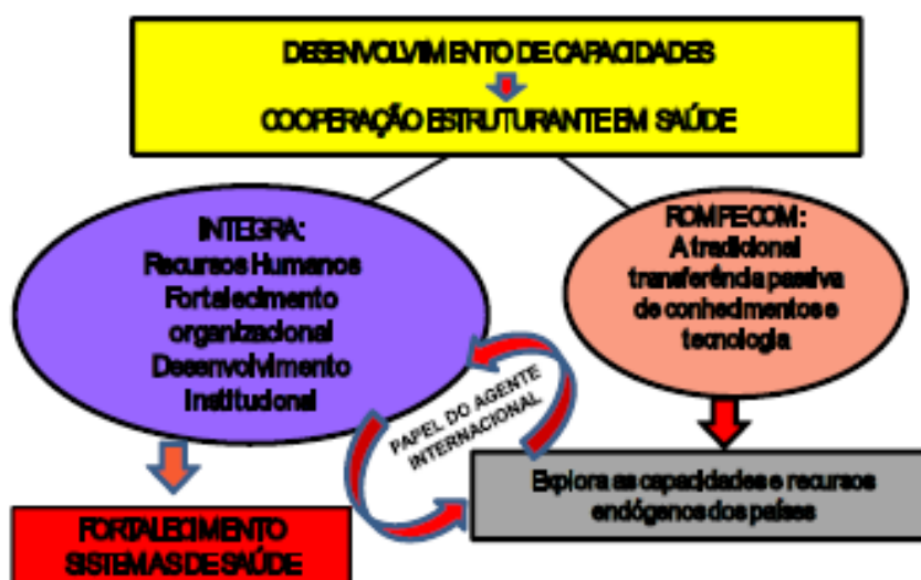
Figura 1 – Cooperação Estruturante em Saúde: Inovações Contextuais e Operacionais

Nesse modelo, reúnem-se atenções para melhora institucional dos sistemas de saúde dos países parceiros, através de ações conjuntas que utilizam de construção de capacidades locais e geração de conhecimento. Ou seja, o objetivo é que se construam instituições estruturantes de saúde local. Os agentes internacionais, por conseguinte, são variados e adquirem um novo papel de atuação. O objetivo é que eles atuem conjuntamente de forma descentralizada, em redes nacionais e regionais, e que se dediquem aos esforços de estruturação dos sistemas de saúde de seus países (ALMEIDA et al , 2010). A Figura 1 congrega essas informações organizadas em um modelo ilustrativo.