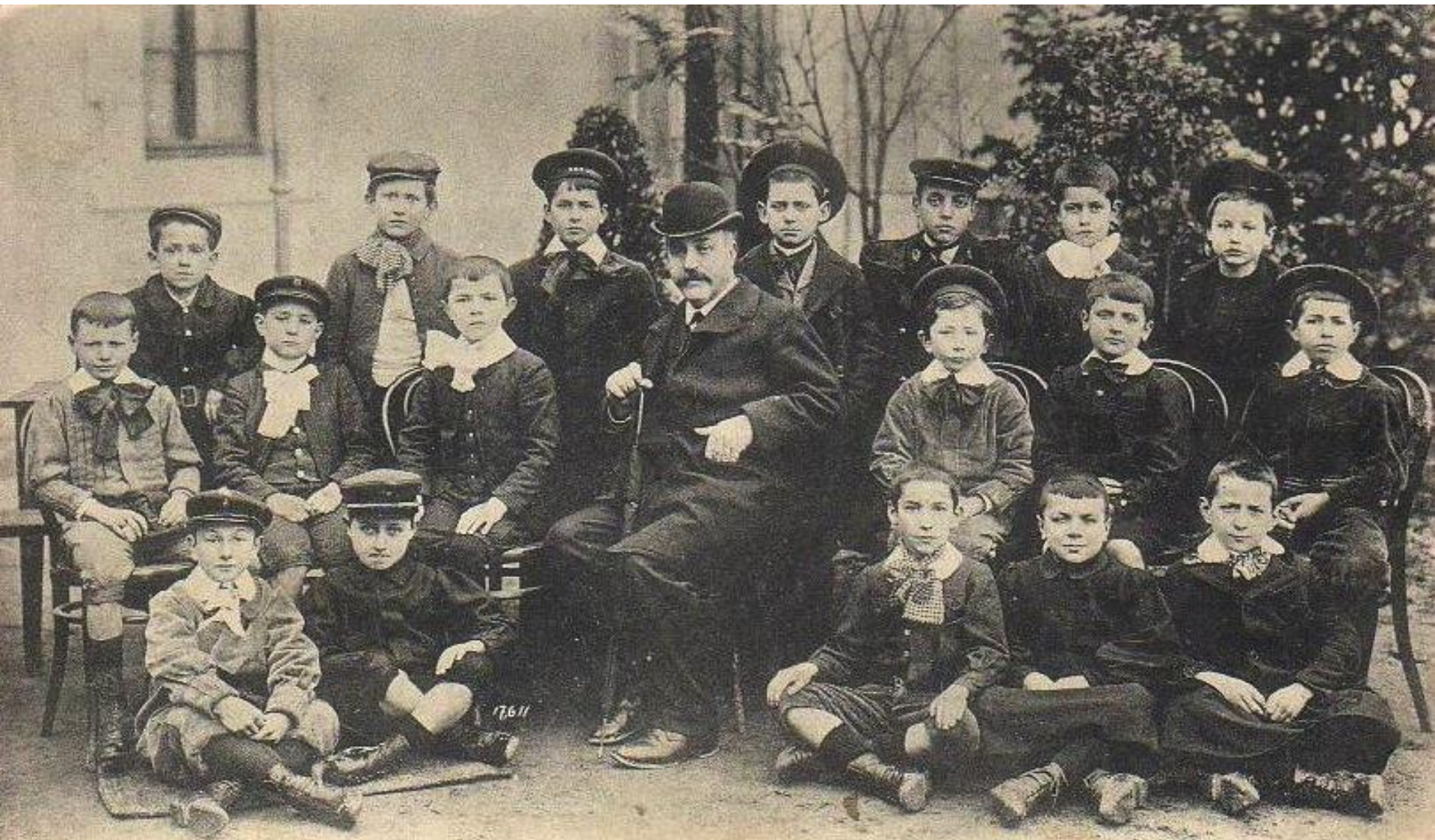
CAHORS. - Lycée Gambetta (1907) - Classe de 7 e