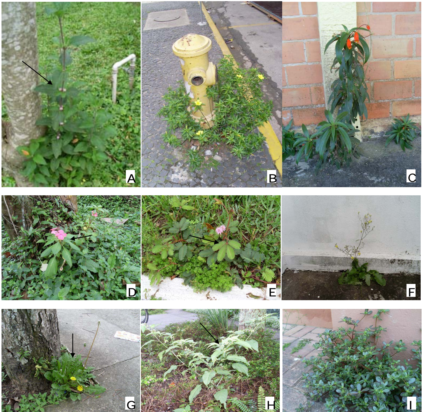
Figura 4: fotos de algumas espécies presentes no levantamento. A: Lippia alba em gramado bem iluminado. B: Turnera ulmifolia em fresta. C: Seemannia sylvatica em fresta. D: Impatiens walleriana em gramado sombreado. E: Mimosa pudica em gramado bem iluminado. F: Youngia japonica em fresta. G: Taraxacum officinale em jardim. H: Solanum americanum em jardim. I: Portulaca oleracea em fresta.