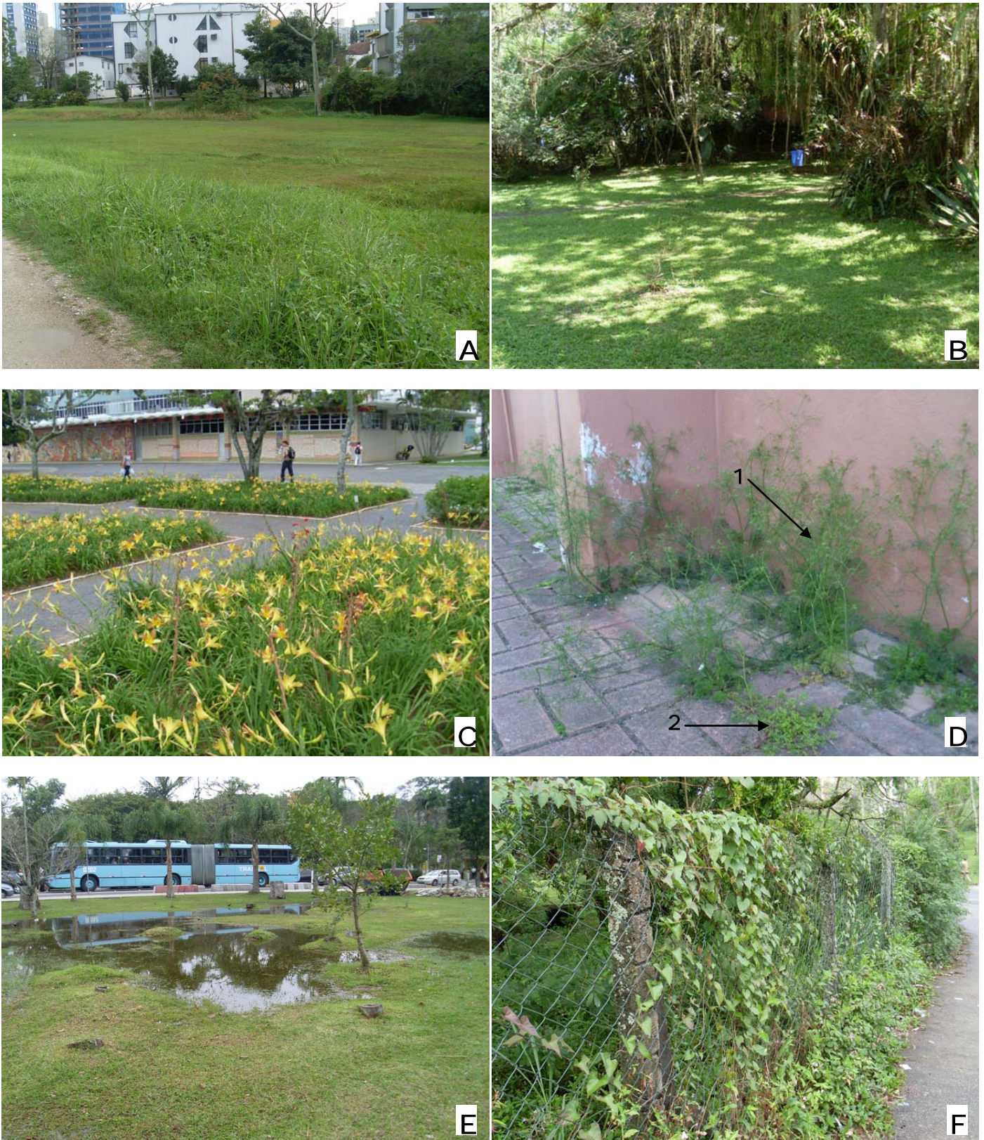
Figura 2: fotos de ambientes antrópicos amostrados. A: área de gramado bem iluminado, recém cortada, ao lado do prédio novo da Matemática. B: área de gramado sombreado, recém cortada, em frente à Secretaria do Departamento de Botânica. C: áreas de jardim, em frente à Reitoria. D: ambiente de frestas, junto ao prédio do Centro de Eventos, onde podem ser vistas Cyclosporum leptophyllum (1) e Soliva sessilis (2). E: área de baixada úmida, recém cortada, em frente ao CSE. F: ambiente de cerca, no limite da área do Departamento de Botânica.