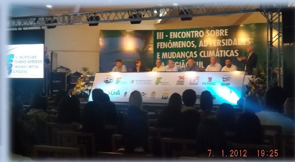
III Encontro sobre Adversidades, Fenômenos e Mudanças Climáticas da Região Sul, Araranguá/SC