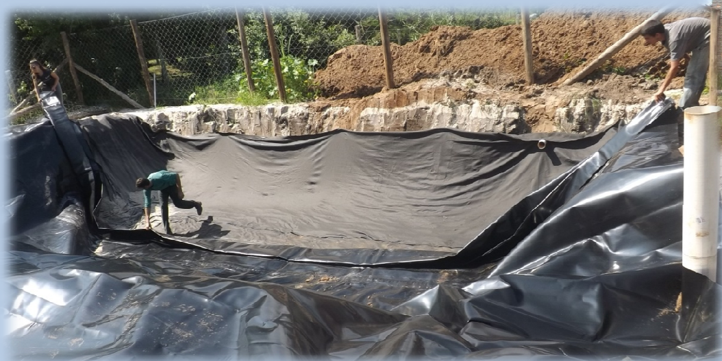
Construção de Cisterna com Areia