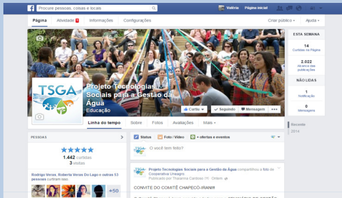
Página no Facebook

Disseminação de informações e materiais pedagógicos em mídias digitais e redes parceiras: