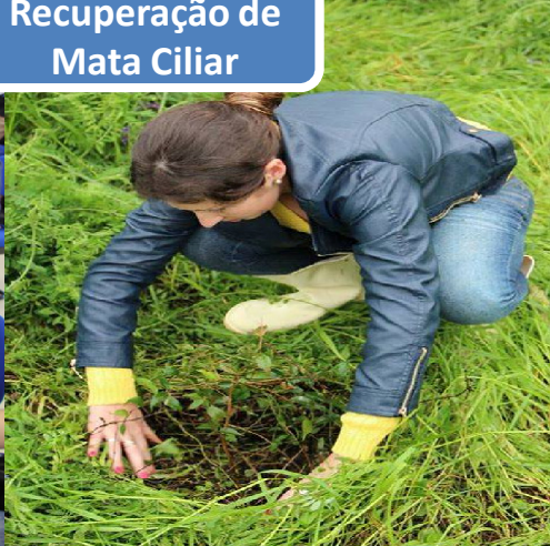
Recuperação de Mata Ciliar