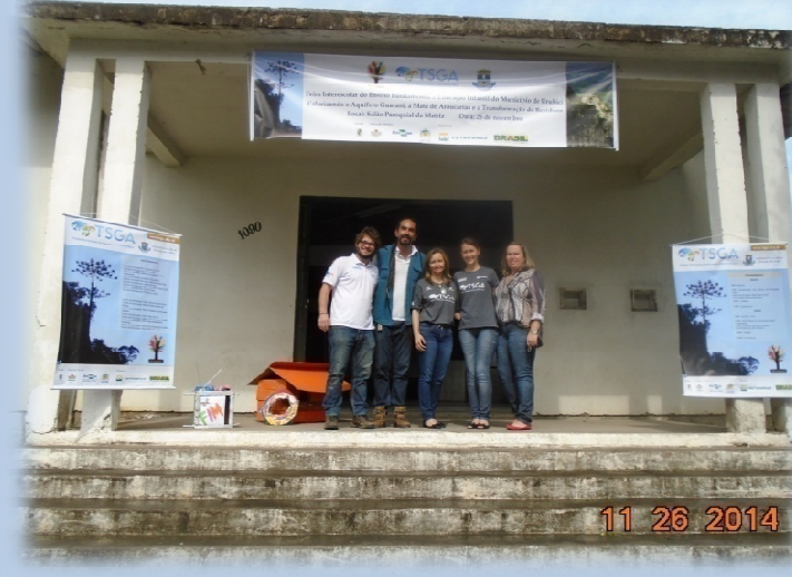
Feira Interescolar de Ensino Fundamental e Infantil - Urubici/SC