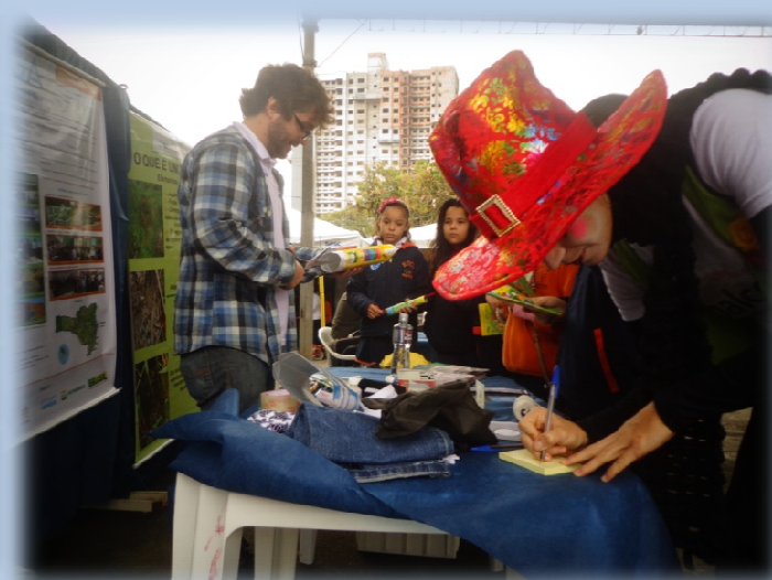
Semana do Meio Ambiente de Tubarão/SC – Celebração Dia Mundial do Meio Ambiente