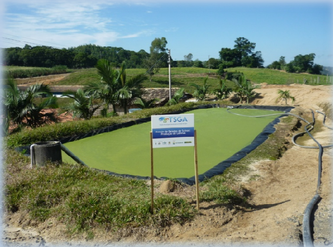
Lagoa de Lemnas