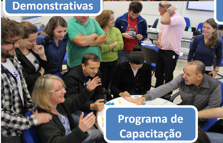
Programa de Capacitação