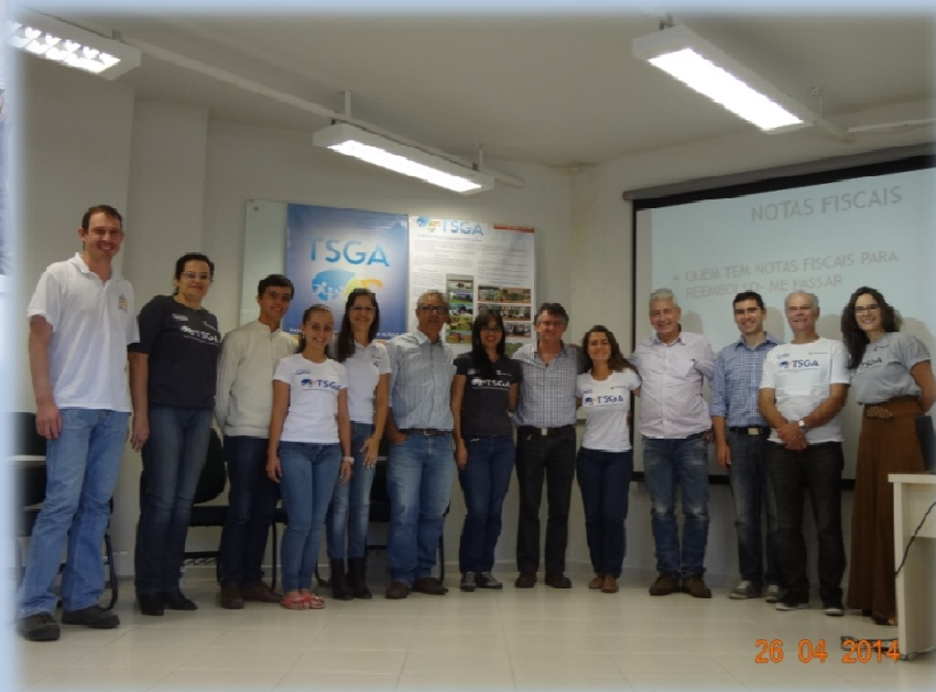
Encontro Ministrantes Cursos – Florianópolis /SC