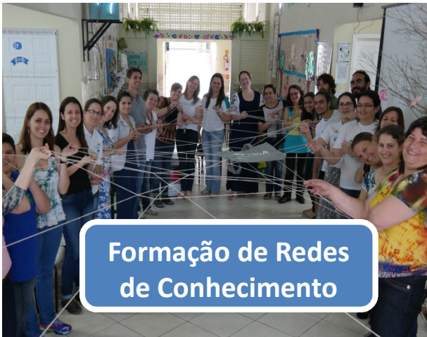
Formação de Redes de Conhecimento