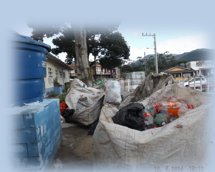
Gincana Ambiental: Coleta de Resíduos Recicláveis

Idealizado pela Escola Donato Alípio de Campos de Biguaçu/SC, a proposta foi disseminada pelos demais parceiros a fim de fomentar o espaço escolar como referencia no recebimento e tratamento de resíduos.