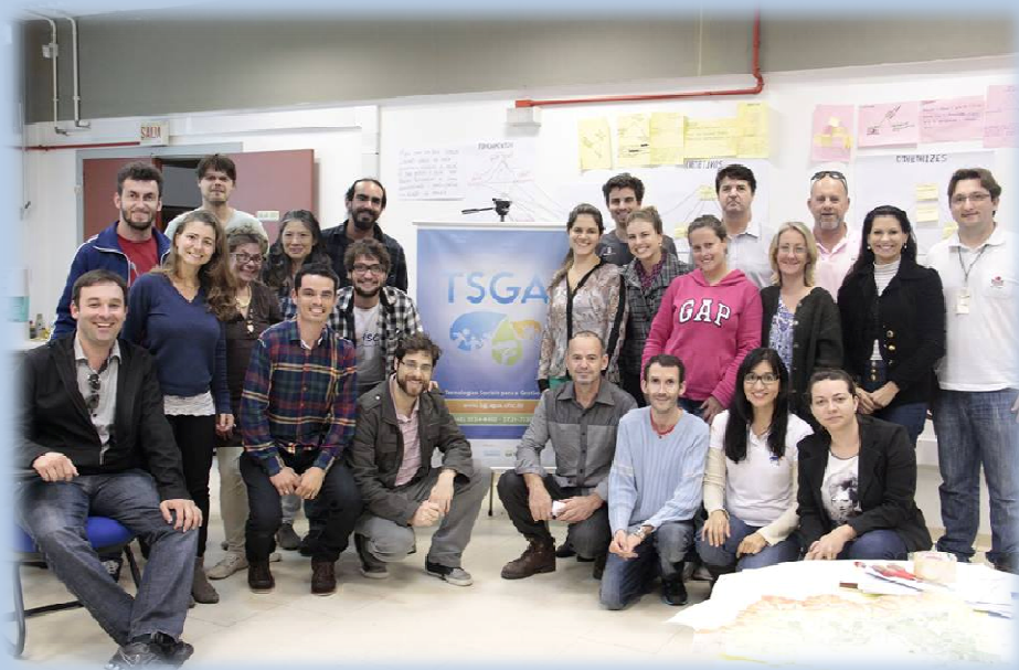
Curso sobre Gestão Social de Bacias Hidrográficas – Araranguá/SC