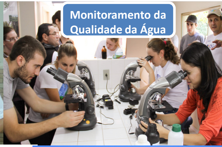
Monitoramento da Qualidade da Água