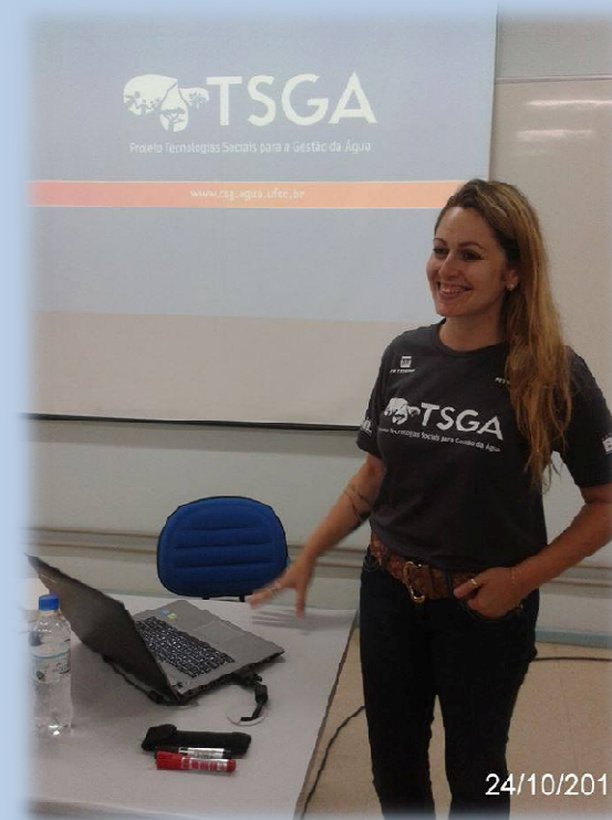
Palestra sobre Técnicas de Biologia Molecular UFSM – Santa Maria/RS