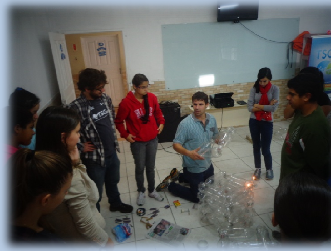
Oficina de Coletores de garrafa PET – Escola Donato , Biguaçu/SC