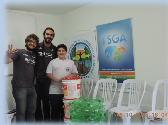
Oficina de Construção de Minhocário Caseiro – FUNAT , Tubarão/SC