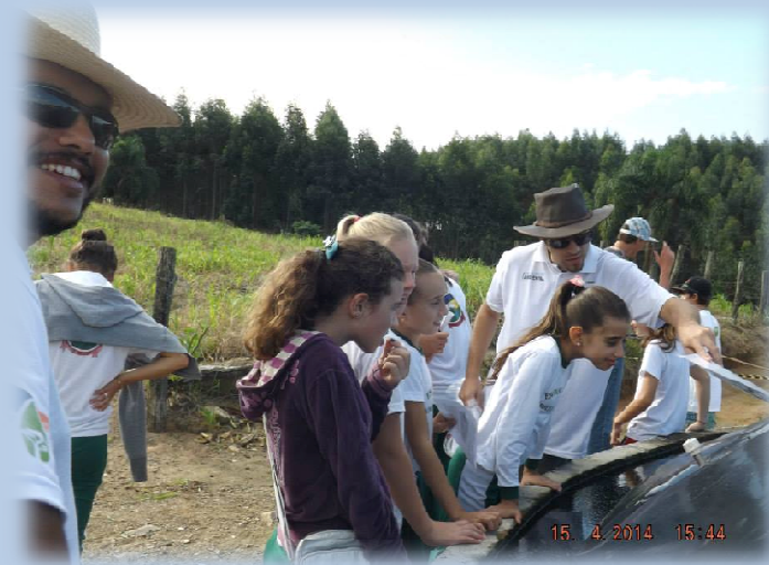
Dia de Campo na UD de Tratamento e Manejo de Dejetos Suínos , Braço do Norte/SC