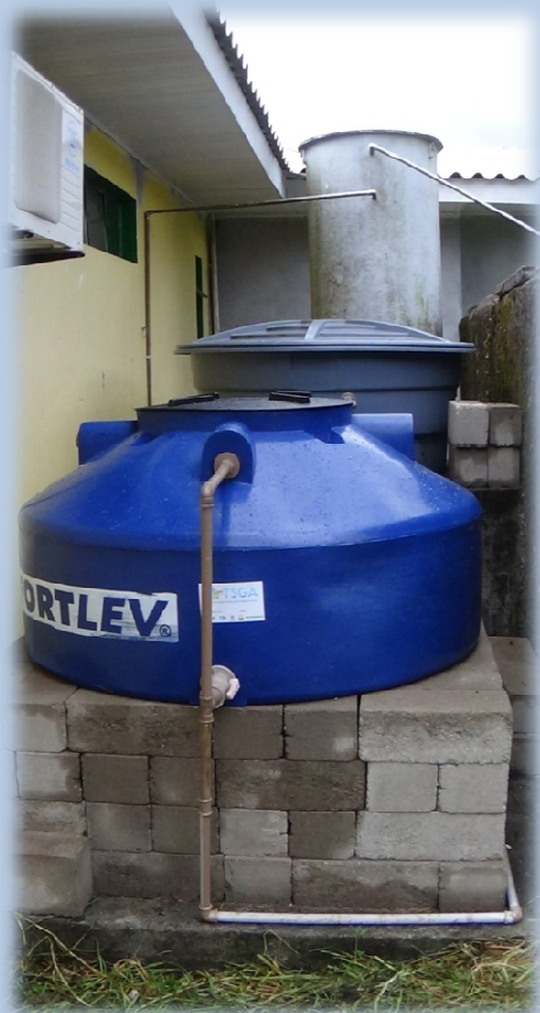
Filtro Lento Retrolavável