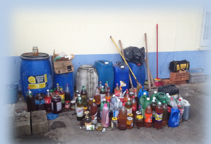
Gincana Ambiental: Coleta de Óleo de Cozinha