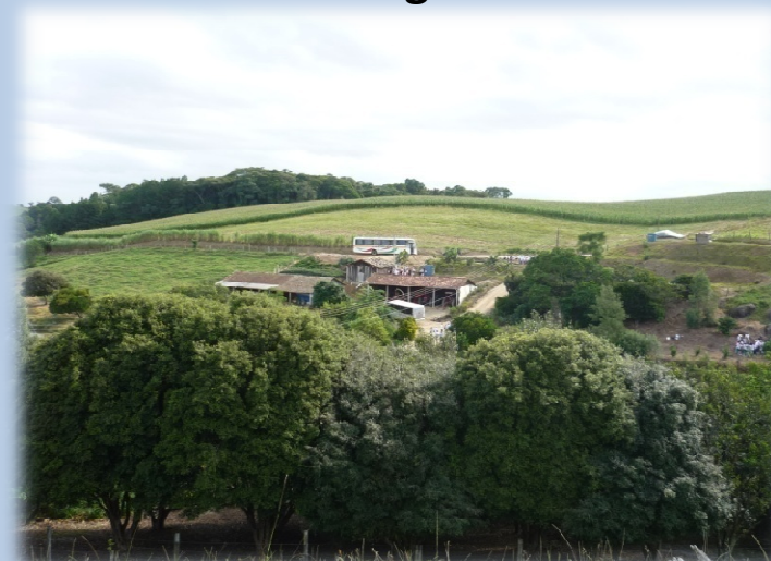
Lavoura – Vista geral da Propriedade