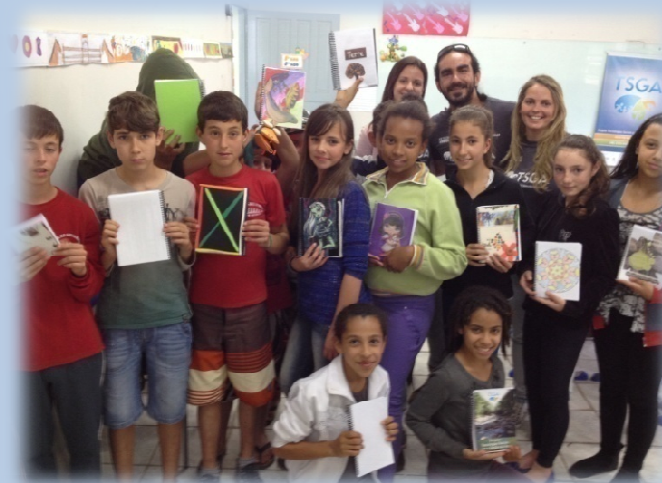
Oficina de Confeção de Ecocadernos – Escola Ana Régis, São João do Sul/SC