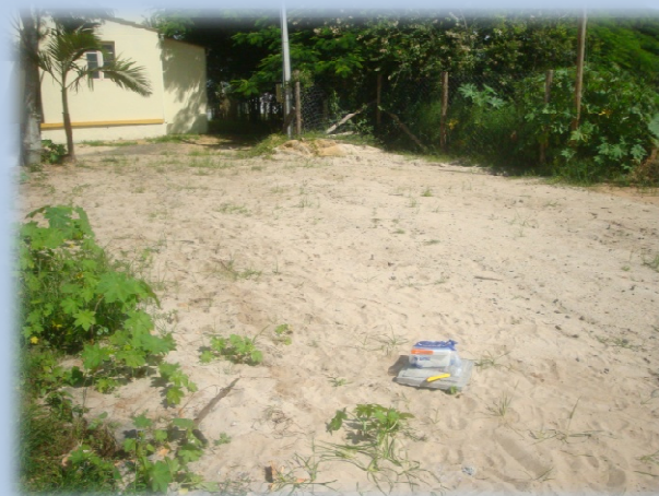
Cisterna com Areia