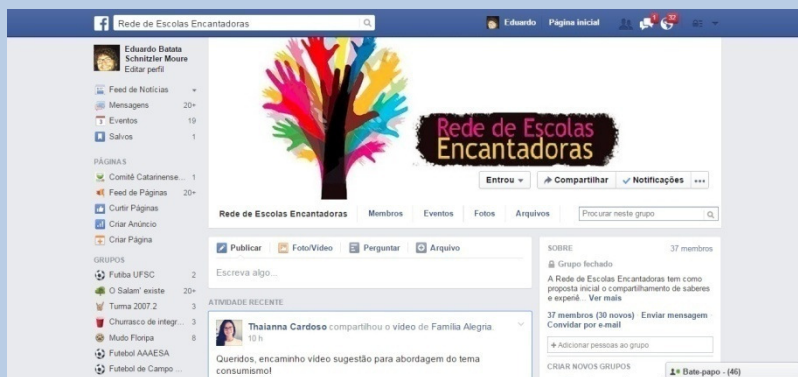
Rede de Escola Encantadoras no Facebook