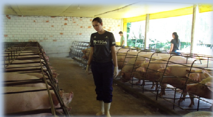
Pesquisa de Doutorado em Sustentabilidade Ambiental na Suinocultura – Concórdia /SC