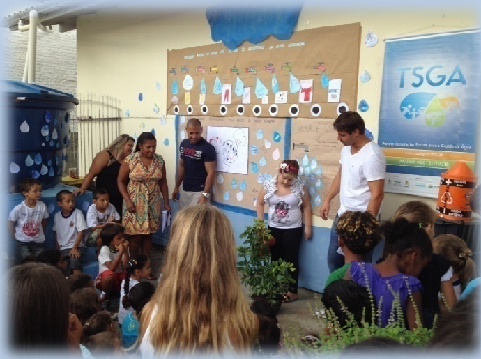
Celebração do Dia Mundial da Água - Escola Donato, Biguaçu/SC

O Projeto TSGA, através de seus colaboradores, promoveu e participou diversos eventos de caráter científico e pedagógico, visando divulgar os resultados e tecnologias sociais do projeto, além de conscientizar, formar e capacitar alunos, professores e comunidades para a importância do bom uso e gestão da água.