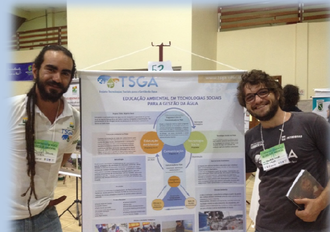
III Encontro Catarinense de Educação Ambiental (III ECEA) – Piratuba/SC