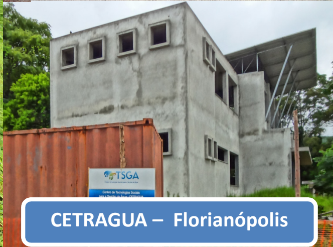
CETRAGUA – Florianópolis