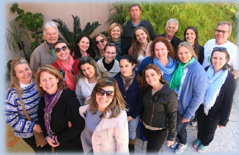
Seminário Guardiões de Gaia