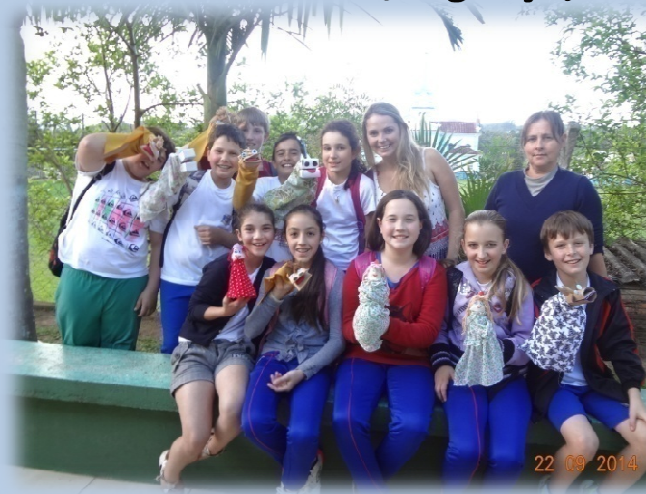
Oficina de Confeção de Fantoques – Escola Leopoldo Hannoff , Orleans/SC