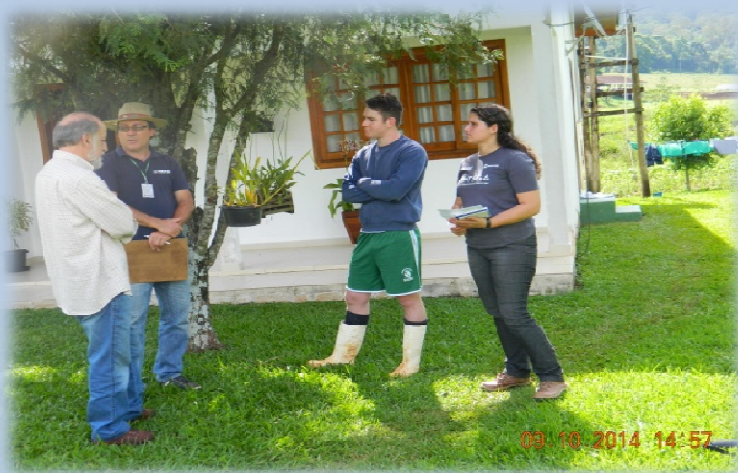
Pesquisa de Mestrado em Agroecologia - Chapecó/SC