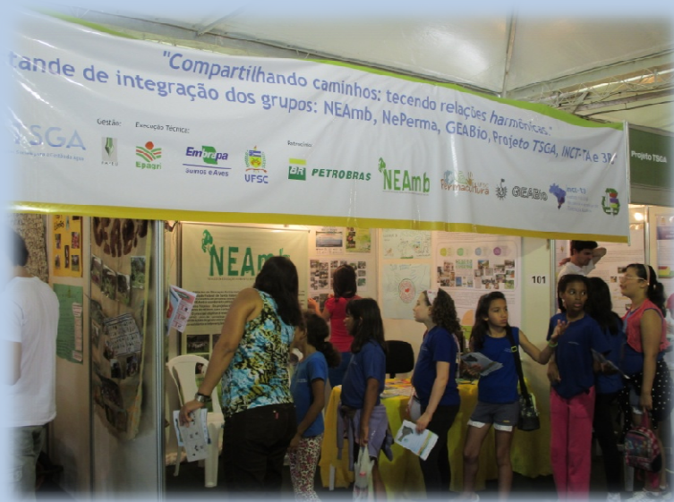
13ª Semana de Ensino, Pesquisa e Extensão da UFSC (13ª SEPEX) – Florianópolis/SC