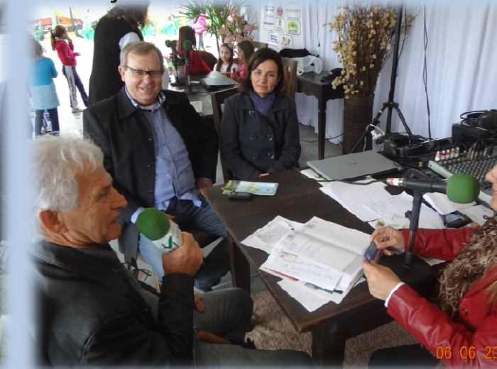
Feira de Exposição Agropecuária do Vale do Braço do Norte, FEAGRO – Braço do Norte/SC