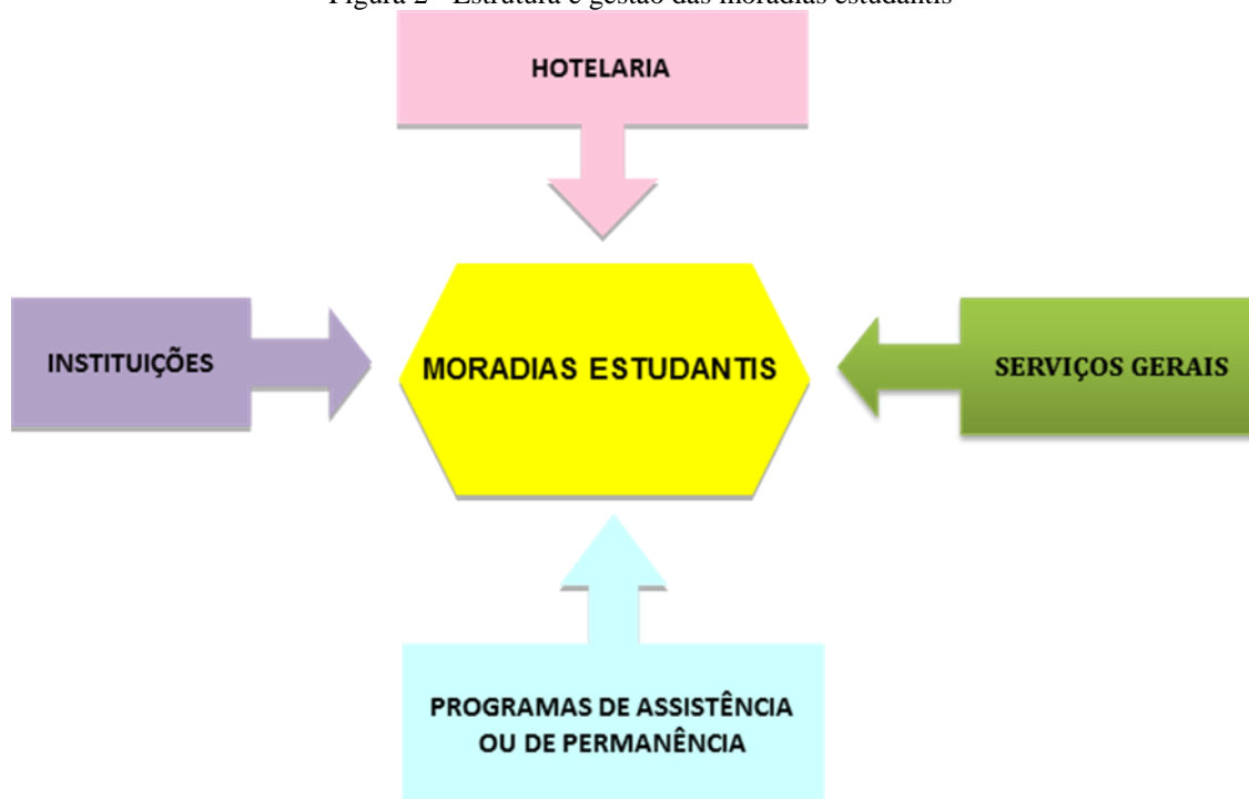
Figura 2 - Estrutura e gestão das moradias estudantis