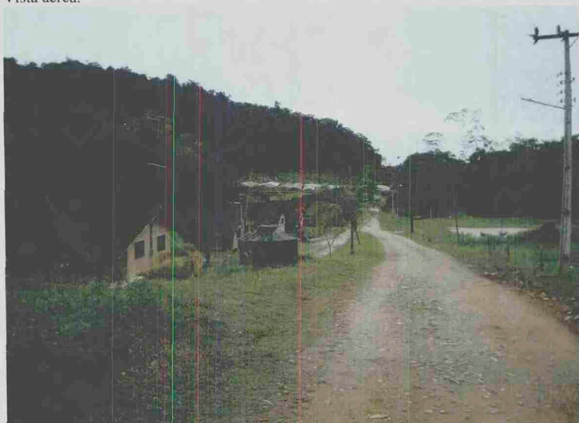
Vista da chegada à agrovila.