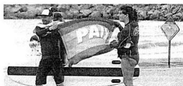
Bandeira foi levada para a beira da praia da Barra da Lagoa