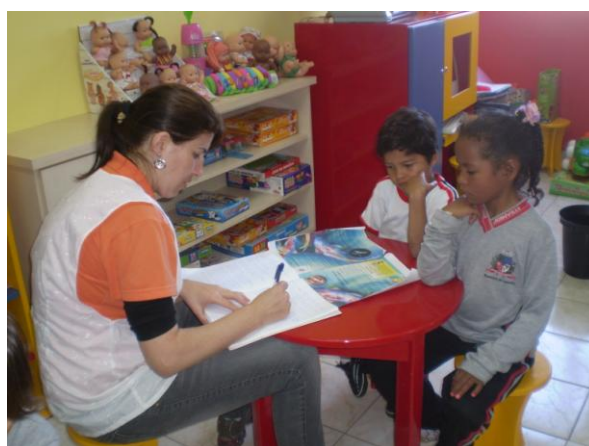
F4- Professora como escriba.