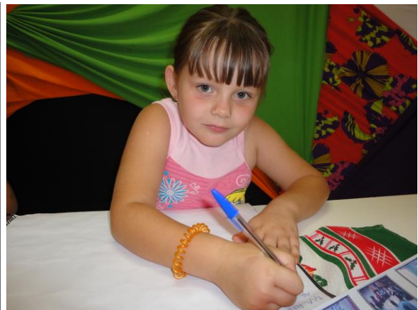
F6- Noite de autógrafos do livro.

No desenvolvimento deste projeto as crianças não tiveram problemas para se apropriar dos conhecimentos em relação ao texto informativo, aos conhecimentos científicos e a apropriação da linguagem escrita, aspectos que estão presentes no dia a dia da prática docente, permeando letramento envolvendo a cultura, a máxima humanização das crianças.