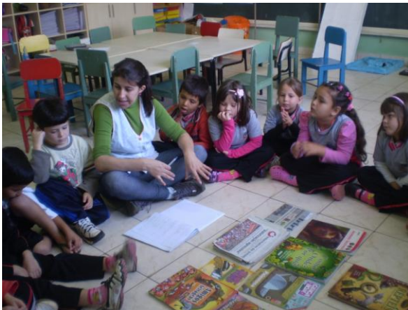
F1- Início do projeto – roda de leitura.