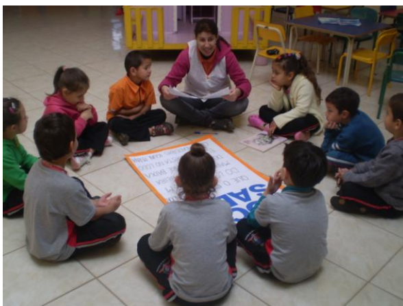
F3- Roda de leitores e registro de Você Sabia?

Nas rodas de conversa as crianças observavam as hipóteses elaboradas previamente pelas imagens ou até mesmo da escrita, com a leitura fiel das informações. No início algumas elaborações eram fantasiosas, misturavam as informações científicas com imaginação, comentando entre elas: “eu acertei”, “estou aprendendo a ler”, “vou aprender a escrever, a professora vai me ensinar”. Com estas atividades de elaborar hipóteses, rever o que foi elaborado, comparar, ler novamente, as crianças se apropriaram dos usos sociais da leitura e da escrita.