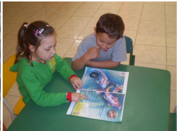
F2- Leitura em duplas

Embora a comunidade em que as crianças estão inseridas seja economicamente carente, o que se percebe é que a maioria tem acesso às informações, participando ativamente do mundo letrado, seja por meio de jornal falado (televisão) ou jornais escritos e livros, isto significa que as crianças estão inseridas nas práticas de leitura e escrita.