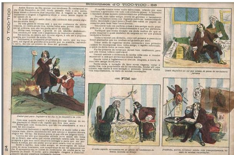
Figura 4: O fim da história de Defoe que se encerra meses depois.

http://memoria.bn.br/DocReader/DocReader.aspx?bib=153079&pagfis=&pesq=robinson+crusoe <acesso em janeiro, de 2014>.