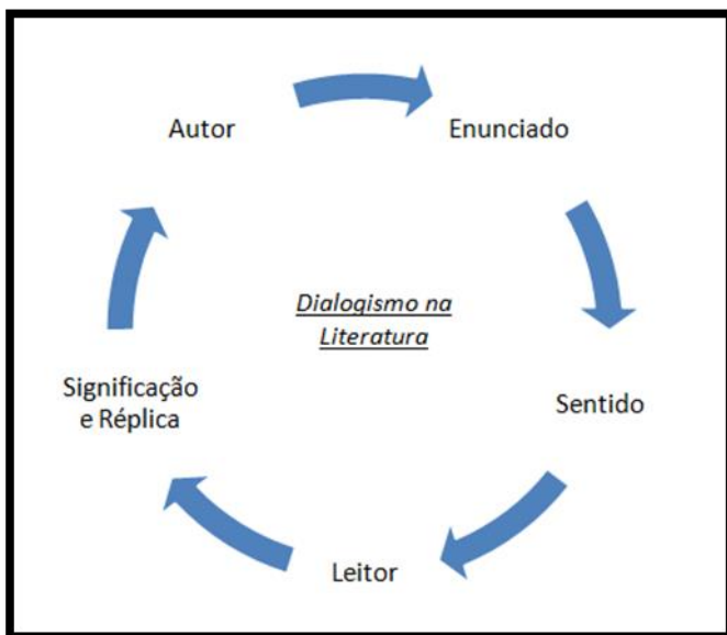
Figura 5: O dialogismo de Bakhtin na literatura.

repleto de sentido, mas o leitor é quem promove uma significação e, ainda, dialoga, responde ao enunciado primário, a fim de travar uma relação dialógica entre: enunciado, sentido, significação, autor, leitor. Criei uma imagem a fim de deixar mais clara a discussão sobre o texto de Bakhtin: