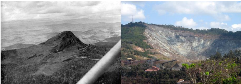
Figura 1: Pico do Cauê, antes (1942) e depois (2007).