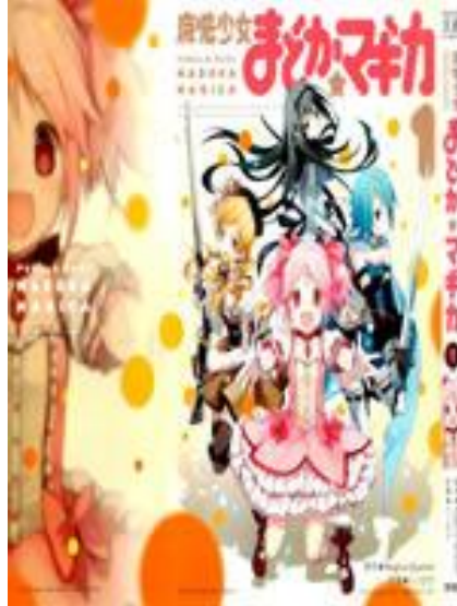
Figura 2 – Mangá Mahou Shoujo