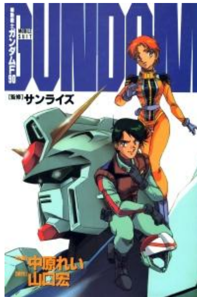
Figura 8 – Mangá Mecha