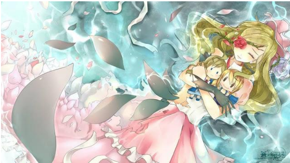
Figura 1 - Mangá Shoujo