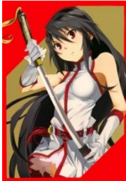
Figura 18 – Mangá Shonen