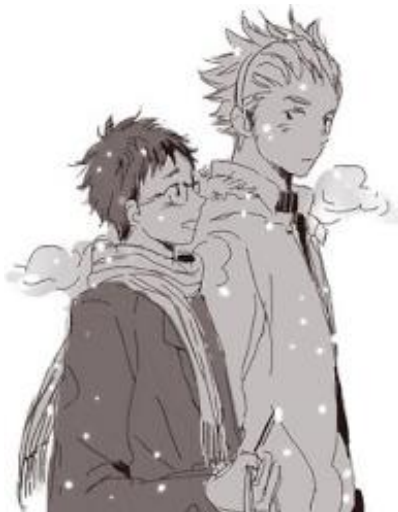
Figura 3 - Mangá Shounen-ai