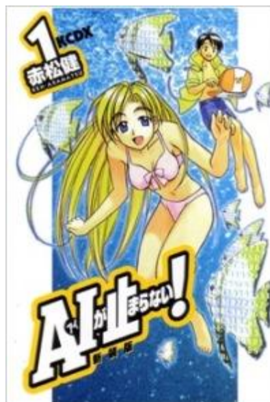
Figura 9 – Mangá Ecchi