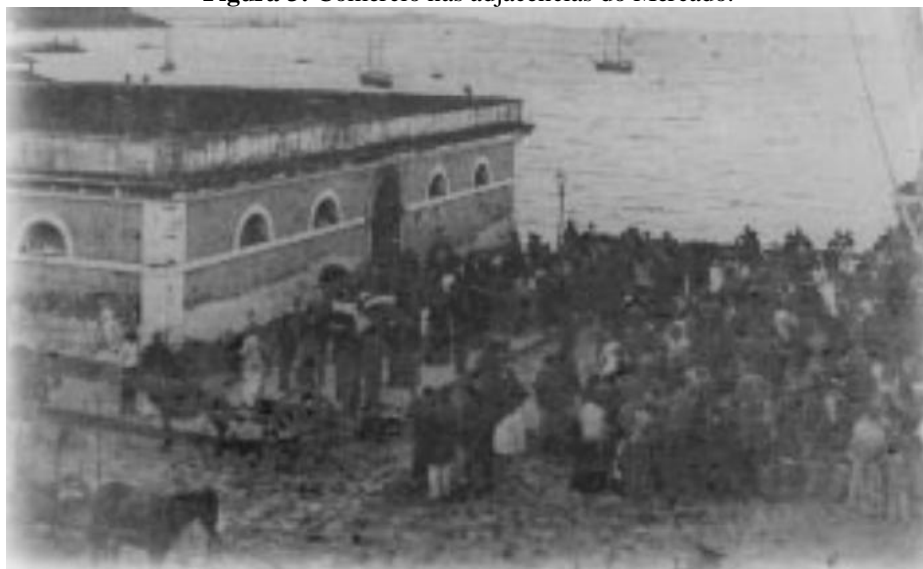
Figura 3: Comércio nas adjacências do Mercado.

presença das carroças importantes para o transporte terrestre de mercadorias. Talvez a carroça do empregado de Eduardo Salles estivesse sendo utilizada para abastecer a cidade assim como as outras capturadas nessa imagem.