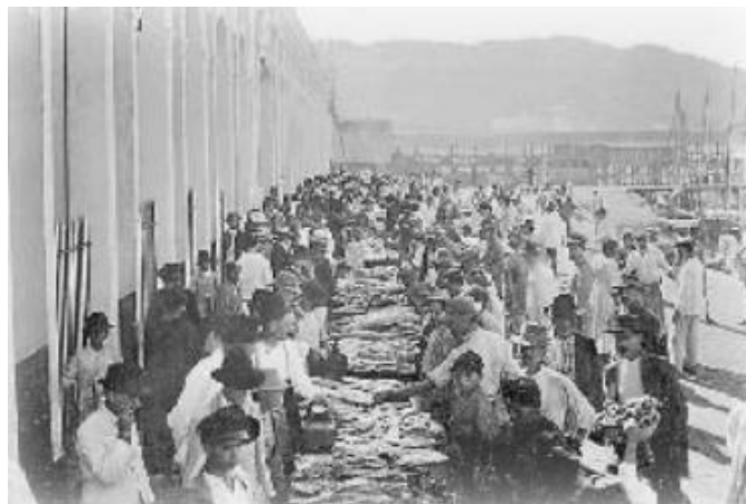
Figura 7: Peixeiros vendendo seus produtos do lado de fora do mercado novo após 1915.

Fonte: Acervo IHGSC, Apud MESQUITA, 2010, p. 152.