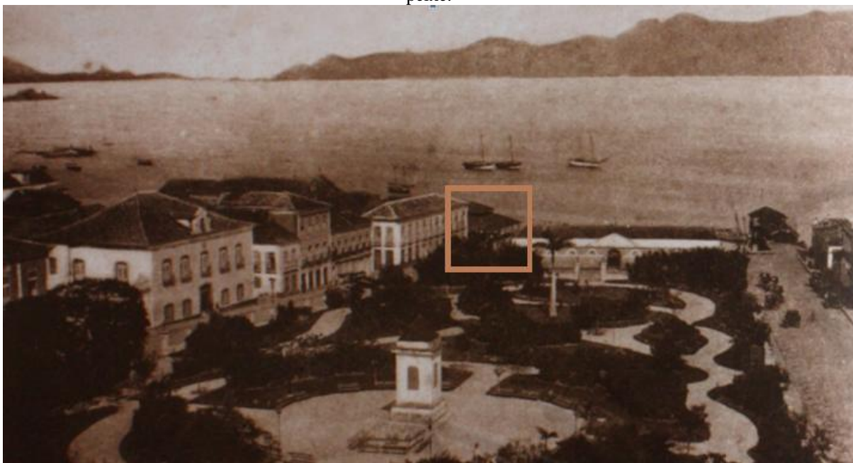
Figura 2: Vista do Mercado a partir da Igreja Matriz na década de 1890. Destaque para o provável galpão do peixe.