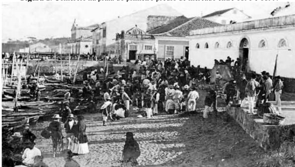
Figura 1: Comércio na praia do primeiro prédio de mercado entre 1890 e 1899.

Os diversos gêneros alimentícios produzidos poderiam ser destinados à região portuária de Desterro ou à Praça de Mercado. A fotografia a seguir mostra o intenso fluxo de pessoas e de canoas ao redor do antigo Mercado Público de Desterro. Podemos imaginar que algumas das canoas mencionadas nos inventários estivessem aportadas na praia do Mercado compondo o cenário registrado nessa imagem.