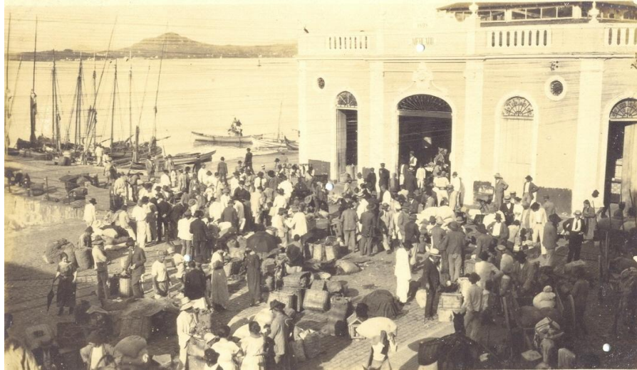
Figura 6: Mercado novo em dia da feira dos colonos.

área sobre mar. Considerou-se que seria mais barato aterrar a área do que comprar terreno de um particular 205 .