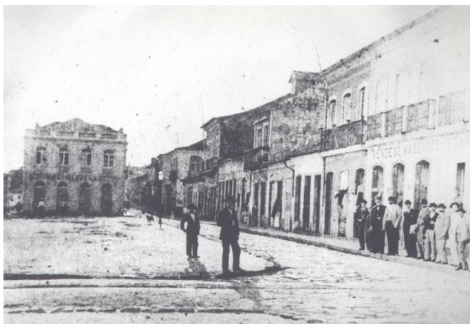
Figura 5: Rua do Comércio, atual Conselheiro Mafra, no final do século XIX.