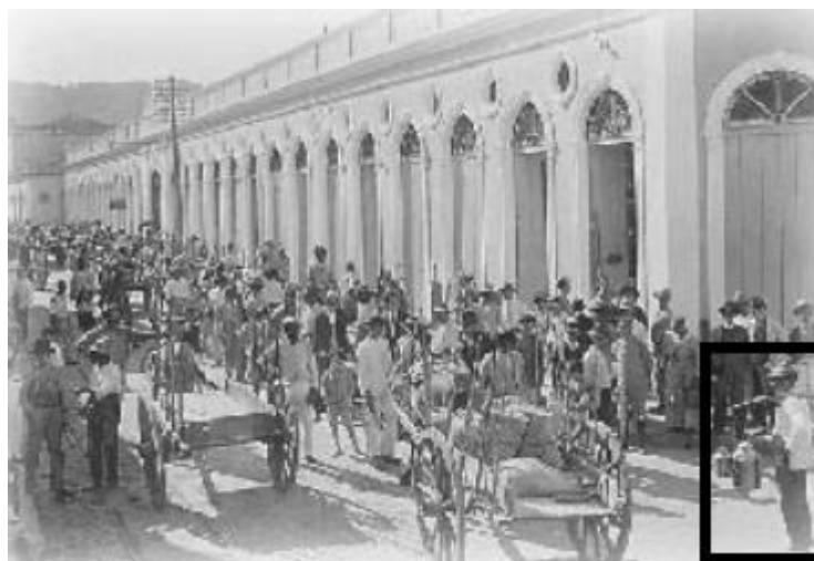
Figura 8: O movimento em torno do Mercado novo.

A figura abaixo (imagem 8) também representa o movimento ao redor do Mercado na atual Rua Conselheiro Mafra.