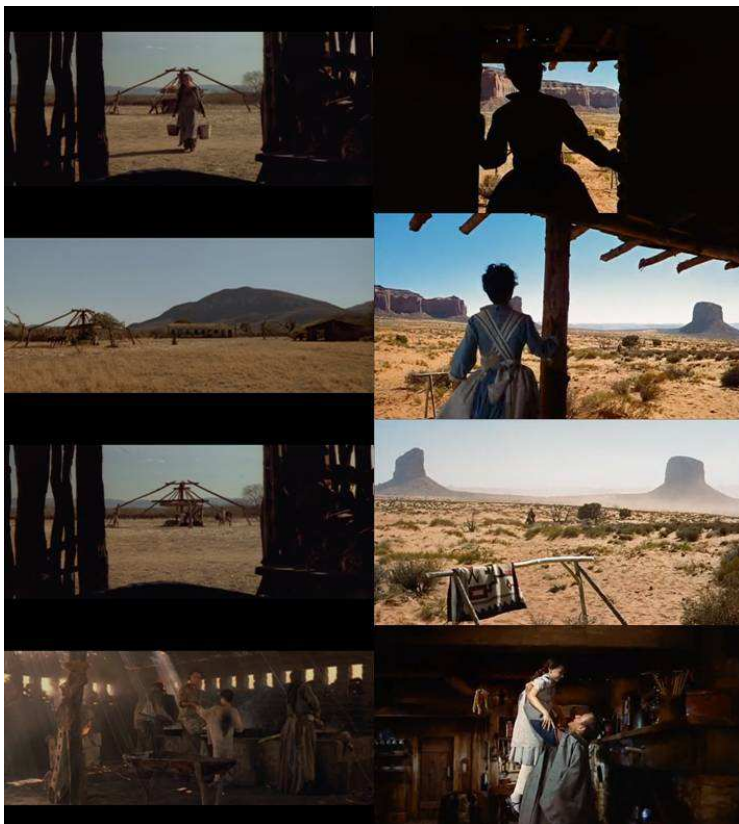
Figura 13: As relações de Abril despedaçado (à esquerda) e Rastros de ódio (à direita): Além da mesma palheta de cores, fica evidente o uso do enquadramento “quadro dentro do quadro” feito por portas e janelas, a amplidão do deserto em relação às pequenas figuras humanas e os ambientes internos escuros e opressores, em tons amarronzados.

Em Abril despedaçado , a forte interpolação de tomadas diurnas e noturnas dá ao espectador a sensação de que o tempo passa alucinadamente, enquanto as poucas sequências de amanhecer e anoitecer parecem diminuir a marcha frenética dos dias. Essa sensação de desaceleração do tempo se dá, também, para indicar ao espectador uma