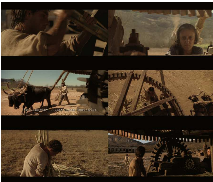
Figura 7: Frames representivos das seqüências dos créditos iniciais, mostrando a família Breves e seus papéis na trama.

A bolandeira funciona, ainda, como uma ampulheta da vida de Tonho, que conta o tempo decorrido ou roda para trás.