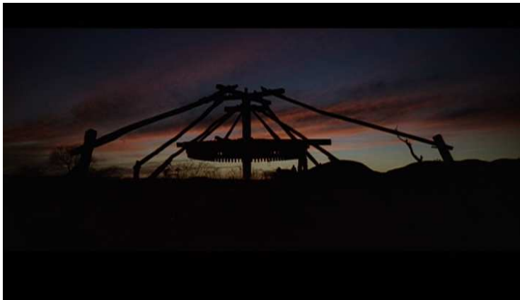
Figura 9: A bolandeira parada, ao amanhecer, aguarda a execução da vingança por Tonho.

Por fim, a bolandeira aparece ainda em close-up , com algumas de suas engrenagens filmadas, extremamente similares às engrenagens de um relógio. Representa, logicamente, o tempo que corre.