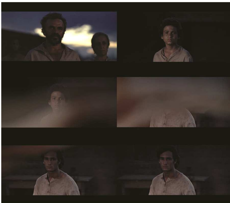
Figura 1: A família Breves reunida, ao amanhecer, em torno da camisa suja de sangue, que serve também de cortina para a transição da câmera nas tomadas de Pacu para Tonho 10 .

sequência em que a família Breves se concentra em torno da camisa suja de sangue do irmão morto, e o pai anuncia: “O sangue começou a amarelar”, significando que a alma do morto ainda não havia encontrado sossego e que, portanto, era momento de vingança.