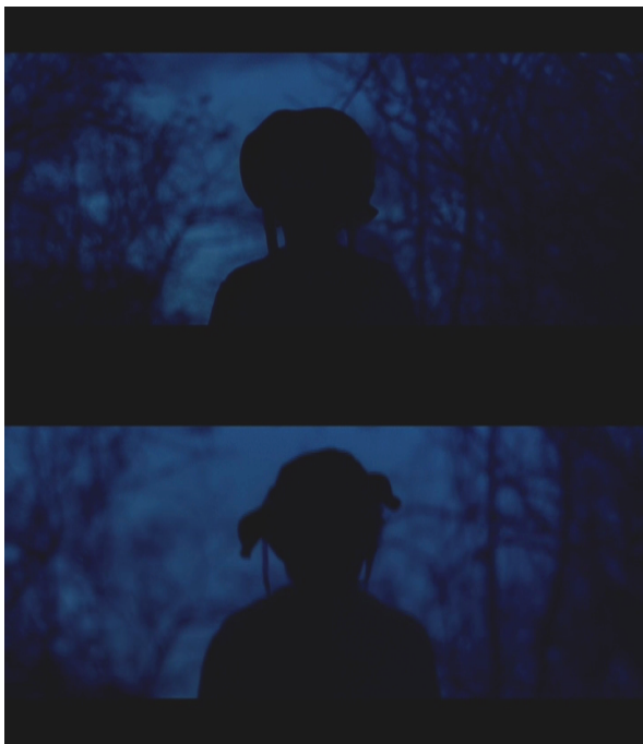
Figura 19: Pacu ao iniciar a narrativa, ainda na escuridão.