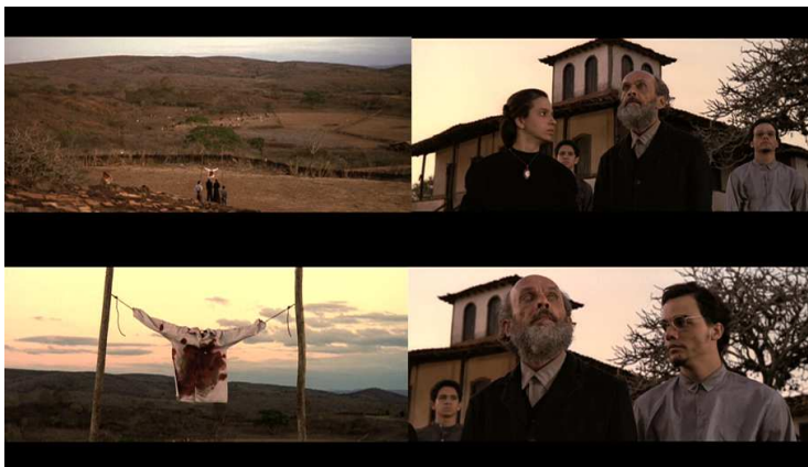
Figura 16: A família de Isaías diz ao patriarca que a camisa do morto, ainda vermelha, amarelou.

Tomadas das camisas aparecem repetidamente durante o filme, como que para lembrar o espectador de que são elas que, por fim, determinam o tempo e a ocorrência da vingança.