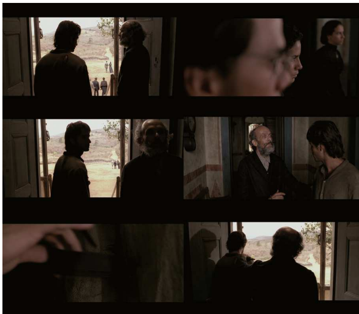
Figura 11: “De um morto para outro”, a faixa negra que indica o homem marcado para morrer.

Nessa citação, embora o tempo seja enunciado literalmente – a trégua irá somente até a próxima Lua – é estabelecida a função desse elemento externo – a Lua – para o desenrolar da trama. Além de a fase da Lua ser determinante para o final do período de trégua, há ainda a cor da camisa manchada com o sangue do morto que aguarda vingança. A mudança de cor, do vermelho ao amarelo, é decisiva para a ocorrência ou não da vingança, segundo reza o código de vendeta vigente.