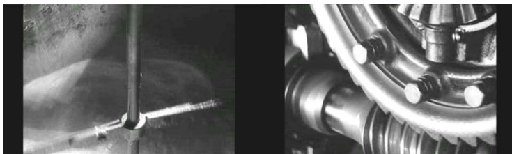
Figura 5: Cenas da desnatadeira de Eisenstein, em A Linha geral , que inspiraram a fotografia de Salles para Abril despedaçado .

Uma das linhas-guias para a tradução, em evidência durante todo o filme, é a imagem da bolandeira, um engenho de madeira para moer cana de açúcar. Nos engenhos de açúcar, é a grande roda dentada que gira sobre a moenda, movimentando as mós. No roteiro, tal mecanismo é descrito como “um relógio primitivo, que marca inexoravelmente a passagem do tempo. Vistos assim, de cima, os animais parecem carregar o mundo.” (BUTCHER; MÜLLER, 2002, p.193). Segundo Butcher e Müller, o uso da bolandeira para a concepção estética de Abril despedaçado foi inspirado no filme A Linha geral , de Eisenstein. O diretor russo apresenta o funcionamento de uma desnatadeira, e sua forma de fazê-lo foi um dos principais modelos da concepção visual de Abril despedaçado .