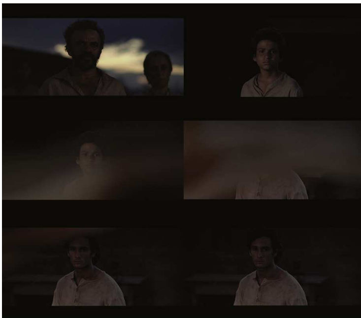
Figura 14: A família Breves reunida em torno da camisa que começa a amarelar e, portanto, indica que Inácio clama por vingança.

Tonho olha secamente para a camisa. Não deixa aflorar a mesma emoção do irmão menor (SALLES, MACHADO e AÏNOUZ, 2002, p. 193, roteiro do filme).