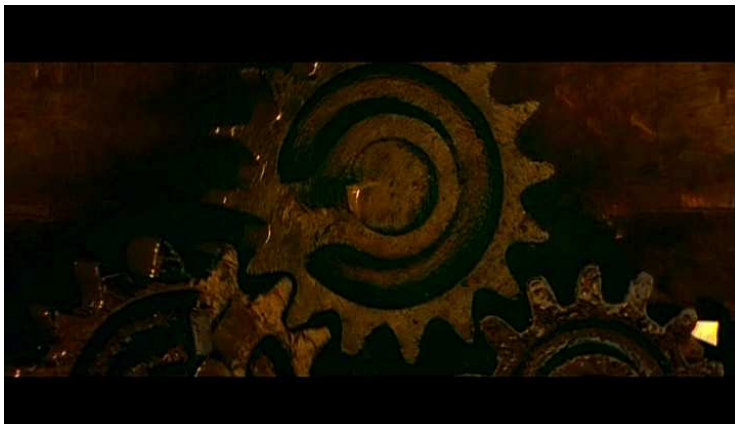
Figura 10: Engrenagens da bolandeira.

Por fim, a bolandeira aparece ainda em close-up , com algumas de suas engrenagens filmadas, extremamente similares às engrenagens de um relógio. Representa, logicamente, o tempo que corre.