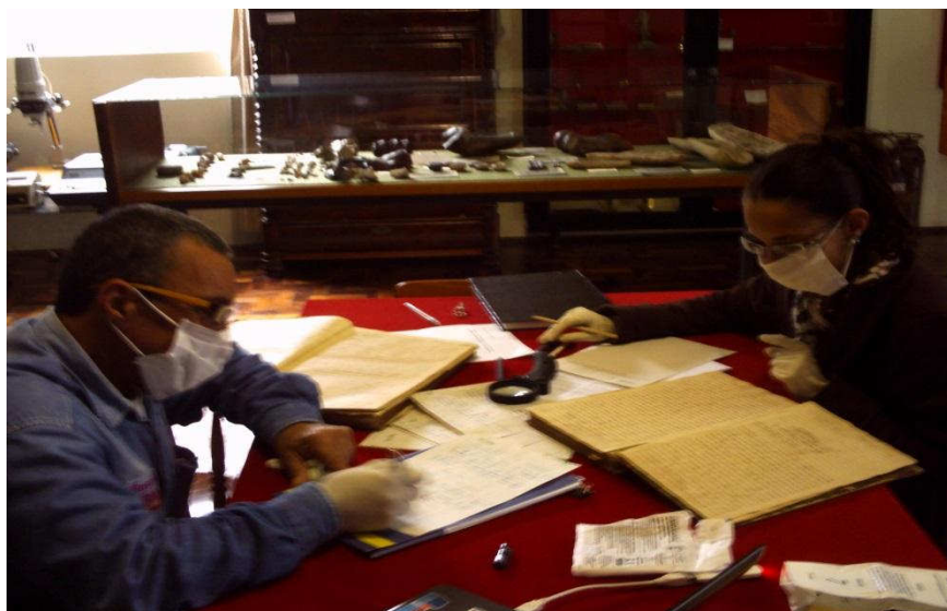
Foto 1 – Bolsistas realizando catalogação da documentação.

A catalogação foi feita de forma a transcrever a linguagem do português do século XIX para o atual, com o auxílio do professor de Letras especialista em português arcaico. Posteriormente, essa transcrição foi digitada em um formato pré-definido pelas bibliotecárias estando prontas para sua indexação no sistema de dados. O sistema de dados referido está sendo viabilizado pela parceria com o profissional da área da tecnologia da informação com as bibliotecárias, as quais estão verificando diversas opções de programas, para que escolham o que melhor se adapte aos objetivos do projeto.