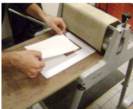
Figura 2: Estudantes aprendem os processos da tradição da gravura artística

Durante a preparação do curso de extensão, a equipe se dedicou a testar diferentes possibilidades de transferência do desenho do circuito para a placa de cobre. Durante esta etapa, foram testados alguns procedimentos alternativos que também estão sendo utilizados na transferência das imagens e nas gravações das matrizes de cobre usadas nas gravuras artísticas. Os procedimentos alternativos de gravura artística notáveis foram adaptados às gravações das placas de circuito impresso (PCI). Para isso, iniciamos ensinando a todos os participantes do grupo a gravar, entintar e imprimir uma imagem conforme a tradição da gravura em metal (HAYTER, 1981), utilizando processos diretos de gravação (Fig.2).