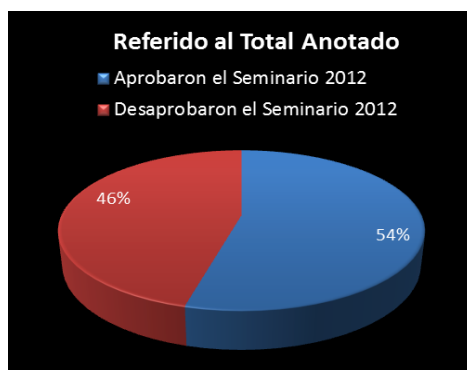
Gráfico N° 1: Porcentajes de aprobación - Seminario 2012.

A modo de ejemplo se presentan los resultados que corresponden a los ingresantes del año 2012, en sus tres turnos de Ing. Química. Con los valores del Cuadro N° 3, se obtuvieron los siguientes gráficos N° 1 y N° 2: