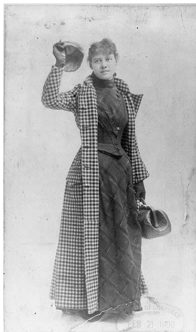
Fig. 3 – Nellie Bly, em 1890