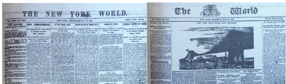
Fig. 2 – À esquerda, a última capa do World sob o comando de Jay Gould (10 de maio de 1883). À direita, a capa do dia 24 de maio de 1883, com o World já sob o comando de Pulitzer.

O novo dono também alterou a inscrição do nome do jornal na capa. Em vez de “ The New York World ”, Pulitzer determinou que se escrevesse apenas “ The World ”, com o desenho de dois globos entre as duas palavras (Fig. 2). “Para criar um novo jornalismo a partir do velho, primeiro ele [Pulitzer] tinha que estar realizado nos fundamentos do trabalho de jornal: diagramação, titulação e apuração das notícias” 60 (JUERGENS, 1966, p. 28).